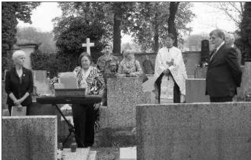
VZPOMÍNÁME. Účastníci vzpomínkové akce na osovském hřbitově.

Informační občasník Osova a mikroregionu Horymír 6/2017 (143)