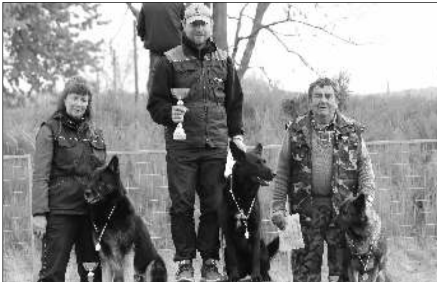
NA BEDNĚ. Vítězové letovského jarního závodu o putovní pohár.