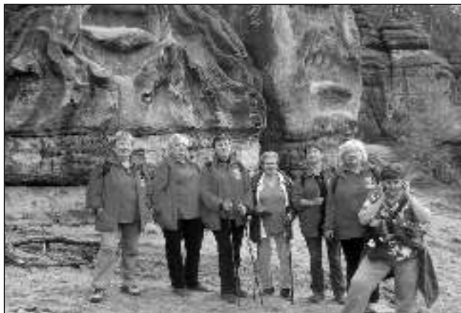
VE SKALÁCH. Holky v rozpuku před Čertovými hlavami.

Pak jsme se vydaly po modré značce a dostaly se do Liběchova. Zde jsme chtěly navštívit barokní zámek z doby kolem roku 1730, ale bohužel byl zavřený. Tak jsme se občerstvily v místní restauraci a autobusem dojezdy do Mělníka. Prohlédly jsme si zdejší