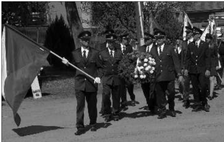
V PRŮVODU. Členové sboru dobrovolných hasičů v Radouši při oslavách 120. výročí založení svého sboru.