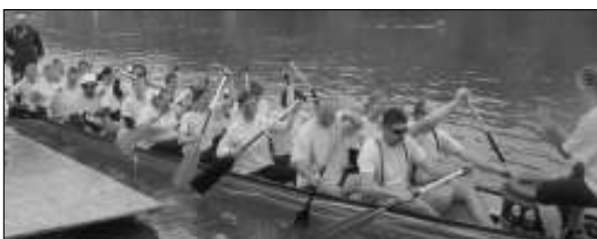
JEDEM! Sněženy a Machři vyrážejí do boje.

Začátkem května se tým ZŠ Rěvnice částnil závodů dračích lodí v Dobřichovicích. Původně jsme sice pláno-