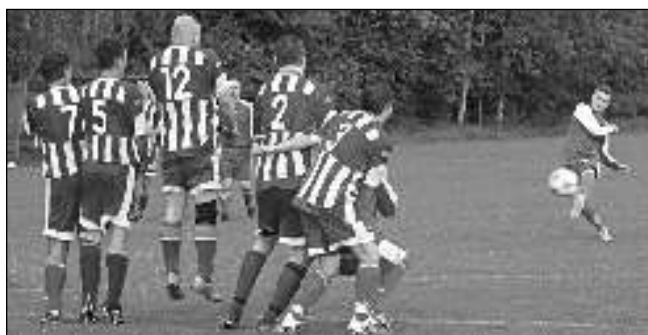
NEROZHODNĚ. V domácím zápas s favorizovaným Mníškem dokázaly řevničtí fotbalisté »vyvážit« remízu 1:1.

* 36. ročník turistického pochodu Kudy uhaněl Šemík pořádá TJ Čechie Karlín Praha 27. 5. Start tras v délce 17, 28, 35 (cyklistická) a 48 km je mezi 6.45 a 10.30 na nádraží v Zadní Třebani, cíl na fotbalovém hřišti v Neumětělicích. (szi) * Možnost zahrát si volejbal či nohejbal na multifunkčním hřišti s umělým povrchem nabízí Obec Lety. Klíče od lavice se sloupky a sítě je možné získat po dohodě s obsluhou hospůdky Offside. (bt)