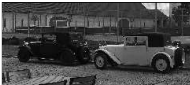
PŘED STARTEM. Automobiloví veteráni na všeradickém Zámeckém dvoře.

Po snídani měli účastníci na programu rozpravu, v 9.30 následoval start do první etapy. Trasa vedla přes Koneprusy, Tetín, Srbsko, serpentinami do Hostimi, údolím ke Svatému Jánu