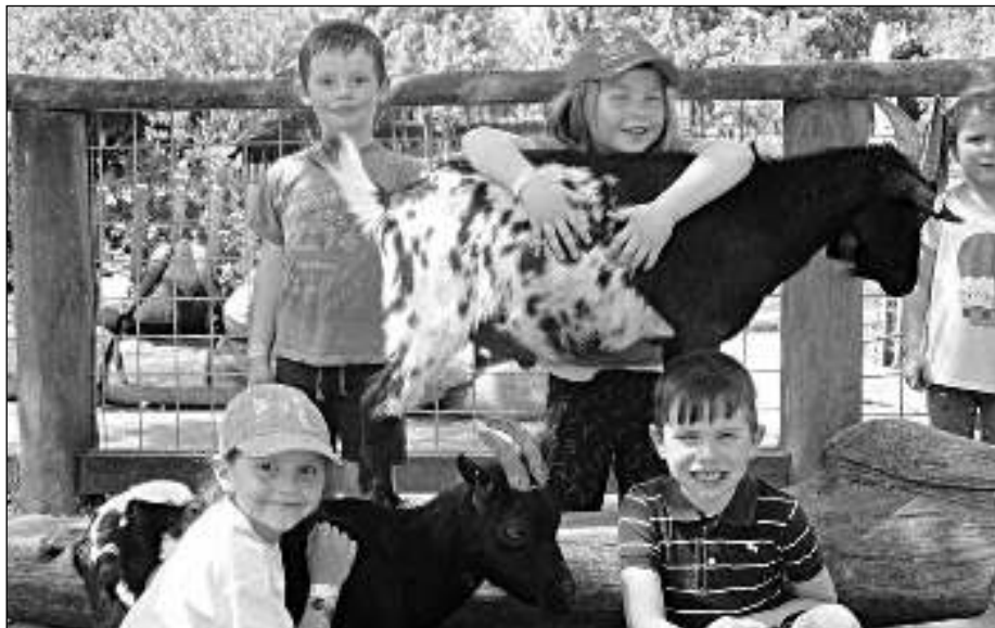
V PARKU. Karlštejnští předškoláci při návštěvě parku Mirakulum.