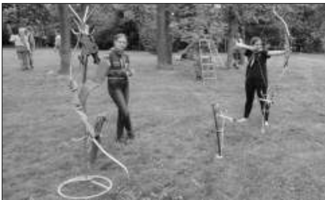
MĚLI NAPILNO. Skauti druhý květnový víkend uspořádali lukoládu a pustili se i do výroby pramice.

JEDENÁCTÉ LUKOLÁDY V DOBŘICHOVICÍCH SE AKTIVNĚ ZÚČASTNILO NĚKOLIK DESÍTEK RODIN