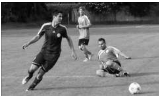
NEVYŠLO TO. Letovskému áčku se v uplynulé sezoně dařilo, jarní zápas s Tochovicemi mu ale doma nevyšel - prohrálo 0:3.