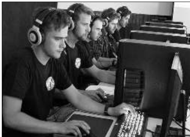
NA TURNAJI. Účastníci a vítězové všeradickeho turnaje.

Ve Viziňě se v pátek 30. června vítaly prázdniny. Pro děti byla připravena akce, která se nesla v duchu středověku. Plnilo se 10 disciplín v tomto duchu - hod vidlemi do balíků slámy, zdolání stohu z balíků, navlékání korálků pro princeznu, zdolání brodu na koni... Velký úspěch mělo pečení bramborových plácek. U disciplín vypomáhali rytíři ze skupiny Výsehradští, kteří na závěr všechny seznámili se svojí zbrojí i s ukázkou soubojů. Prázdniny byly zahájeny a můžeme si je užívat plnými doušky. Na rozloučení s létem se chystá ve Viziňě Trotlík - netradiční cyklistický závod pro celou rodinu. Přijďte si zazávodit 2. 9. Sraz je ve 14.00 u hasičárny. Jana FIALOVÁ, Viziňa