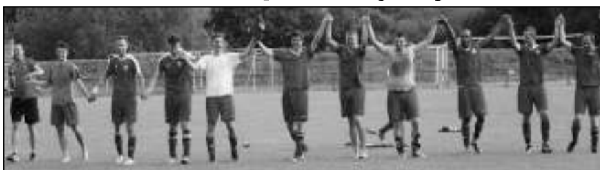
DÍKY. Děkovačka karlštejnských fotbalistů po posledním jarním zápase na svém hřišti.

Pokud byste pátrali po podobném umístění celku z podhradí, museli byste zabrousit hlouběji do historie. Podle slov karlštejnských pamětníků se o čelo okresu naposledy hrálo v 80. letech. Karlštejn pak povětšinou pendloval mezi přeborem a 3. třídou. Úspěchem bylo 7. místo v okrese v sezoně 2002/2003, které letos Karlštejnští ještě o tři příčky vylepšili. Konečný výsledek je o to cennější,