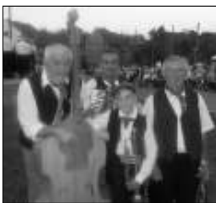
U KRAJANŮ. Třehusk v chorvatských Dolanech.

Dolany - Na »kuchařské vitráži« v chorvatských Dolanech vyhrávala staropražská kapela od Berounky Třehusk.