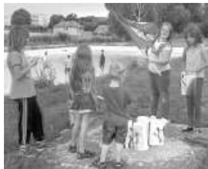
KACÍŘI. Děti s kacířskými čepicemi na »břehu Rýna«.

Průvod kacířů pod dohledem přísných strážů do-