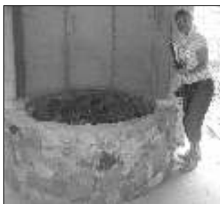
VODA PRO KAŠNU. Vodou ze středověké studny bude napájena nová kašna.

Se sklepem jsme v našich plánech počítali - v budoucnu tu vznikne vinotéka, pokračuje Kozák s tím, že objevení studny naopak znamenalo pro investora i stavebníky »čáru přes rozpočet«.