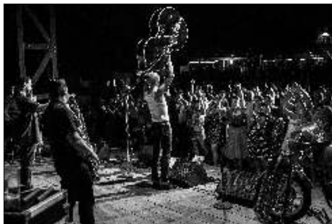
LÍBILI SE. Velký úspěch na jednom z minulých ročníků festivalu sklídila německá kapela Boppin'B.

18. 7. 17.30 JÁ PADOUCH 3 3D 18. 7. 20.00 UKRYT V ZOO 19. 7. 17.30 SPIDER-MAN: HOMECOMING 3D 19. 7. 20.00 MILOVNÍK PO PŘECHODU 20. 7. a 21. 7. 17.30 LETÍME! 20. 7. a 22. 7. 20.00 (So 17.30) VALERIAN A MĚSTO TISÍCE PLANET 21. 7. 20.00 VETŘELEC: COVENANT 22. 7. 20.00 DUNKERK 23. 7. 16.00 ANDRE RIEU Z MASTRICHU (přenos koncertu) Od 25. 7. dovolená.