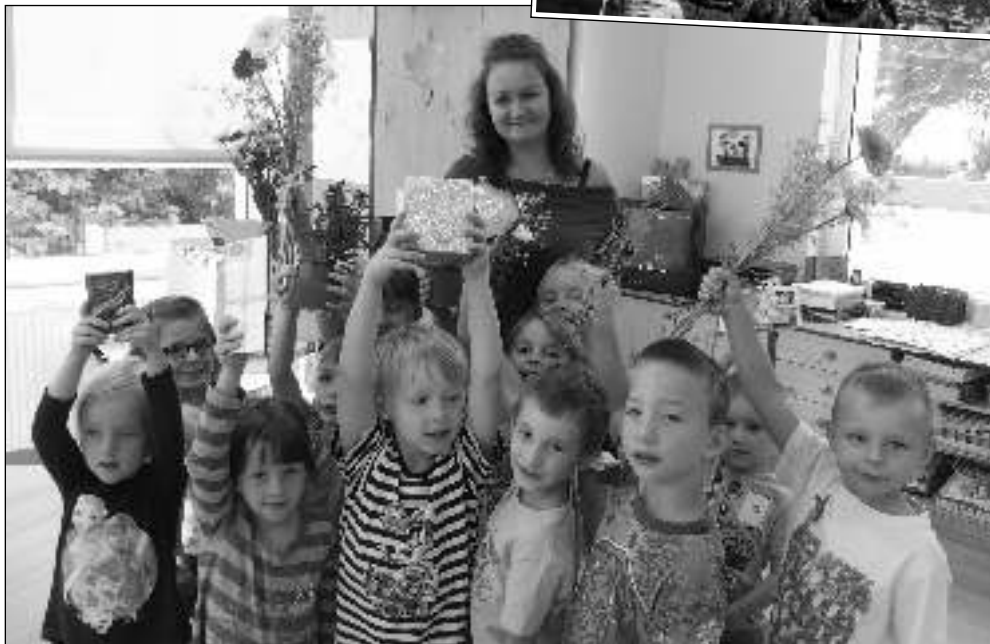
NAPOSLED. Prázdniny 14. července začaly i dětem ze zadnotřebské školky.