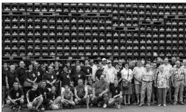
V PIVOVARU. Řevničtí hasiči a jejich němečtí kolegové při společné návštěvě pivovaru Altenburg.

Podle nejnovějších informací z berounské radnice v uzavřeném úseku