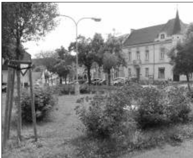
CHLOUBA ŘEVNIC. Zelené plochy na hlavním řevnickém náměstí. Někteří obyvatelé města se bojí, že po rekonstrukci zmizí.

Stávající dva projekty směřují cíleně či z neznalosti souvislosti či na vůli radnice ke zničení naší chlouby, našeho kulturního dědictví. Bude-li v budoucnosti třeba větší podia, postaví se za Zámečkem, tak, jak tomu bylo v minulosti. Palackého náměstí skýtá plochu pro větší počet stánků. Po rozhovoru s hasiči je jasná souvislost s vytopenými domy pod nově vydlážděnou Sochorovou ulicí, kde se to ještě nikdy po silném dešti nestalo - zmizela vsakovací plocha. Jak to bude vypadat s domy na severní