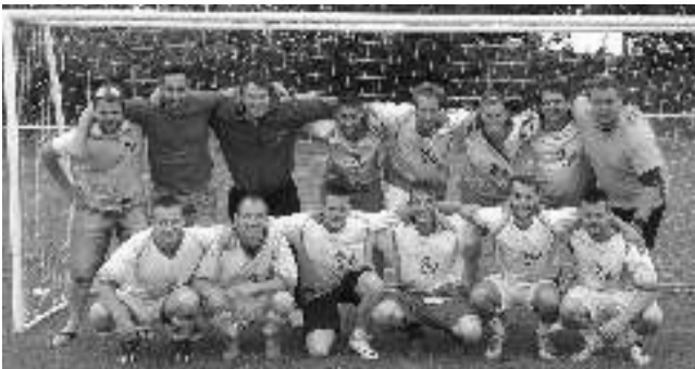
Pátý ročník turnaje v malé kopané o Brdský pohár uspořádal 1. 7. klub FK Líteň. V konkurenci šesti družstev si prvenství vybojoval Žabí hlen (na snímku), který ve finále porazil 3:2 favorita, družstvo SK Tetín. Rozhodující gól padl 5 minut před koncem z penalty. Text a foto Milan KUDĚJ, Líteň