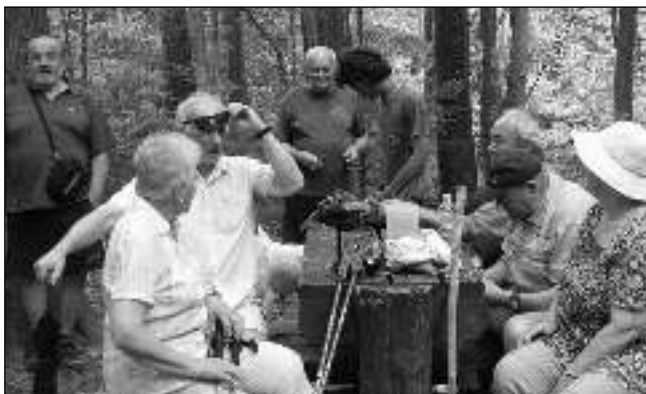
PŘESTÁVKA. Výprava Klubu přátel Karlštejna při odpočinku během jednoho ze svých výletů.