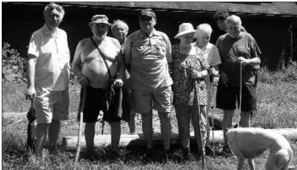
NA VÝLETĚ. Členové Klubu přátel Karlštejna na výletě ke Královské studánce, Bubovickým vodopádům a do Srbska.

Karlštejn, Liteň - Bufet u čerpací stanice v Litni vykradl poslední červnový den neznámý zloděj. Odnesl si zásuvku pokladny s penězi. „Dne 30. června, těsně před pátou hodinou ranní, bylo na linku 158 oznámeno, že se neznámý pachatel vloupal do bufetu v liteňské Nádražní ulici,“ uvedl velitel karlštejnských policistů Jaroslav Dolejší. Zloděj odvrátil cylindrickou vložku zámku u vstupních dveří, ale dovnitř se mu vniknout nepovedlo. Smůlu měl i když se pokusil vypáčit okénko do chodby k WC. „Proto kamenem rozbil trojdielné okénko na WC, vzniklým otvorem okno otevřel a skrz něj vnikl do objektu,“ popsal Dolejší s tím, že lupič ze skříňky za pultem odcizil zásuvku z kasy s finanční hotovostí. „Krádeží a poničením věcí způsobil majitelům objektu škodu ve výši bezmála 13 tisíc korun,“ uzavřel velitel. (mif)