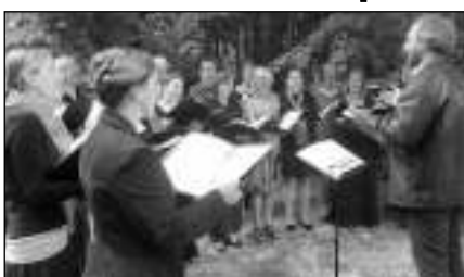
Canto Carso v Osově.