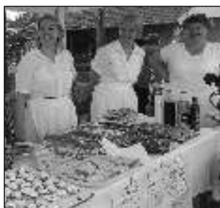
České kuchařky u stánku se svými dobrotami.

Na vitráži se se svými kuchařskými specialitami prezentovali zástupci jednotlivých národností žijících na severu Chorvatska - kromě pořadajících Čechů také Maďarů, Rakušanů, Němců a Ukrajinců. Součástí akce byl bohatý kulturní program. Třehusk, který v Dolanech vystupoval již poněkolkáté, sklídl velké ovace několika stovek diváků - zejména za písničku Do Dolan, kterou zdejším krajanům věnoval. (mif)