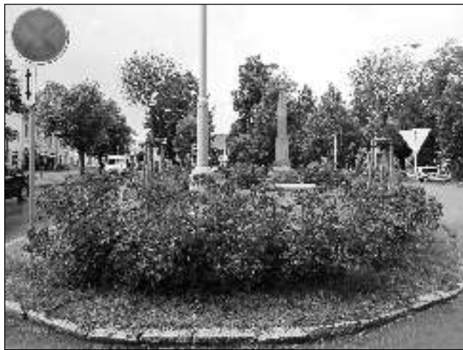
TONA V ZELENI. Řevnické náměstí je plné stromů a keřů. Zůstane takové i po navrhované rekonstrukci?