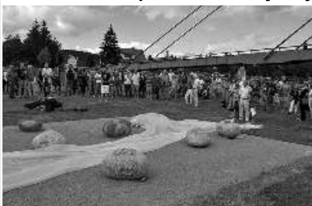
Vernisáž Sochařského symposia, jehož 7. ročníku se v Dobřichovicích účastnili věhlasní sochaři Stanislav Kolibal, Hiromi Nakagawa a Petr Novák, se na zdejší louce pod lávkou pro pěší uskutečnila v neděli 13. srpna. Hudebně je doprovodil písničkář Vladimír Merta, akci zaznamenávala Česká televize.