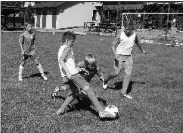
V KOCHÁNKÁCH. Malí všeradičtí fotbalisté na letním soustředění v Kochánkách na Mladoboleslavsku.

Přesto, že jsme byli denně 10 hodin na hřišti, byli kluci pořád plní energie, což se projevovalo hlavně večer, když měli jít spát. Na druhou stranu nás velice těšilo, že polední klid byl do 14.30, ale už před 14.00 pobíhaly po hřišti nedočkavé skupinky a střílely na bránu. „S výběrem místa jsme byli maximálně spokojeni,