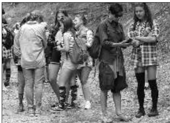
NA TÁBOŘE. Řevničtí cestovatelé v okolí kempu.

„Přšlo a bylo krásně... Nejdřív jsme se schovali v nízkém podrostu a pak se stihli i vykoupat!! Voda je tady opravdu studená, jako každý rok.“ bylo mj. zapsáno v táborovém deníku. Badatelé potkali několik kmenů, které okolo ohně tančily rituální tance: holubí, tanec smrti, tanc