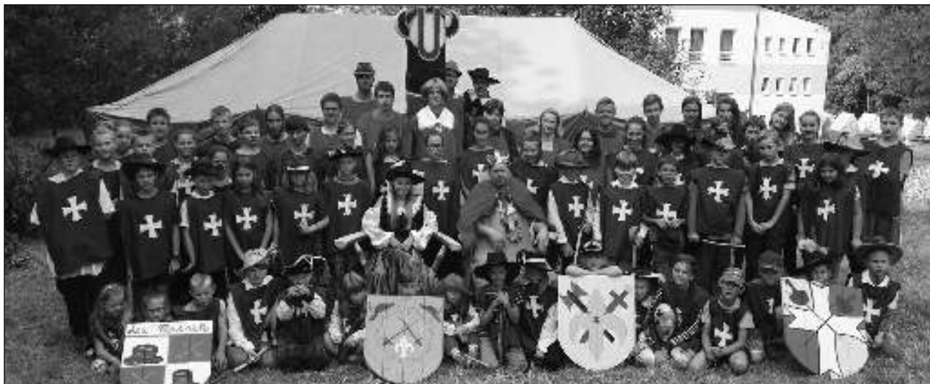
MUŠKETÝŘI. Účastníci letního tábora T. K. Záskalák v Mrtnice u Komárova.

Aktuální zprávy z Litně, Leče, Bělče, Vlenců a okolí 9/2017 (72)