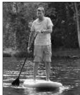
NOVINKA. Jeden z paddleboardů na Berounce.

Sousedská lodní samoobsluha zase nově funguje - jako první v dolním Poberouni - v Černošicích. Jde o samoobslužnou půjčovnu lodí, kterou v někdejší Chvojčkově plovárně provozuje tamní skupina filantropů, sousedů a přátel Klubu Ferenc Futurista. Dobrovolníci i nadšenci během léta opravili terén, postavili a natřeli sklad pro lodě. Projekt byl finančně podpořen Nadací Via v programu Živá komunita. Klíče a pádla jsou k vyzvednutí vždy v 10.00 nebo v 15.00 od úterý do neděle v kavárně Bárka na Vrážské ulici, rezervace jsou možné na telefonu 773 508 882. Pavla NOVÁČKOVÁ