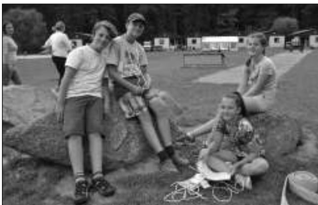
VE LHOTĚ. Mladí vížinští hasiči na prázdninovém soustředění ve Smetanově Lhotě.

V úterý 22. srpna vyrazili hasiči z Vižiny na soustředění do Smetanovy Lhoty u Čimelic. Ubytovali jsme se do chatiček, trénovali a hráli hry. Dělalí jsme plánek tábora a hledali obálky s puzzle, které jsme pak skládali. Ve středu jsme šli pěšky do Smetanovy Lhoty. Cestou jsme hráli klíště a číslovanou. V obchodě jsme si nakoupili dobrotu, pohráli na dětském hřišti a zjišťovali v týmech odpovědi na otázky - např. jak se jmenuje starosta obce, jak daleko je to na Zvíkov, jestli je v úterý odpoledne otevřený obchod. Pak jsme se vrátili na svíčkovou, jež byla k obědu. Po poledním klidu jsme se koupali v bazénu a trénovali střelbu ze vzduchovky, vázání uzlů a značky. Po večeri jsme hráli hru Amerika, přehazovanou, flujdum a zpívali s kytarou. Ve čtvrtek dopoledne jsme hráli v lese šipkovanou a hledali poklad. Po kuřizku k obědu jsme se koupali v ledovém bazénu, stříleli ze vzduchovky, ležli na laně a motali hadice na čas. Po večeri jsme hráli kasino a mimoně. Navečer jsme rozdělali oheň, zpívali písničky a těšili se na bojovku. Než jsme vyrazili, museli jsme rozšifrovat tajné heslo v morseovce. Vyšlo nám »abraxas«. Cesta byla vyznačena svítícími tyčinkami. Po cestě na nás vybaflí Lu-