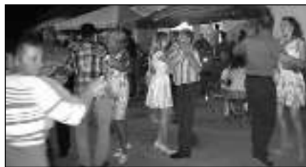
VŠICHNI DOBRÍ RODÁCI. Tanečníci na návsi v Gerniku.