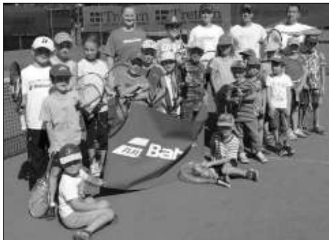
Účastníci posledního z letních kempů Sportclubu Řevnice.

„Pohybovky jsme dělali i v minulosti, ale letos na ně budeme klást větší důraz. Uděláme k nim náborovou