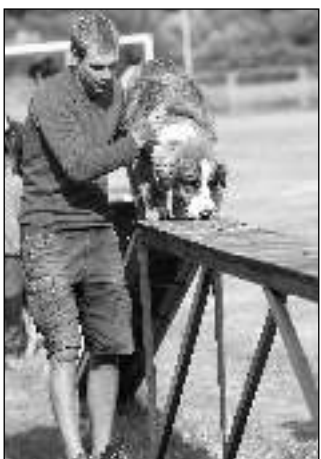
KURZY. Na letovském cvičáku začaly 3. září podzimní kurzy pro štěňata.

Prázdniny máme za sebou a se začátkem září začalo být živo i na cvičáku Kynologického klubu (KK) Lety. V neděli 3. 9. jsme zahájili podzim-