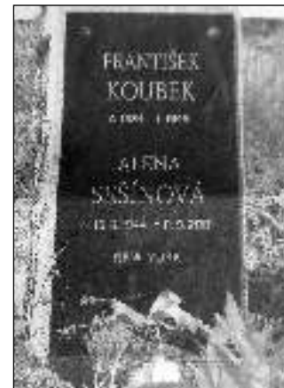
Hrob Aleny Sešínové na hřbitově v Karlštejně.