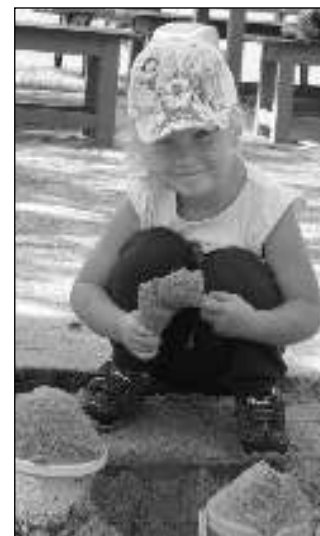
PRVNÍ DEN VE ŠKOLCE. Prázdniny skončily - 4. září přivítala své žáčky i MŠ Karlštejn. Dětičky se do školky moc těšily.

Karlštejnské na zájezdu doprovázela, se tak narychlo přesunul do přílehlého podlouhí. Třehusk odehrál nejen staropražské kuplety, ale přidal i světové hity s bravurním trumpetovým sólem Saši Skutila. Místní hudebníci slavnostní večer završili hity z muzikálu Jesus Christ Superstar i Mamma Mia. (Dokončení na str. 8)