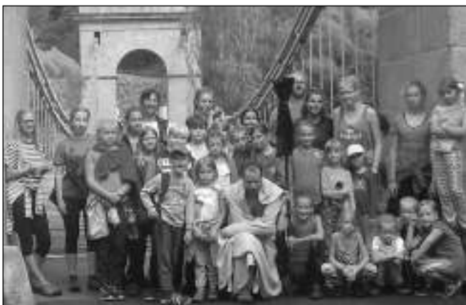
NA VÝLETĚ. Děti z Klíčku na řetězovém mostě, který se přes řeku Lužnici klene u obce Stádlec.