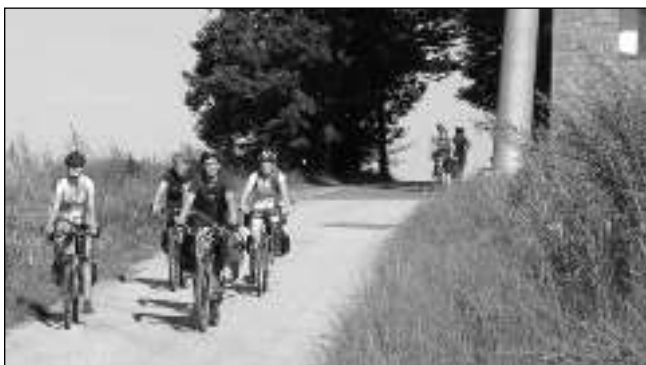
NA CESTĚ. Skauti při putování jižními Čechami.