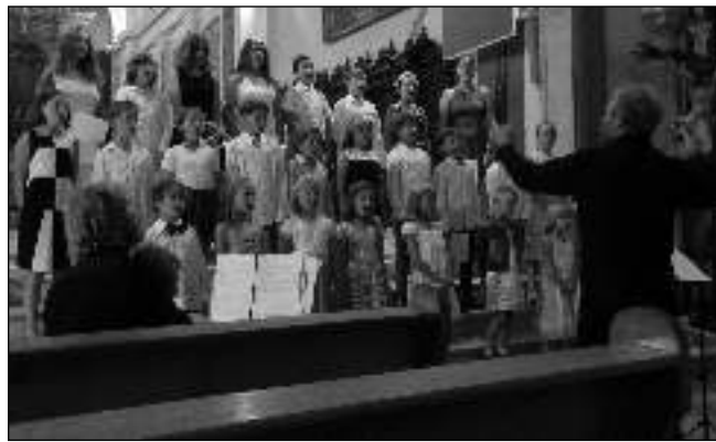
NA SOUSTŘEDĚNÍ. Sbor Mifun při jednom ze slovinských vystoupení.

12. 9. a 14. 9. 17.30 (Čt 20.00) NERUDA 12. 9. 20.00 ŽIVOT ZA ŽIVOT 13. 9. 17.30 PO STRNIŠTI BOS 13. 9. 20.00 DAVID GILMOUR V POMPEJÍCH - záznam koncertu 14. 9. a 16. 9. 17.30 (So 20.00) VÍNO NÁS SPOJUJE 15. 9. 17.30 LETÍME 15. 9. 20.00 BATTY SEAL: NEBESKÝ GAUNER 16. 9. 15.30 HURVÍNEK A KOUZELNÉ MUZEUM 16. 9. 17.30 NEJSLEDOVANĚJŠÍ 17. 9. 16.00 SNĚHURKA - záznam opery 19. 9. 17.30 KRÍŽÁČEK 19. 9. a 23. 9. 20.00 (So 17.30) LOGANOVÍ PARTÁCI