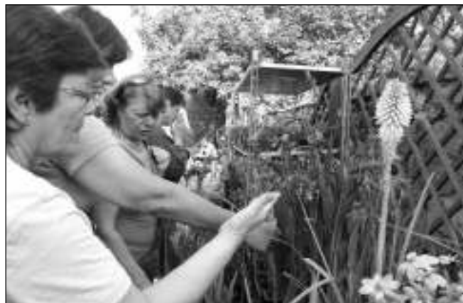
MEZI KVĚTY. Osovská výprava na výstavě květin v Čimelicích.