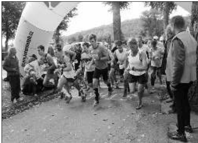
VPŘED. Start hlavního závodu.