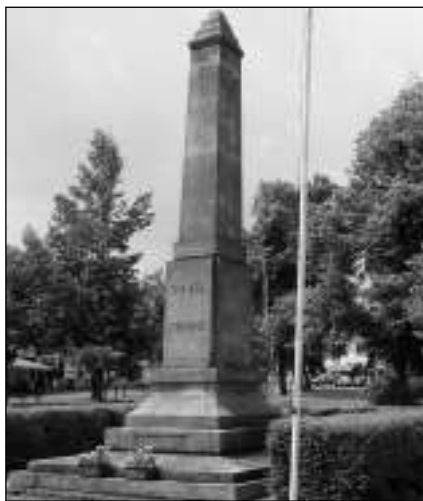
NÁPAD. Propojí pomník s kašnou na náměstí nová cesta?

Městečko Řevnice je unikátní tím, že ve srovnání se širším okolím má náměstí. Nepatří sice k největším, ale jeho jedinečnost tkví ve skutečnosti, že je tak trochu parkem, který by se v budoucnu dal využít pro ještě více příjemných chvil v něm strávených. Ovšem ne zaslážděnými plochami. Toho necitlivého »betonu« se stále se rozrůstajícími velkoměstmi a městy menšími je již pozeňhaně. Vážme si naší řevnické výjimečnosti a neněme si ji kvůli něčím odlišným představám. Myšlenky, slova a boj za ochranu přírody nejsou klíše. Nejen vinou lidí, ale i vinou čím dál tím většího počtu přírodních pohrom až katastrof jsou důsledky stále ničivější. Kolik jen vlivem bouří, vichřic, snad už i tornád u nás padne lesních porostů i vzácných stromů v obcích a parcích! Rovněž zvyšující se počet záplav k tomu přispívá splavením půdy a podemláním. Likvidace a nahrazování škod je čím dál tím obtížnější. Ne nadarmo naši předkové vysazovali aleje, větrolamy, nebo alespoň rozsá-