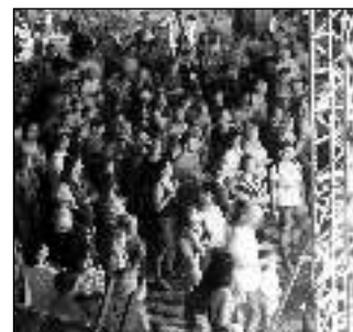
Návštěvníci Vinařských slavností čekající na jeden z večerních koncertů.

* Druhá etapa výstavy Stavební vývoj dobřichovických domů v plánech a fotografiích je do 30. 9. instalována v zámku Dobřichovice. (ak)