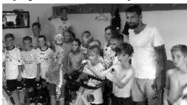
Malí všeradičtí fotbalisté s Milanem Barošem.

Předposlední prázdninovou sobotu se na hřišti FK Všeradice 1932 uskutečnil tradiční Poutový turnaj přípravky a mladších žáků. Malí fotbalisté plnili roli »předskokanů« podvečerního prvního mistrovského utkání nové sezony místního A-mužstva. To se chystalo změnit síly se Žebrákem. Hned po poledni se na hřišti představili mladší žáci Letů, kteří sehráli s našimi borci tři vzájemná přátelská utkání (3x20min). Odpoledne se na hrací ploše představily týmy FK Hořovicko, SK Slavia Praha a dvě družstva domácích FK Všeradice. Hrál se 1x14 minut, každý s každým, dvoukolově. Cílem nebyly výsledky, ale pořádně si zahrát fotbal. Vítězem