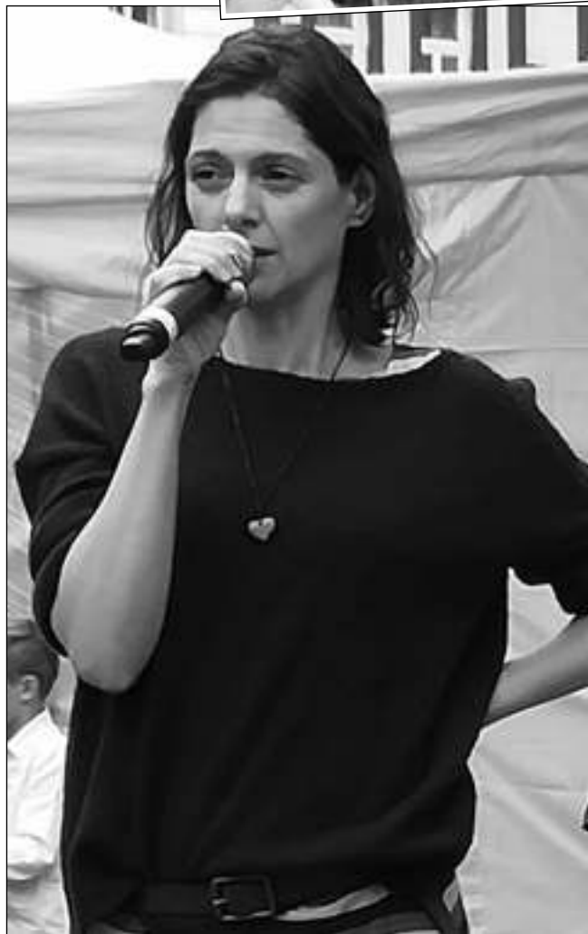
ISSOVÁ V ŘEVNICÍCH. Třetí ročník rodinného festivalu Hravě a zdravě se konal 2. září v Řevnicích. Zúčastnila se ho také populární herečka Klára Issová. (Viz strana 2)