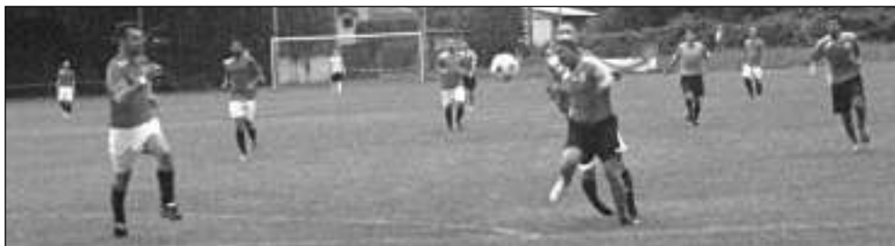
NEVYŠLO TO. Letovští fotbalisté prohráli na svém hřišti s mužstvem Hýskova 1:3.

Akce s bohatým doprovodným programem se koná 30. 9. od 9.00, zázemí má v Lesním divadle. Budete si moci vyzkoušet, jaké to je být v roli nevidomého, nebo naopak ukusit roli asistenta, který nevidomému dělá partáka. Hůlky budou k půjčení na místě, přichází před závody česká krátká instruktáž. Trasa měří šest kilometrů, budou na ní kontrolní stanoviště. Během dne nebude chybět doprovodný program pro celé rodiny, kreativní dílny, líčení, besedy, masáže aj. Studenti Střední zdravotnické školy předvedou modelovou ukázkou první pomoci. Pro milovníky gastronomie bude nejen grilovat šéfkuchař Václav Kříž, k dostání budou i nápoje či domácí zákusky. Více informací a přihlášky najdete na webu www.nwccr.cz . (pan)