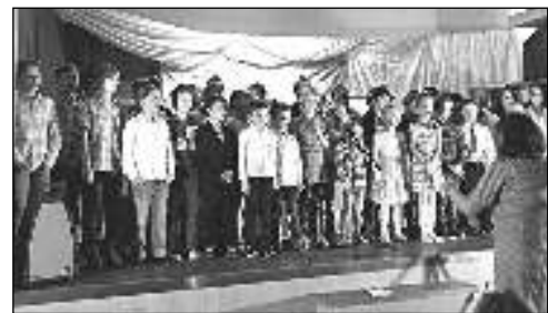
AKADEMIE. Vystoupení dětí na slavnostní akademii ke 180. výročí založení školy.