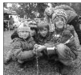
Děti na hasičských oslavách v Osově.