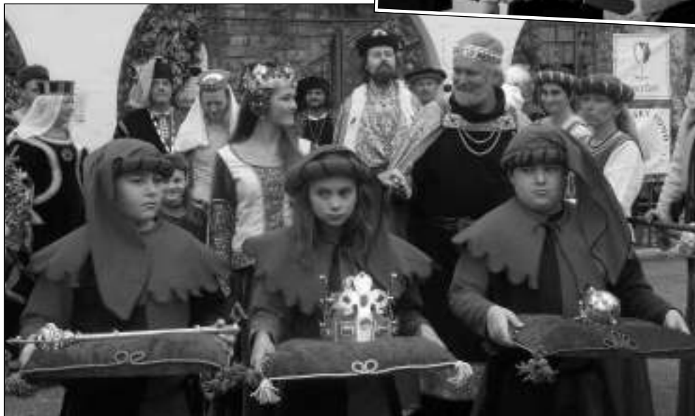
UŽ JDOU. Jedenadvacáté »novodobé« Karlštejnské vinobraní se konalo poslední zářijovou sobotou a první říjnovou nedělí. Ani tentokrát nechyběl Karel IV. chotí a doprovodem. (Viz strana 7)