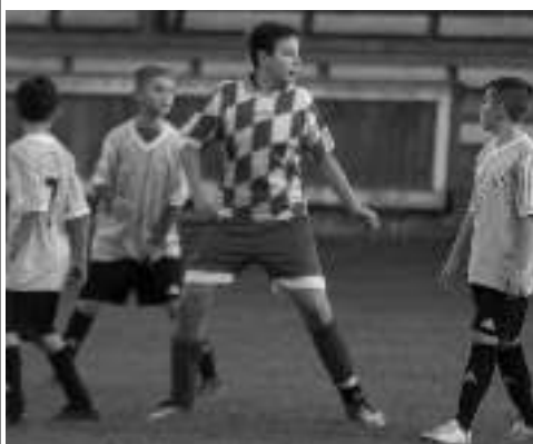
O HLAVU. V Tlustici proti všeradičtým jedenáctiletým nastoupili až čtrnáctiletí, o hlavu větší kluci. Po poločase se zápas opakoval.

Do podzimní části mistrovské soutěže přihlásil fotbalový oddíl FK Všeradice 1932 hned tři družstva: mladší žáky a dvě starší přípravky. Chceme, aby kluci hráli co nejvíce, i když nastupují proti starším soupeřům. Věkový rozdíl činí v zápasech obou kategorií až tři roky, ale i tato zkušenost, věříme, může kluky posunout dál.