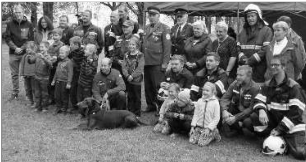
OSLAVENCI. Malí i velcí osovští hasiči, kteří oslavili 115. výročí založení svého sboru.

V neděli 10. září přijel do Osova cirkus JUNG. Svůj stan postavil na zahradě staré školy; vzhledem k omezené ploše to nebylo klasické šapitó, jen takové – dalo by se říci – kapesní vydání cirkusového přístřeší. Program byl určen pro nejmenší děti – předvedli se jim artisty, klauni a samozřejmě nemohla chybět ani zvířátka, zde zastoupená pejsky a fretkou. K velké radosti dětí tu stál i stánek s laskominami a hračkami, což bylo od aktréů velmi prozřavé, protože které dítě by nechtělo třeba svítící meč. Malí návštěvníci se vydovářeli na školní zahradě ještě po skončení hodinového programu, takže závěrem nelze než poděkovat obecnímu úřadu, který akci hradil, za umožnění nápadité zábavy pro naše malé a tím pádem i pro jejich doprovod. Marie PLECITÁ, Osov