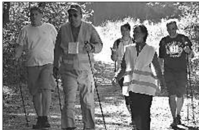
NA TRASE. Účastníci benefičního závodu s nordic walkingovými holemi, který se konal v Řevnicích.

na 6 kilometrů pro vidomé i nevidomé závodníky. Okruh vedl podhůřím brdských lesů s převýšením 205 m.