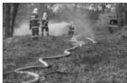
ZÁSAH. Hasiči při cvičení v zadnotřebaňském lese.

O tři dny dříve, v úterý 3. 10. se zadnotřebaňští