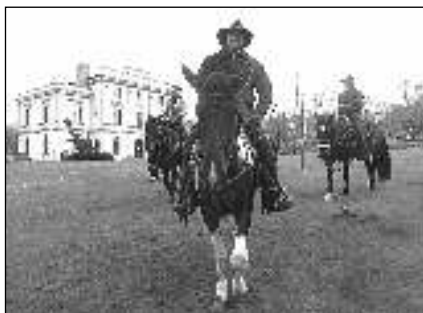
K URNĚ ZE SEDLA. Z Davle do Stradonic se vydala 20. října čtveřice koňáků. Cestou si odskočili odvolit v Řevnicích.

V Černošicích se dokonce celorepublikový vítěz voleb ocitl až na 4. místě! Prvenství zde slavila TOP 09, následována ODS a Piráty. Pomyslný zlom nastává v Řevnicích, kde už ANO opanovalo 1. příčku, stejně jako v dalších obcích dál na západ od Prahy. Nejlepší výsledek zaznamenalo ANO v našem kraji ve Vinařicích, kde pro něj hlasovalo 43,1 % voličů. V několika obcích naopak ANO zažilo propad oproti minulým parlamentním volbám. Voličů mu ubylo v Karlíku, Letech, Svinařích, Podbrdech a Všeradicích. Ve většině obcí si polepšila ODS. Dobře si vedli Piráti, nejlepšího výsledku dosáhli u Berounky v Letech - 17,21, na Brdech ve Svinařích - 19,08 %. Starostové ve všech obcích kolem Berounky přesáhli hranici 5 %, největší oporu měli v Srbsku 9,25 %. Prudký pokles hlasů zaznamenali v našem kraji TOP 09, ČSSD a komunisté. TOP 09 si