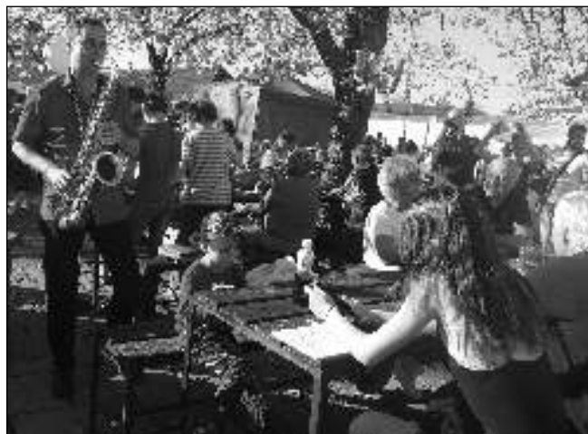
MEZI LIDMI. Členové dechovky Lovesong Orchestra hráli, zpívali i tančili přímo mezi návštěvníky.

24. 10., 28. 10. a 3. 11. 20.00 (Út 17.30) BAJKĚŘI 24. 10. a 26. 10. 20.00 (Čt 17.30) RAHAEL: LORD UMĚNÍ (Út 3D) 25. 10. 17.30 NOČNÍ ŽIVOT 25. 10. 20.00 ČTVEREC 26. a 28. 10. 17.30 THOR: RAGNAROK 27. 10. 17.30 ESA Z PRALESA 27. 10. 20.00 MATKA 28. 10. 15.30 HURVÍNEK A KOUZELNÉ MUZEUM 31. 10., 4. 11. a 8. 11. 17.30 EARTH: DEN NA ZÁZRAČNÉ PLANETĚ 31. 10. 20.00 NAVŽDY 1. 11. a 8. 11. 17.30 (8. 11. 20.00) ABSENCE BLÍZKOSTI 1. 11. 20.00 ČÁRA 2. 11. 17.30 CAMINO NA KOLEČKÁCH 2. 11. 20.00 ZABITÍ POSVÁTNEHO JELENA 3.-4. 11. 17.30 (So 15.30) PŘÍŠERÁKOVI