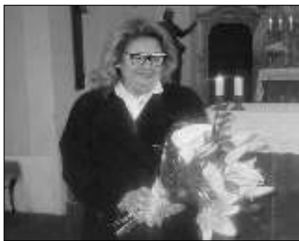
V LITNI. Gabriela Beňačková po vystoupení v liteňském kostele.