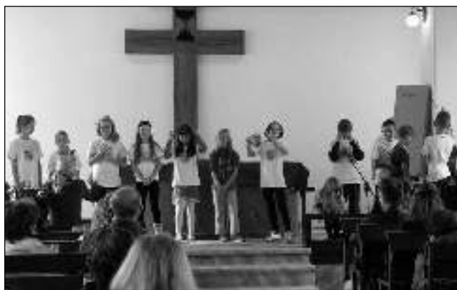
HRA POD KŘÍŽEM. Světlušky při vystoupení ve Tmani.