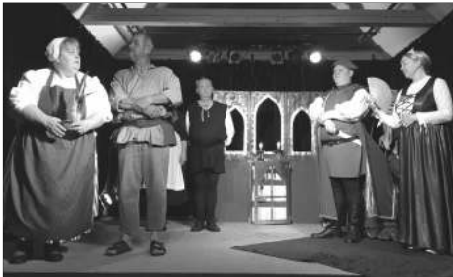
POSVÍCENÍ V HUDLICÍCH. Krajané z chorvatské obce Dolany sehráli ve všeradickém Zámeckém dvoře známý kus z doby národního obrození Posvícení v Hudlicích.