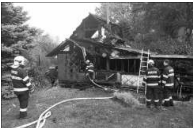
SHOŘELA. Liteňští hasiči po zásahu u chaty v Hatích.

LITEŇŠTÍ HASIČI V UPLYNULÝCH DNECH VYJÍZDĚLI K POŽÁRŮM I TECHNICKÝM ZÁSAHŮM