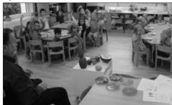
OCHUTNÁVKA. Děti v zadnotřeboňské školce při ochutnávání exotického ovoce.

Tím ale zábava v naší školce rozhodně nekončí. V úterý 3. 10. za námi přijelo divadlo s představením Ententyky. Dále jsme ochutnávali exotické ovoce, které nám sponzorsky poskytl pan Radabolský. Moc mu děkujeme. Nejvíce nás zaujalo Dračí ovoce (Pithaya) a Želví kůže (meloun Piel de sapo).