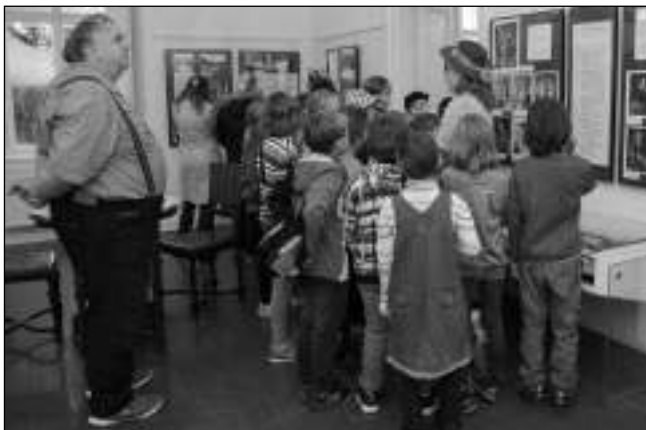
STYLOVÍ PRŮVODCI. Návštěvníky výstavy provázeli žáci deváté třídy v dobovém oblečení.