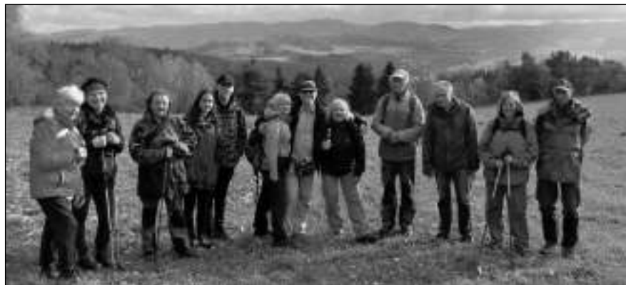
NA TRASE. Část zadnotřebaňské výpravy při putování Šumavou.

jeme se do půlnoci,“ popsala Zavadilová. V neděli se část výpravy vrátila domů auty, část autobusem ze Stach. Čtverice, která se vydala na vlak do Bohumilic, si nakonec musela přivolat taxíka. Vichřice a popadané stromy zastavily na trati z Vimperka provoz... Miloslav FRÝDL