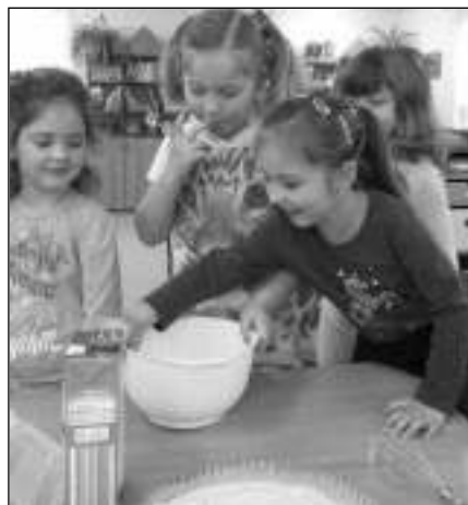
MALÉ KUCHARKY. Děti u karlštejnské školky při vaření a pečení.