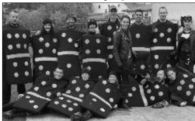
CAMPEROS. Slowpitchové družstvo složené z manželských párů ze Svinář, Tmaně, Trubína a Prahy ve »vítězských« kostýmech.

Rozloučení s naší první sezonou jsme dokonali minulý víkend v Hlu-