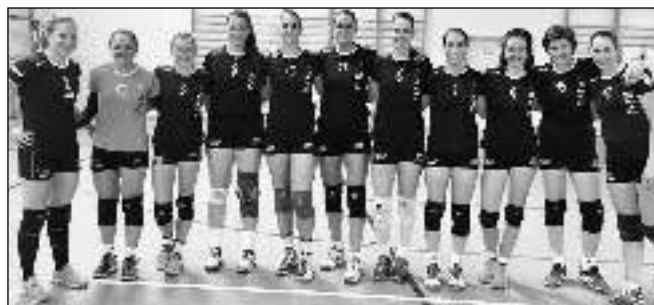
VYHRÁLY. Dobřichovičtí volejbalistky po vítězství nad Španielkou v závěru října. Foto A. VAŠUTOVA

Po výletu na Moravu čekala dobřichovičtí volejbalisty série čtyř domácích utkání. Hned první zápas s Nymburkem přinesl porážku. Přestože se jednalo o prohru v tie-breaku, byla to prohra zbytečná - domácí byli lepším celkem a jen zbytečnými chybami se připravili o vítězství. Druhý den už ale nenechali nic náhodě a po velmi kvalitním výkonu porazili tým ČZU Praha 3:0. Poslední hrací víkend byl soubojem