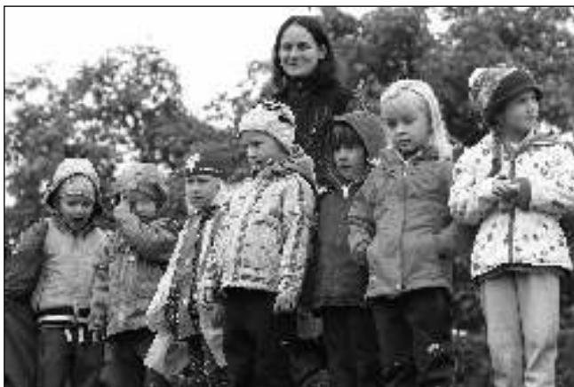
NA CVIČÁKU. Děti z mateřských škol při ukázkě výcviku psů na cvičáku letovských kynologů.

Utekl jen čtrnáct dnů a čekal nás 10. ročník Podzimního obranářského