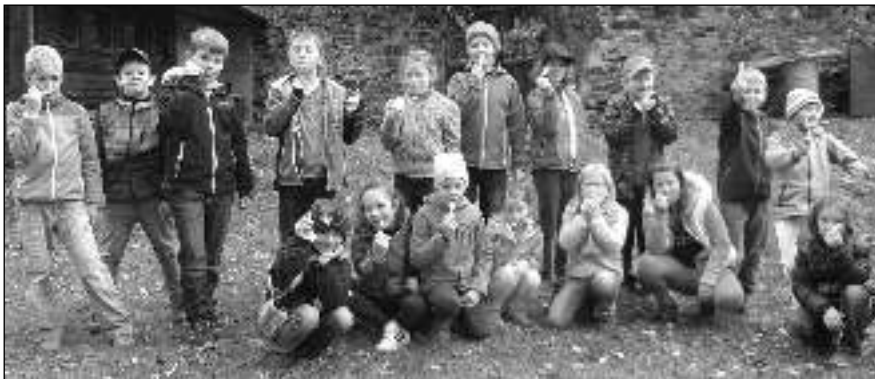
VE MLÝNĚ. Osovští školáci při exkurzi do mlýna Janov u Lochovic.

OSOVSKÉ DĚTI SI PROHLÉDLY HISTORICKÉ STROJE, ELEKTRÁRNU I EXPOZICI KELTSKÉ KULTURY