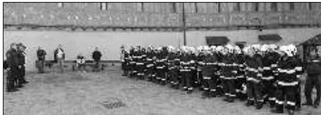
NA NÁDVOŘI. Účastníci hasičského cvičení na hradě.