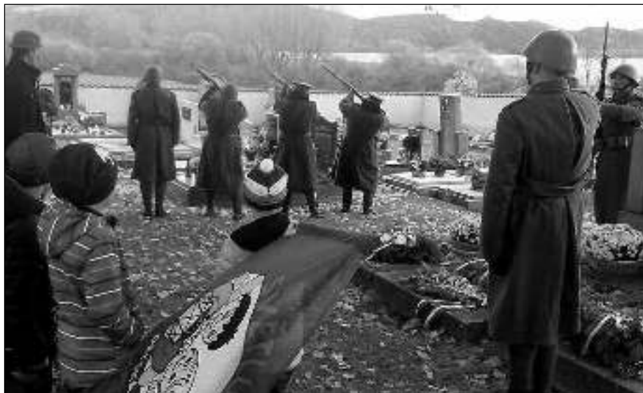
VOJÁCI NA HŘBITOVĚ. O čestnou salvu se na tmaňském hřbitově 28. října postarala jednotka Praporu SOS Falknov nad Ohří.