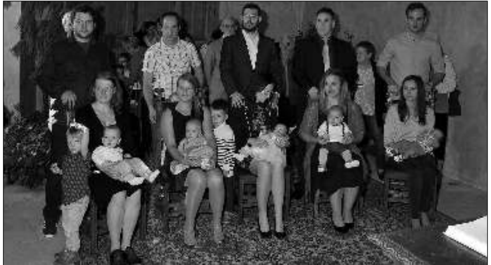
VÍTÁNÍ NA HRADĚ. Slavnostní přivítání pěti dětí do života a mezi karlštejnské občany se konalo 21. října v obřadní síni hradu Karlštejna.