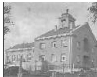
Sbor v Tmani, který byl nyní vyhlášen kulturní památkou, na snímku z roku 1926.

* Hojně navštíven byl Lampionový průvod, který se konal 27. 10. v Tmani. Hasiči v předvečer státního svátku položili věnce s trikolórou u pomníků válečných hrdinů. (jak)