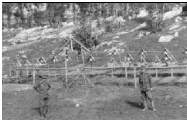
VOJENSKÝ HRBITOV. Dobová fotografie hřbitova u slovinské vesničky Humarje, kde se odehrávaly boje 11. bitvy na řece Soča.