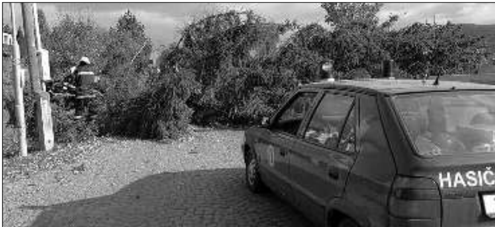
NIKOHO NEZRANIL. Strom, který spadl na ulici 5. května v Dobřichovicích.

„Naštěstí snad moc dalších škod nebylo, alespoň tedy ne na obecním