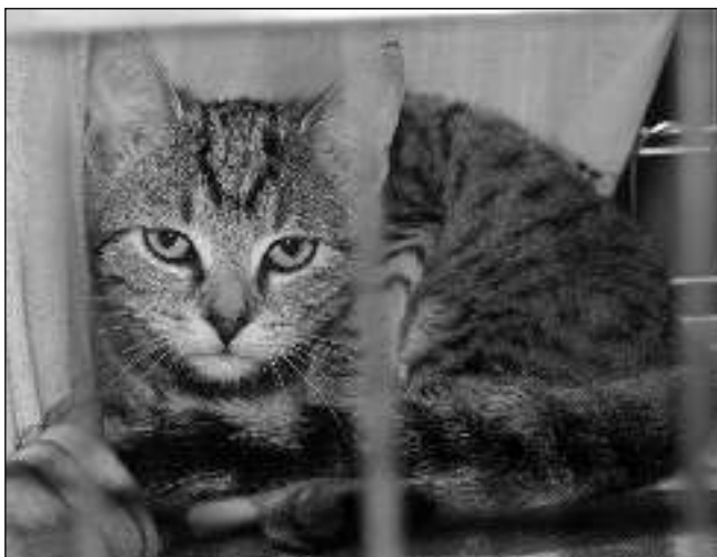
VEZMOU SI MĚ? Jedna z koček, která byla k mání na podzimní umístovací výstavě v Karlštejně.