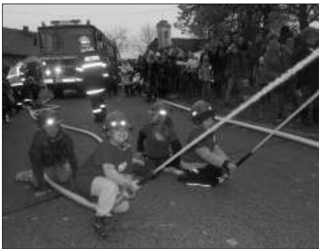
NA POSVÍCENÍ. Malí hasiči na letovské návsi předvedli požární útok a nechyběla ani populární soutěž v pojídání posvícenských koláčů.

I tentokrát byla na návsi spousta stánků se sladkostmi i dobrým pitím. Kdo chtěl, mohl koupit svetry, čepice nebo rukavice, nechyběly ani praže-