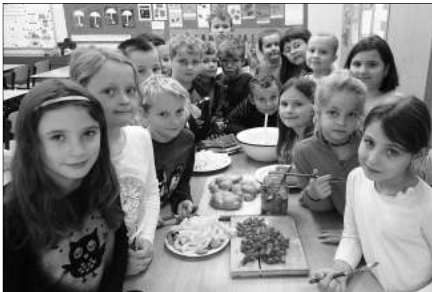
ZDRAVĚ A CHUTNĚ. Zdravou svačinu si z regionálních potravin sami připravili liteňští školáci. (Viz strana 8)

Aktuální zprávy z Litně, Leče, Bělče, Vlenců a okolí 12/2017 (75)