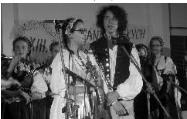
V PRAZE. V pátek 10. listopadu se Notičky zúčastnily setkání dětských lidových muzik v pražských Letňanech.