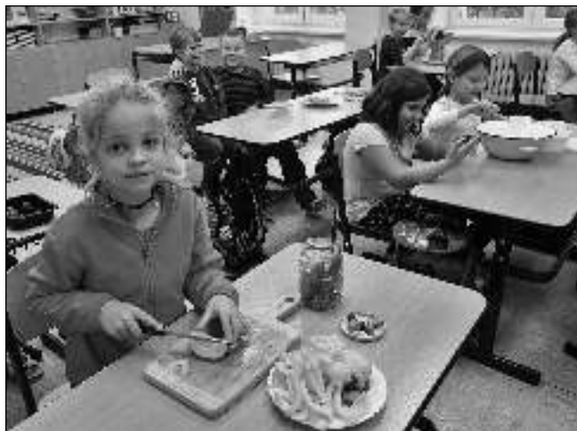
TO BUDE DOBROTA. Liteňští druháci při přípravě svačiny z regionálních potravin.