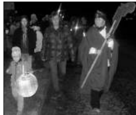
V PRŮVODU. Účastníci svatomartinského průvodu v Hlásné Třebani.