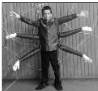
Pavouk Strach z představení Světlušek.

* Adventní koncert Stella Splendens, jehož náplní bude středověká hudba s adventní a mariánskou tematikou, se koná 3. 12. od 16.00 v kostele v Osově. Vystoupí soubor Societas Musicalis pod vedením Aleny Maršíkové. (map)