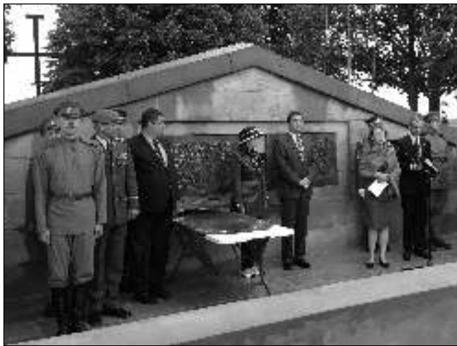
TADY TO BYLO. Na počest stého výročí bitvy u Zborova se letos v červenci konala pietní akce u mohly postavené na počest čs. legií v místech bojů, u ukrajinské obce Kalynivka. Foto Stanislav SABOL

Je mi velice smutno, že je stále omílána historická událost pro nás tak významná, a to s jasným úmyslem její význam potlačit či snížit. Tento úmysl trčí z řady prohlášení či rádo-by badatelských rozborů Josefa Kozáka, které se objevují v NN. Snižovat význam bitvy u Zborova není bourání legend, ale jasná snaha vymazávat z paměti národa to, o co se ve svých dějinách opíral, totiž hrdinské činy statečných jednotlivců či skupin. Mluvíme-li o I. světové válce a směřujeme-li často osobní statečné jednání jednotlivých Čechů v rakouských uniformách s dobrovolným rozhodnutím těch, kteří vsoustoupili ze zajetí znovu do války s cílem zúčastnit se zápasu o získání svobody pro svůj národ, dopouštíme se hrubého omylu, nebo tak činíme zcela vědomě a stavíme se tak vlastně do řad nepřátel. Zde už hraje hlavní roli naše národní cítění, a tam se nedá nikomu nic vysvětlovat. Jedni poctivě poslouchali císaře pána, který jim dal ve své lásce možnost přijít o nohu, ruku či zrak, druzí se vzepřeli a nastoupili zápas o národní svobodu. A tady jsme u toho. Jsme u bitvy u Zborova.