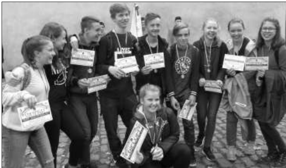
PRAŽSKÝ TRIUMF. Vítězné družstvo liteňských devěťáků.