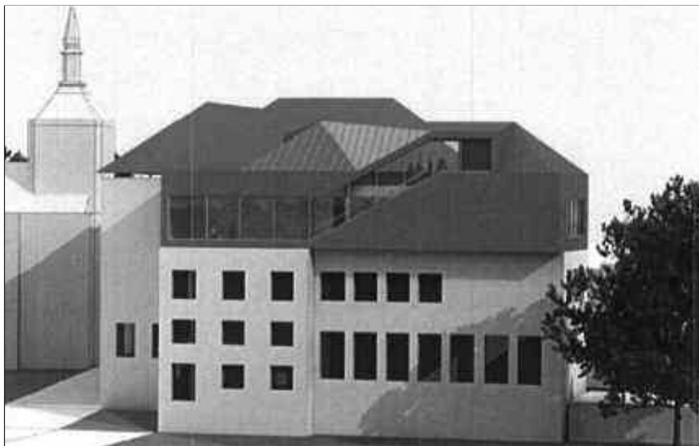
NOVÁ ŠKOLA? Vizualizace přístavby školy z pohledu od hřbitova.