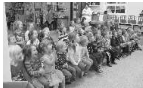
DOBŘE SE BAVILY. Zadnotřebeňbaňské děti při sledování divadelního pořadu.