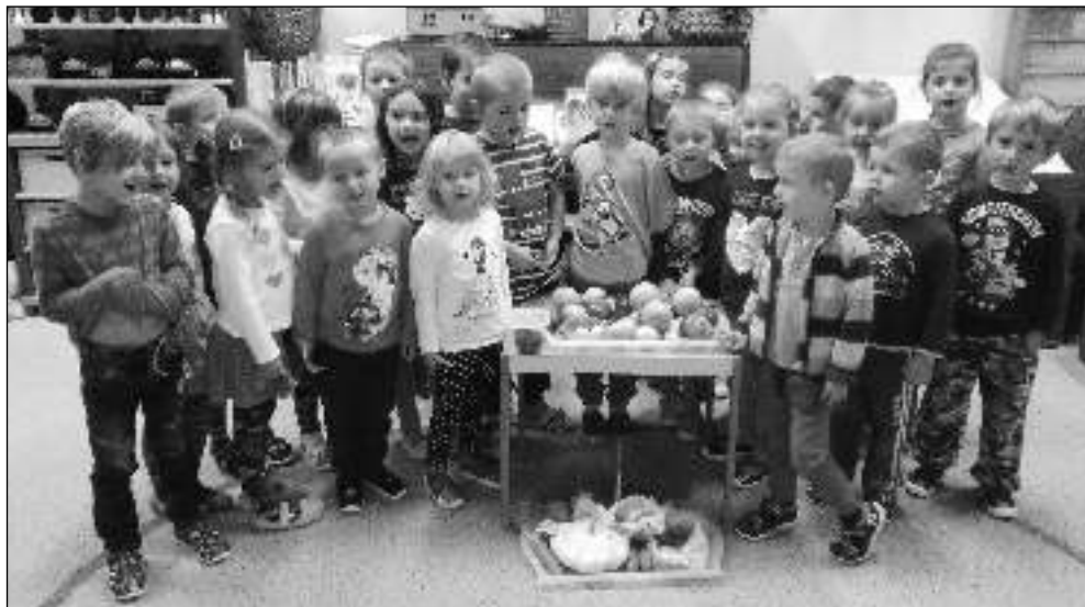
PODZIMNÍ DOBROTÝ. Děti ze všeradické školky s podzimními »dary«.