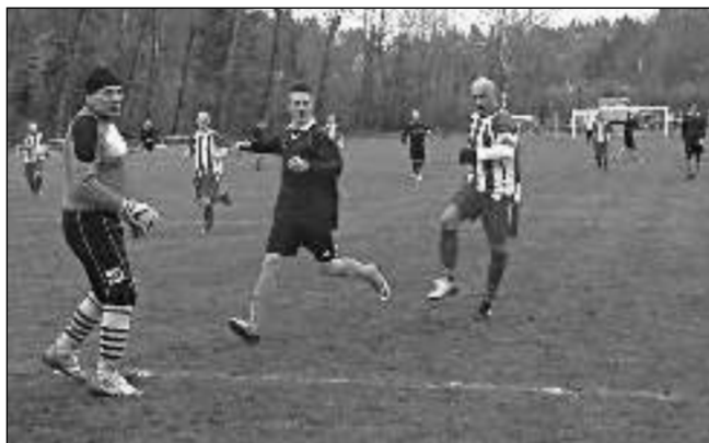
ROZLOUČILI SE VÝHROU. V posledním podzimním mistrovství porazili fotbalisté třebaňského Ostrovana doma Liteň 4:1.

vý stav 0:2 byl ještě hodně milosrdný. Po přestávce se domácí vzchopili a zatlačili soupeře na jeho polovinu. Vypracovali si i několik šancí, ale nedokázali je proměnit, naopak hosté v samém závěru z protitoku do otevřené obrany skórovali potěšit. Dobřichovice přišly o domácí neporazitelnost a klesly na třetí místo v tabulce. Miloslav OMÁČKA