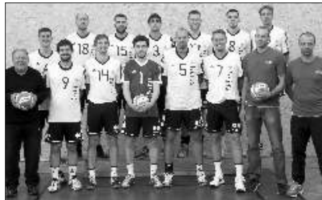
Prvoligové družstvo dobřichovických volejbalistů.