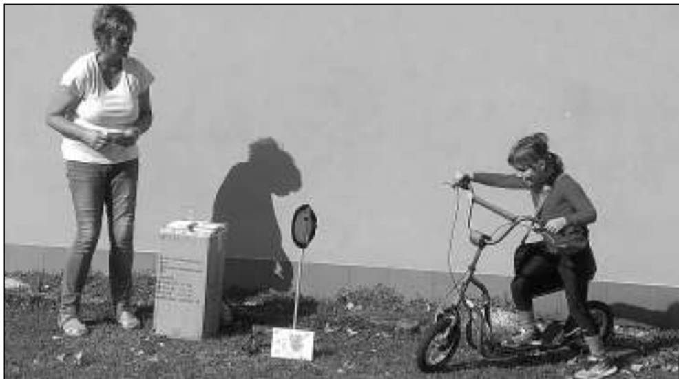
POŠTOVNÍ PANENKA. Děti na posvicenském odpoledni plnily úkoly a hádaly písničky.