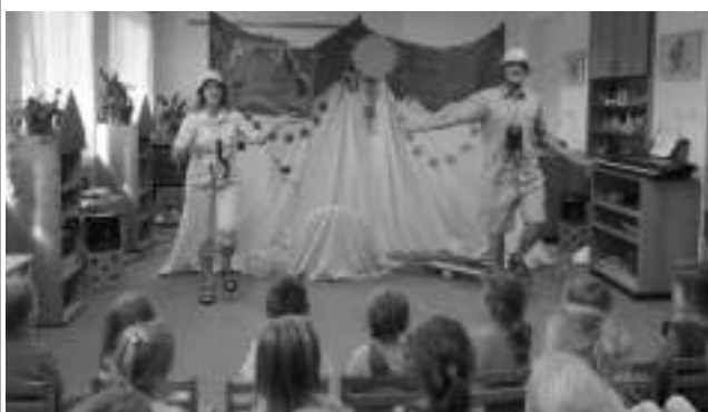
Po letních prázdninách se děti v Mateřské škole Karlštejn mohou těšit na představení divadla Letadlo. Svou první hru nám nabídlo hned v září. Velice pěkně zpracované vyprávění dvou cestovatelů, kteří se pustili do putování po vzdáleném kontinentu. Co vše v Austrálii prožili a viděli, se děti dozvěděly z představení s názvem Průzkumníci po Austrálii. Západočeský divadelní soubor Letadlo nás během školního roku navštíví ještě čtyřikrát, a to s představením Roční období. Myslím, že se děti mají na co těšit.

Text a foto Marcela HAŠLEROVÁ, MŠ Karlštejn