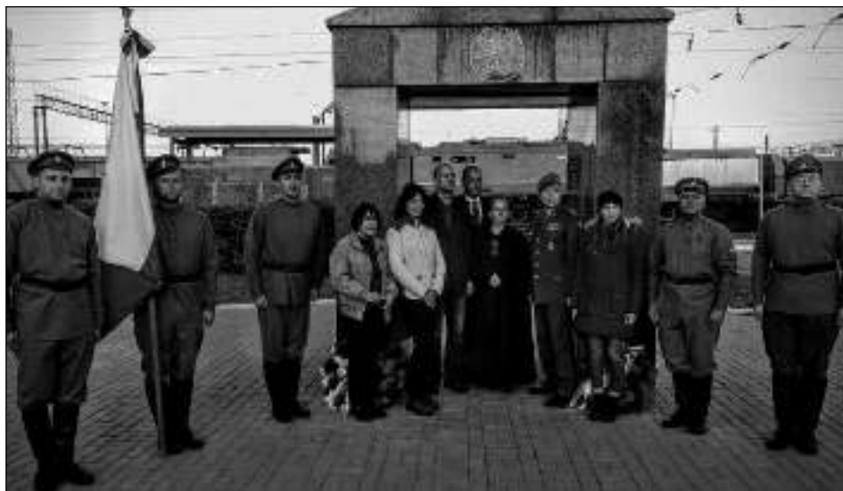
POMNÍK NA NÁDRAŽÍ. Říjnová výprava navštívila místa spojená s boji legionářů v ruském městě Penza a na nádraží uctila památku padlých bratrů u pomníku, který zde byl odhalen před třemi lety.