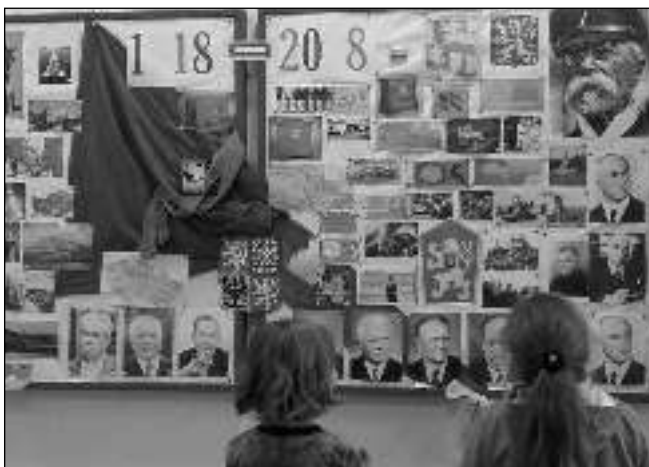
U NÁSTĚNKY. Sté výročí založení Československa dětem v karlštejské základní škole připomínají tematické nástěnky.