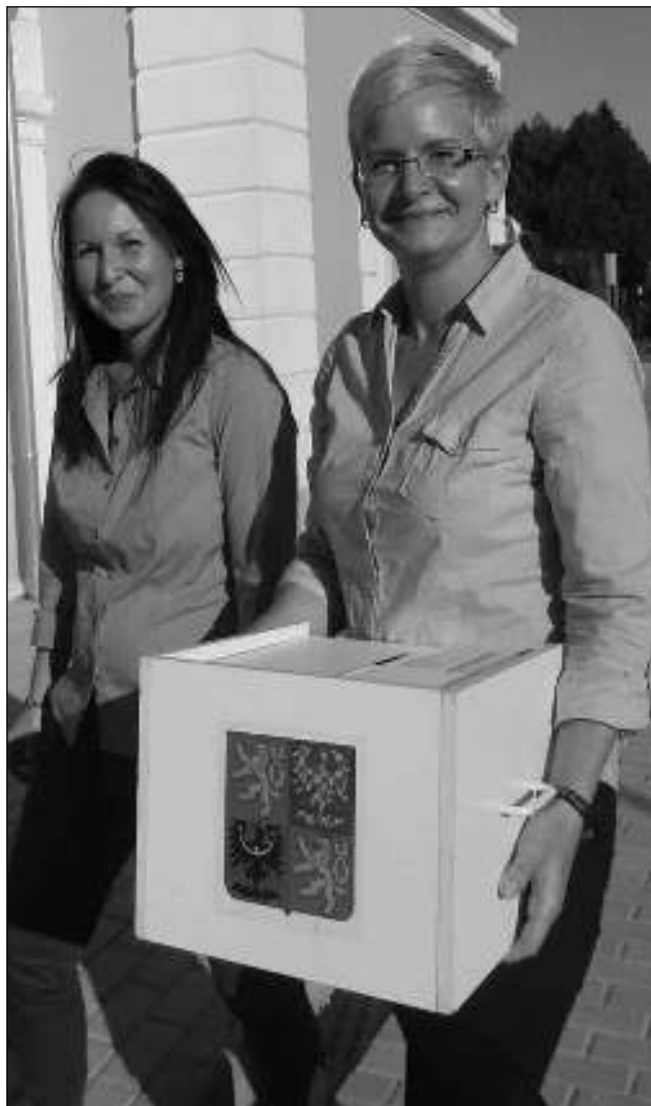
AŽ DO DOMU. Za některými obyvateli městyse vyrazily členky volební komise s volební urnou domů.

Nevím, zda je jednání v plném proudu, pravda ale je, že nás ODS po volbách oslovila. Netuším ovšem, zda se kontaktovaly ostatní subjekty mezi sebou. Na příští týden, pravděpodobně na 19. 10., kdy už budeme vědět od krajského soudu, že se nikdo proti výsledku voleb neodvolal, svolám pracovní poradou zvolených zastupitelů. (Dokončení na straně 8)