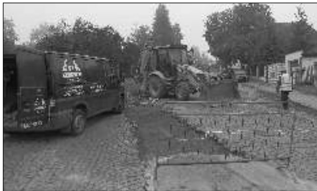
TUDY NE! Výstavba dešťové kanalizace v ulicích Komenského a Třebeňská znemožní až do 30. 11. přímé silniční spojení Řevnic se Zadní Třebani. Oficiální objížďka vede přes Svinaře, ti odváznější si cestu zkracují po poli přes kopec Vrážka.