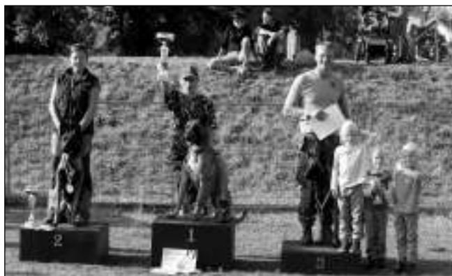
NA BEDNĚ. Vítězové jedné z disciplin podzimního kynologického závodu v Letech.

Další kategorií byl samostatný útok figuranta na psa nazývaný kontrolní zadržení (neboli kontrolák), v délce