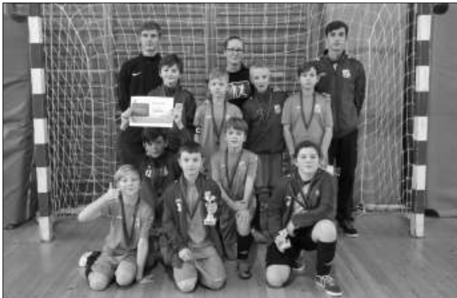
V BEROUNĚ. Fotbalová starší příprava Všeradice na turnaji v Berouně.