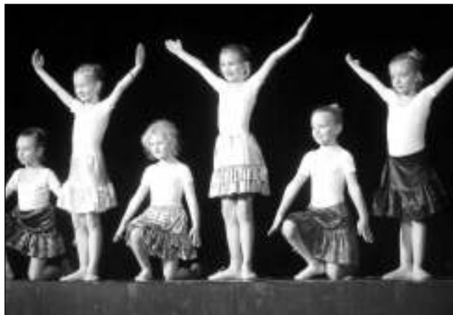
TANEČNÍCI V KINĚ. Pololetní veřejné vystoupení tanečního oddělení ZUŠ Řevnice se konalo 24. ledna v místním kině.

29. 1. 17.30 FAVORITKA 29. 1. 20.00 ODDĚLENÍ Q: SLOŽKA 64 30. 1. 17.30 KURSK 30. 1. 20.00 Kino naslepo 31. 1., 5. 2. a 9. 2. 17.30 ŽENY V BĚHU 31. 1. 20.00 ÚNIKOVÁ HRA 1. 2. 17.30 RAUBÍŘ RALF A INTERNET 1. 2. a 13. 2. 20.00 (St 17.30) BOHEMIAN RHAPSODY 2. 2. 15.30 ASTERIX A TAJEMSTVÍ KOUZELNÉHO LEKTVARU 2. 2. 17.30 CENA ZA ŠTĚSTÍ 2. 2. 20.00 TICHŮ PŘED BOUŘÍ 5. 2. 20.00 JO NESBO: SNĚHUŠKA 6. 2. 17.30 NARUŠITEL 6. 2. 20.00 ZRODILA SE HVĚZDA 7. 2. a 13. 2. 17.30 (St 20.00) MARIE, KRÁLOVNA SKOTSKÁ 7. 2. 20.00 METALLICA - FRANCIE NA JEDNU NOC 8. 2. 17.30 SNĚHOVÁ KRÁLOVNA V ZEMI ZRCADEL 3D 8. 2. 20.00 ONI A SILVIO 9. 2. 16.00 PAT A MAT: ZIMNÍ RADOVÁNKY 9. 2. 20.00 BEATIFUL BOY