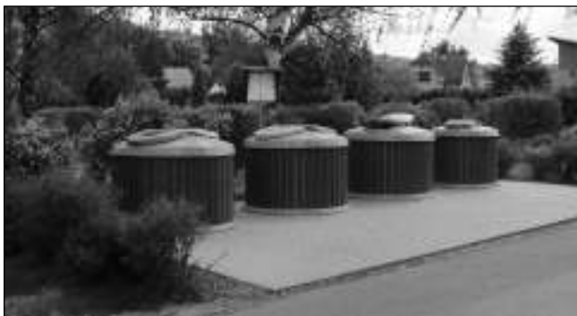
Polopodzemní kontejnery v Letech.

Do konce roku 2017 se více než 2/3 občanů dobrovolně přihlásilo ke 14dennímu nebo měsíčnímu svozu odpadu. Stejně jako velké procento obcí hlavně na Moravě, kde už jim nejde jen o to, aby co nejvíce třídili, ale aby měli co nejméně odpadu vůbec, rozhodli jsme se po jejich vzoru svázat směsný odpad jednou za 14 dní a jednou za měsíc v celé obci. Obec Lety se každoročně umísťuje