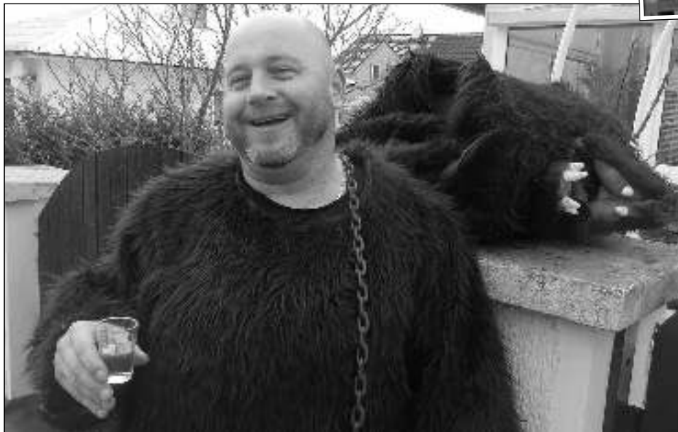
ZAČAL MASOPUST. Jako jedni z prvních v našem kraji oslavili masopust Svinářští. (Viz str. 2)