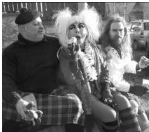
NA MASOPUSTU. Mimoni na masopustu ve Svinařích a maškary, které se bavily na masopustu v Srbsku.