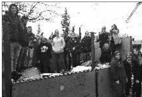
V KONTEJNERU. Žáci deváté třídy při naplňování kontejneru papírem.

budeme nosit do školy sběrový papír, ale tentokrát bychom chtěli vyzvat i veřejnost. Budeme rádi, zapojí-li se co nejvíce lidí. Hana HAVELKOVÁ, ZŠ Liteň