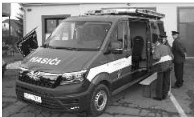
NOVÝ VŮZ. Nový dopravní automobil liteňských hasičů si 19. ledna mohla prohlédnout i veřejnost.

* Pokud uvidíte v obci psa, který je opuštěný, bez majitele ohrožuje provoz nebo je agresivní a mohl by někoho napadnout, oznamte to v pracovní době na OU, popř. telefonicky na 311 684 121 či 775 180 257. V neodkladných případech, mimo pracovní dobu a v případech akutních na tísňové linky 158 či 112. (mar)