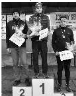
Vítězové hlavní kategorie závodu.