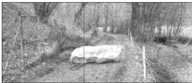
Kámen na cestě do Vatin z bělečské strany, foto z roku 2010.