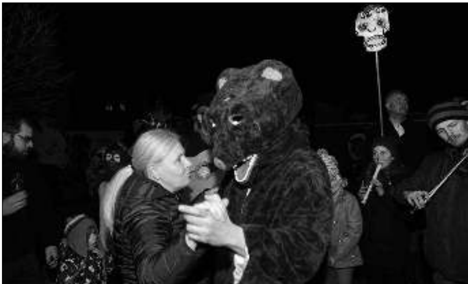
HOSPODYNĚ V KOLE. Tanec s medvědem na čtvrtém Liteňském masopustu.

Masopust představuje období hodování a veselí před postní dobou. Tohle tvrzení už platí samozřejmě s výhradami. Nové stereotypy, které nám dnes určují rytmus života, jsou už jiné. (Dokončení na straně 8) (kat)