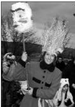
V PRŮVODU. Účastnice Liteňského masopustu.

My, v Liteňském pupíku, se chceme alespoň někdy, a třeba jen symbolicky vracet k tomu, co nám předali předci, co přináší život spojený s naší krajinou, přírodou, klimatem a změnami ročních období. Dlouhodobě se snažíme prosazovat jiný pohled na kulturní dění v obci, pořádání akcí a udílení příspěvků na kulturu. Znovu vysvětlujeme naše stanoviska i pohled na věc a stále se názory Liteňáků vracejí na začátek, kde jsme začali debatovat někdy před třemi, čtyřmi lety. Usilujeme o to, aby vedle pořádání několika velkých kulturních akcí podporovaných obcí existovala možnost nechat každé sdružení, spolek, obyvatele v jakémkoliv společenství organizovat s podporou obce akce menší, které budou pro zúčastněné smysluplné. Jen tak je možné aktivně zapojovat větší a větší část obyvatel obce v co nej-