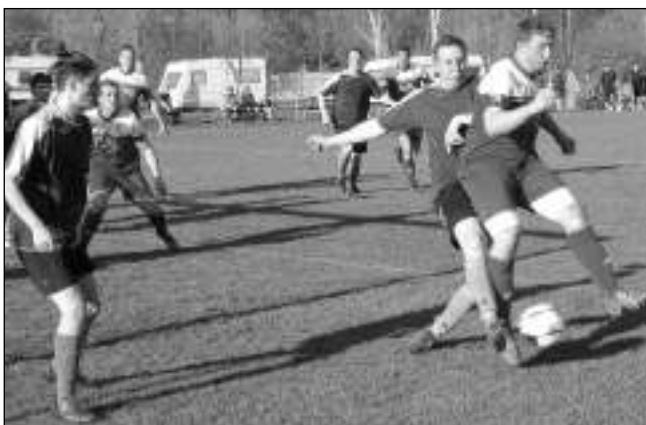
DERBY. V prvním jarním mistráku si zadnotřebský Ostrovan na svém hřišti poradil s mužstvem Všeradic 4:2.