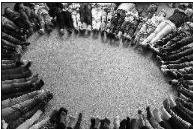
KAŽDÁ JINÁ. Ve čtvrtek 21. 3. přišly zanotřebaňské děti do školy s každou ponožkou jinou, zapojily se do »ponožkové výzvy«.

Stejně jako každý rok jsme s Moranami vyrazili první jarní den na průvod obcí. Během cesty nás čekalo několik zastávek, během nichž jsme paní starostce, rodičům, prarodičům i kolemjdoucím předvedli krátké vystoupení, za něž nás čekala nejen slova chvály, ale též sladká odměna. Zimo, zimo, táhni pryč nebo na tě vezmu bič... touto, ale i spoustou dalších básní a písní, včetně tanečku, se loučily děti se zimou. Cíl cesty byl jasný - vhodit obě Morany z lav-