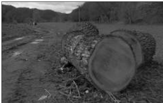
ČISTKA U ŘEKY. Někde už se do »jarního úklidu« dali. Ve velkém se kácení třeba u řeky mezi Karlštejnem a Srbskem.

* K benzínu výtěkářícímu z osobního auta vyjeli 13. 3. odpoledne řevničtí profesionální hasiči do Školní ulice v Zadní Třebani. Hasiči provizorně opravili porouchaný palivový systém vozu a ošetřili místo sorben- Pavel VINTERA