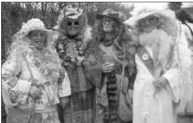
JARO, LÉTO, PODZIM, ZIMA. Účastnice masopustního průvodu v Hlásné Třebani.