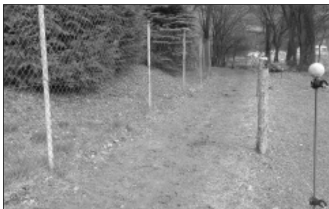
TUDY NE! Z Bělče se do Vatin autem projet nedá.

Po událostech na zasedání zastupitelstva 28. 2. (viz rozhovor...) nařídila policie ráno 1. 3. zátaras nechat na místě. Upozornili jsme je na možnost nedostupnosti oblasti pro složky IZS. Vzali to na vědomí a na jejich odpovědnost, pokud tam někdo z důvodu nedostupnosti lékařské péče zemře nebo shoří dům kvůli nedostupnosti pro hasiče. Martin Homola i jeho otec František byli ráno 1. 3.