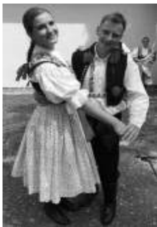
Z KUNOVIC. Tanečnický folklorního souboru Lintava.

Nejdřív »nováčci«. Až z Kunovic na moravském Slovácku na máje dorazí folklorní soubor Lintava. Vystupovali už v Portugalsku, Španělsku i Řecku, v červenci pojedou do Francie. A v sobotu 4. 5. je můžete vidět v Berouně. Slyšet taky - přivezou si cimbálouku. Z východočeských Slatiňan »přiletí« dětský soubor Sejkorky, premiéru u Berounky si