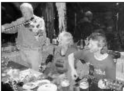
»Hraná« U Mlsné huby.