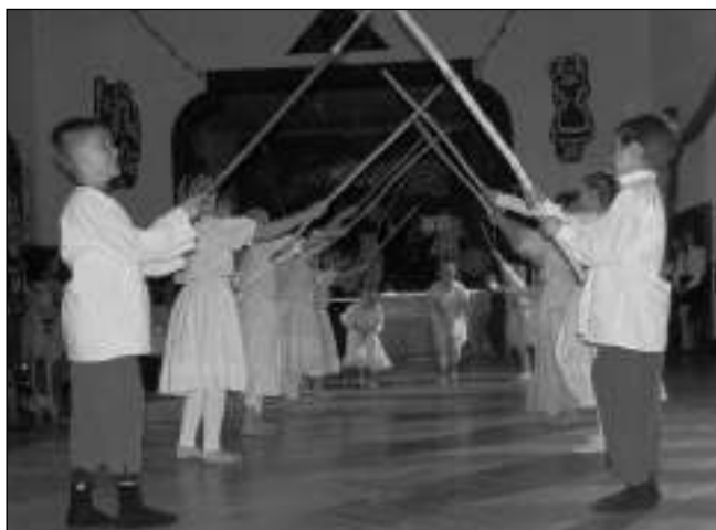
NA PLESE. Jedno z předtančení na plesu Klíček.

Klíček připravil pásmo několika tanců z prostředí Harryho Pottera a