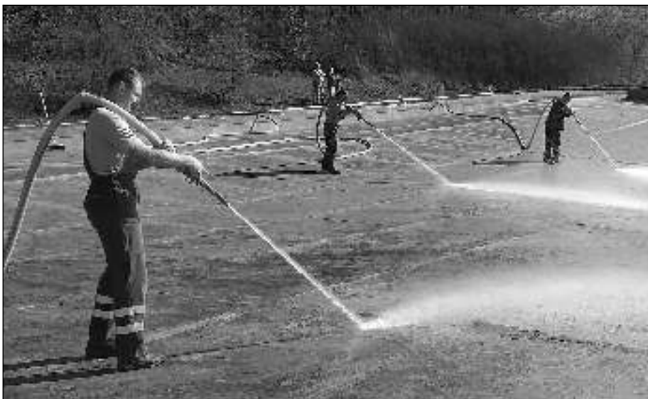
ČISTILI NÁDRŽ. Všeradičtí hasiči při čištění místního koupaliště.