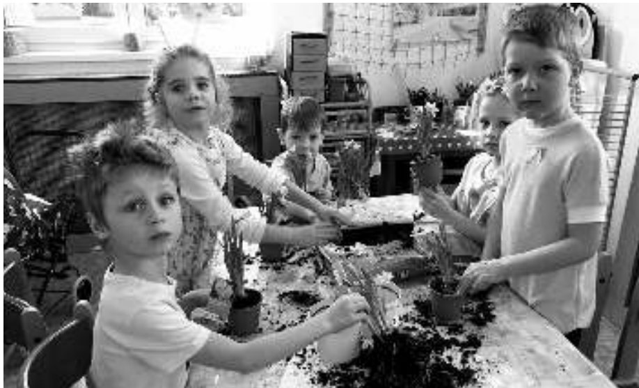
SÁZELI KYTKY. Děti z karlštejnské školky při sázení narcisek.