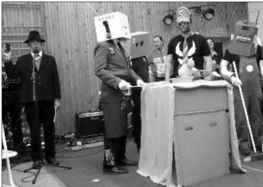
SPECIAL HOME ELECTRONIC. Osovští chlapi na Dnu osovských žen představili roboty uzpůsobené jakýmkoliv činností v domácnosti.

* Elektroodpad se v Osově vybírá každou neděli od 10 do 12.00 u hasičské zbrojnice. Jiné termíny po domluvě v čp. 47 (Chvojkovci). (map)