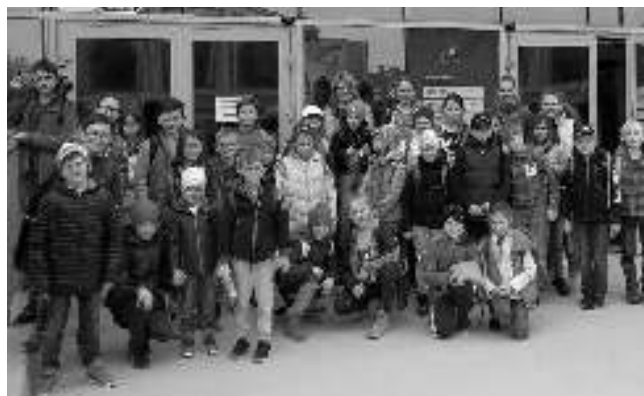
V PLZNI. Výprava dětí z Karlštejna a okolí před Techmania Science Center v Plzni.