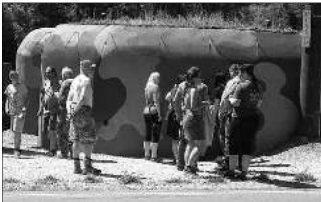
U BUNKRU. Zájemci o prohlídku Musea lehkého opevnění u centrálního parkoviště v Karlštejně.

V muzeu od jeho otevření přibýly mnohé exponáty, které dotvářejí jeho autenticitu - leckde i v detailech pro znalce, jako jsou třeba nýty na helmách. K lehkému kulometu byla například dodána originální lafeta (soustava pro uchycení a míření) namísto jednoduché, provizorní lafeta-