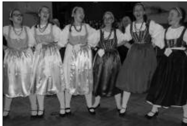
NA PLESE. Členky dětské lidové muziky Notičky »juchají« na hudebním plese v Řevnicích.

vrchní strážník, Městská policie Řevnice