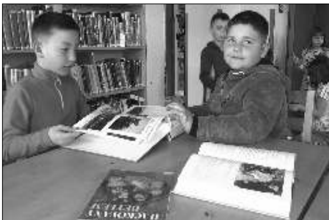
TÝDEN S KNIHOU. První dubnový týden byl pro zadnotřebaňské školáky ve znamení knihy ve všech možných podobách.