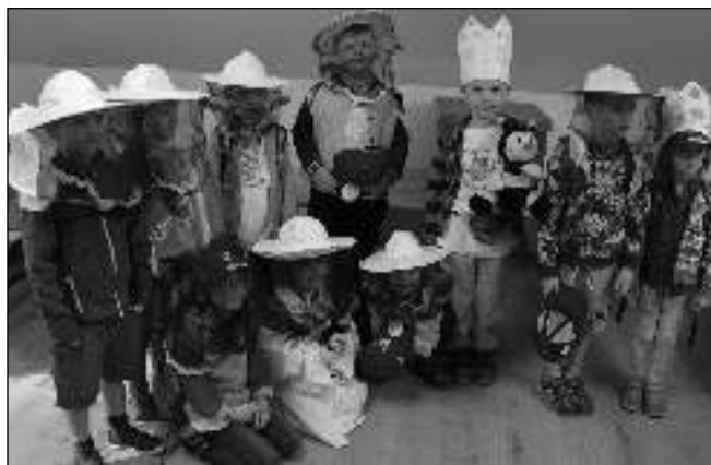
MALÍ VČELAŘI. Děti při Včelích hrátkách, které pro školy a školky připravuje karlštejnské Muzeum betlémů.

Novinkou jsou naše dva jarní vzdělávací programy pro školy a školky. První program pod názvem Včelí hrátky je zaměřený na poznávání života včel. Díky našemu prosklenému úlu mohou děti nahlédnout přímo do centra dění v úle, aniž by byly ohroženy včelím bodnutím. Děti pracují se včelařským nářadím, vyzkouší si