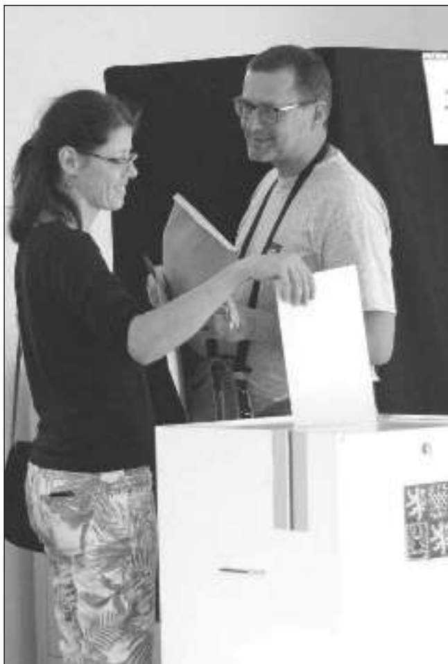
YVHRÁLA ODS. I v Letech byla volební účast nadprůměrná - 47,84 %. Nejvíce voličů dalo svůj hlas ODS.

Koalice STAN, TOP 09 22,41 % ODS 18,67 % ČPS (piráti) 18,67 % ANO 2011 14,24 % SPD - T. Okamura 5,73 %