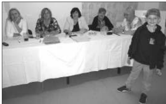
SAMĚ ŽENY. Volební komise v Zadní Třebani byla složená ze samých žen.