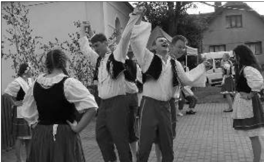
BESEDA. Všeradická chasa při podvečerním tančení besedy na Staročeských májích.