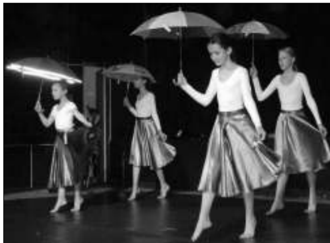
TANČILI V KINĚ. Závěrečné vystoupení tanečního oddělení ZUŠ Řevnice se konalo na konci května v místním kině.

4. 6. 17.30 DADDY COOL 4. 6. 20.00 TŘI BLÍZCI NEZNÁMÍ 5. 6. 17.30 PRADO - SBÍRKA PLNÁ DIVŮ 5. 6. 20.00 MOST NA KONCI SVĚTA 6. 6. a 15. 6. 17.30 (So 20.00) ŠPRTKY TO CHTĚJ TAKY 6. 6., 8. 6., 15. 6. 20.00 (So 17.30) X-MEN: DARK PHOENIX (8. 6. 3D) 7. 6. 17.30 TVMINIUNI A ZLODĚJ OTÁZEK 7. 6. 20.00 LÁSKA NA DRUHÝ POHLED 8. 6. 20.00 TŘI BLÍZCI NEZNÁMÍ 11. 6. 17.30 TERRORISTKA 11. 6. 20.00 POSLEDNÍ VEČERY NA ZEMI 3D 12. 6. 10.00 LOVENÍ 12. 6. 17.30 ZELENÁ KNIHA 12. 6. 20.00 ROCKETMAN 13. 6. a 19. 6. 17.30 MUŽI V ČERNÉM: GLOBÁLNÍ HROZBA 13. 6. 20.00 NEVIDITELNĚ 14. 6. 17.30 PŠÍ POSLÁNÍ 2 14. 6. 20.00 BOLEST A SLÁVA