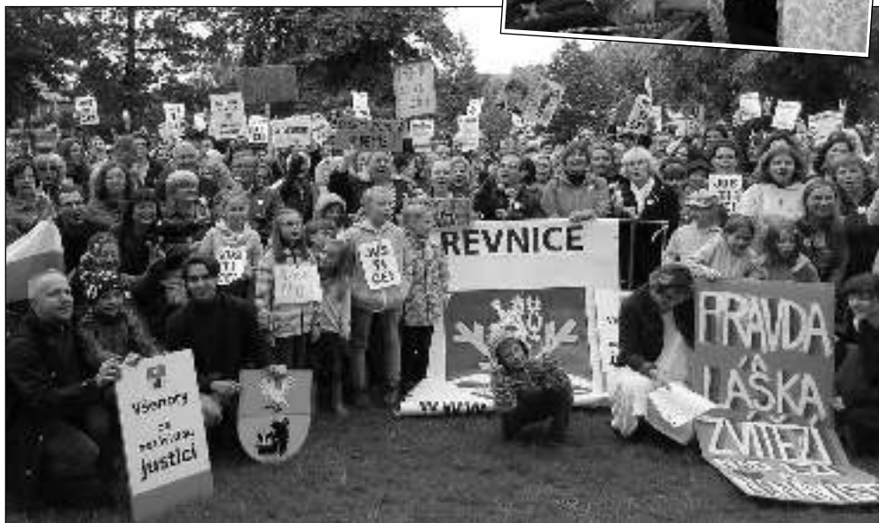
UŽ DOST! Shromáždění na podporu demokracie se koncem května konala na několika místech našeho kraje. V Řevnicích se sešly přibližně tři stovky lidí. (Viz strana 2)

O den později vyjžděli fevničtí záchranáři do Zadní Třebaně znovu. V zatáčce nad obcí směrem na Líteň »vyletěl« fevnický motorkář středního věku ze silnice a narazil do stromu. V tomto případě však už byli lékaři na místě zbyteční, stejně jako přivolaný vrtulník letecké záchrané služby. „Utrpěl zranění neslučitelná se životem, umřel na místě,“ řekl Bulíček. Podle Deníku neměl muž u sebe doklady a jeho motorka neměla registrační značky. (mif)