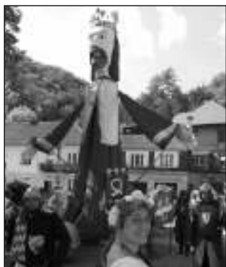
LOUTKA KAREL. Královský průvod v Karlštejně přivítala obří loutka Karla IV.

OBYVATELÉ KARLŠTEJNA BESEDOVALI O ZNEČIŠTĚNÉM OVZDUŠÍ