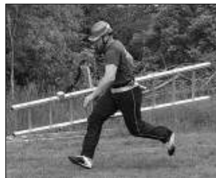
BĚH SE ŽEBŘÍKEM. Jeden ze všeradických hasičů na okresní soutěži v Chyňavě.