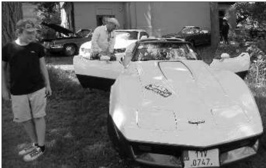
U KOSTELA. Vozy značky Chevrolet Corvette u kostela v Osově.