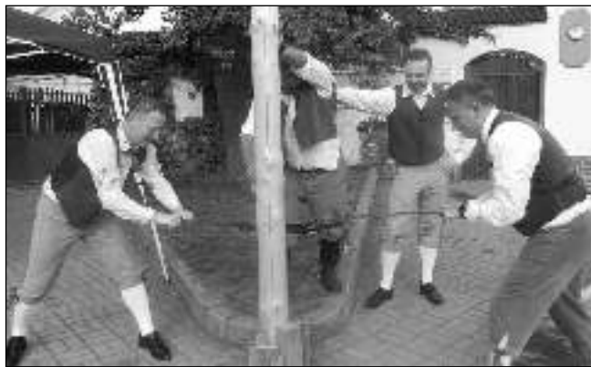
KAM PADNE? Hlásnotřebeňští chasníci při káčení nazdobeného smrku - symbolu staročeských májů i folklorního festivalu.

Také letos, jako obvykle, se folklorní festival Staročeské Máje konal i v Hlásné Třebani. Sešli jsme se 26. 5. po obědě na návsi u kapličky, abychom zhlédli velmi bohatý program. Vystoupila chodská dechovka Sedmihorka i dětské soubory Modřeneč z Prahy a Jarošáček z Mělníka. Poté s malým zpožděním přišel na návés průvod krojovaných účastníků. Hudba se linula do širokého okolí - paráda! Po ceremoniálu - žádání o právo vystoupila taneční skupina Proměny z Revnice, Sokol Hlásná Třeňbaň, Hlásné, hlásnotřebeňská chasa zatančila besedu a na řadu přišlo káčení májky. Škoda, že se letošní máje konaly ve dnech, kdy byly i volby. Polovina Holek v rozpuku seděla u voleb a tím pádem jsme nemohly nic nacvičit. Tak aspoň některé z nás po-