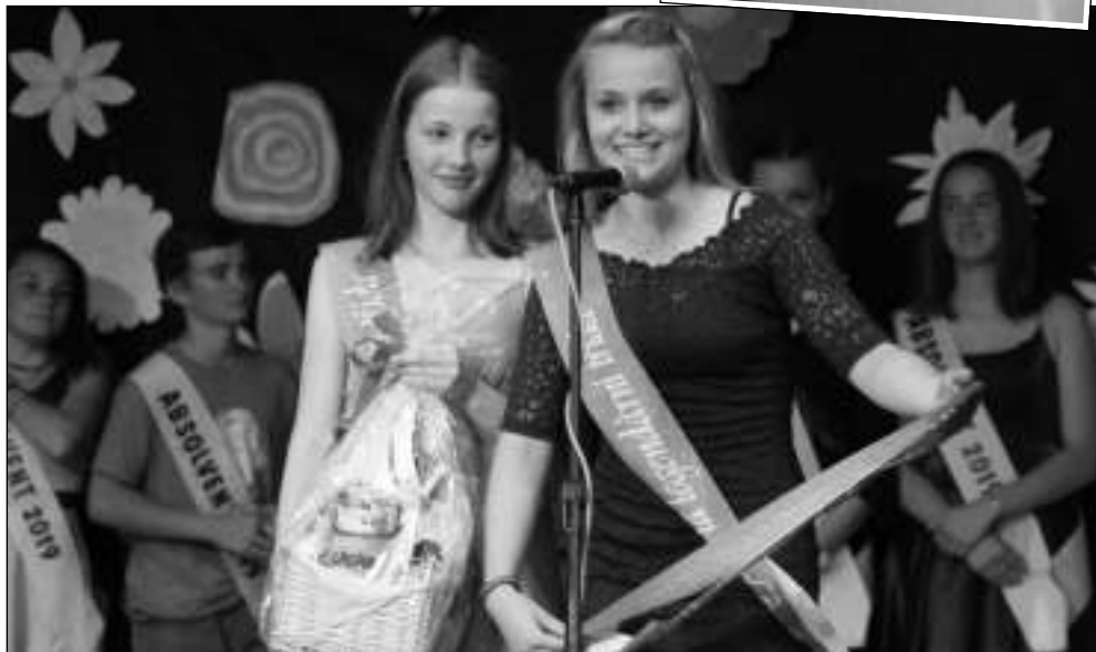
LOUČENÍ SE ŠKOLOU. Akademie, na které se se svojí školou rozloučili její letošní absolventi, se krátce před prázdninami konala v řevnickém Lesním divadle. (Viz strana 3) Foto Gabriela DĚDKOVÁ

Poberouní - Totální kolaps dopravy způsobilo 24. 6. zastavení provozu na hlavní trati mezi Prahou a Berounem. Kvůli poruše na trakčním vedení nejezdily vlaky od přibližně 5.00 do 7.00 vůbec, poté další asi dvě hodiny pouze po jedné koleji. Omezení provozu se dotklo desítek spojů, několik rychlíků a expresních vlaků České dráhy zrušily. Stovky, možná spíš tisíce lidí se nedostaly včas do zaměstnání či do škol. Operativní prodloužení některých autobusových linek ani mimořádné vypravené busy nápor cestujících nezvládaly. „Mezi Dobřichovicemi a Radotínem jezdí náhradní autobusy, které se ale zaplní už v Dobřichovicích,“ uvedla ráno ČTK. Pražská integrovaná doprava na twitteru doporučovala cestujícím využívat autobusové linky z Berouna přes Rudnou na Zličín či jet z Dobřichovic do Mníšku a odtud dále na Smíchov. Velké zpoždění na stejné trati měly vlaky i v pátek 28. června. (mif)