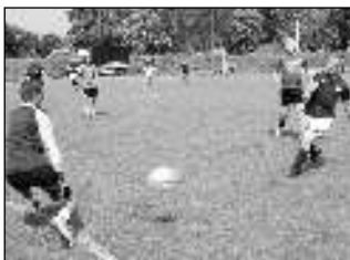
GÓL! Útočník jednoho z týmů právě střelil branku.

V sobotu 22. června se na travnatém hřišti TJ Karlštejn uskutečnil již 18. ročník Memoriálu Pepička Končela v malé kopané.