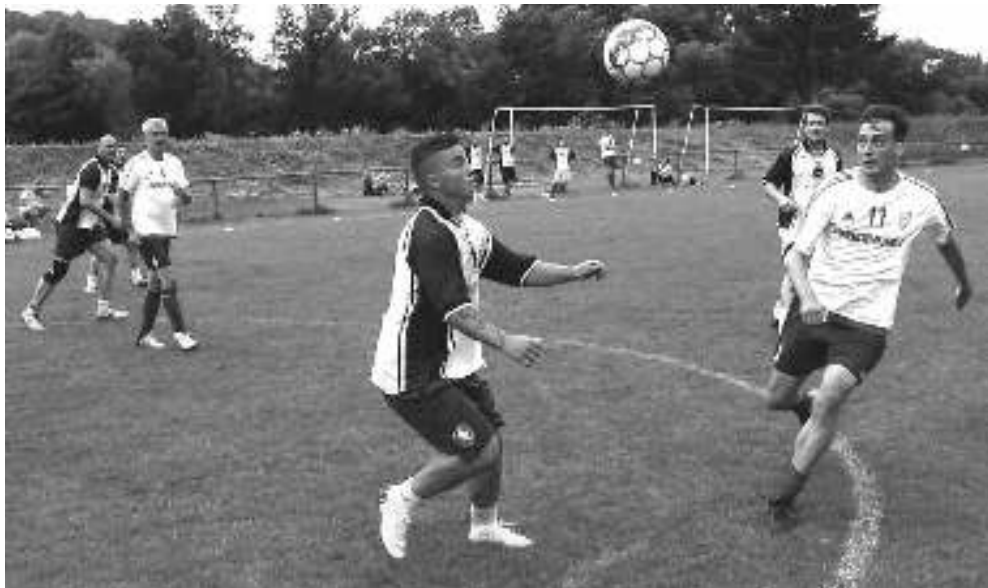
TURNAJ. Fotbalový Memoriál Peříčka Končela se konal 22. 6. v Karlštejně. (Viz str. 9)

Osmý sraz motorových tříček a motocyklů se konal druhý červnový víkend v karlštejnském kempu. Je neděle 9. 6. a lidé odjíždějí plni dojmů. Zase se po roce sešli s kamarády, se známými, kteří mají stejného koníčka, jako oni sami, povprávěli si o tom, co je za rok nového... Odjíždějí z kempu a mají na co vzpomínat. Velkým zážitkem opět byla spanilá jízda do Prahy. Projeli mimo jiné Starým Městem, Pařížskou, Staroměstským i Václavským náměstím, Chotkovou ulicí, odkud je krásný pohled na celou Prahu, prostě místa, kudy by sami neměli šanci jet. Odjíždějí, někteří se přijdou s námi, organizátory, rozloučit a děkují za zážitky. Odjíždějí, mávají a volají, že se těší zase příště. Když se podívám do plánu kempu, zjišťuji, že mám ubytování v chatkách a karavanech na rok 2020 plně obsazené už teď. (Dokončení na straně 9) (hes)