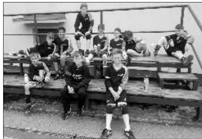
NA MISTROVSTVÍ. Mladší žáci házenkářů Řevnic na Mistrovství České republiky v severomoravské Studénce.