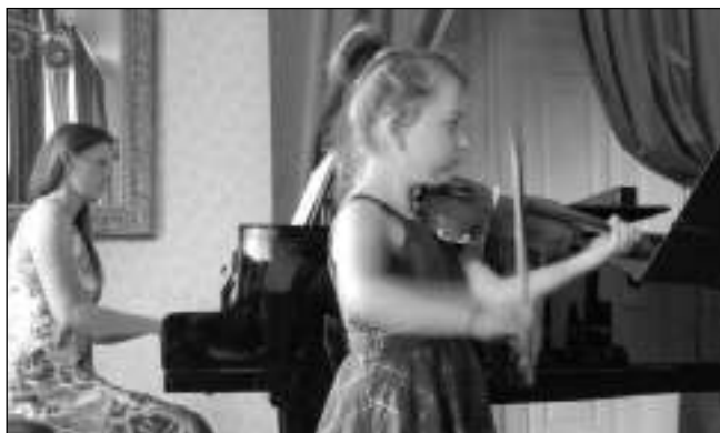
NETRADIČNÍ NOTIČKY. Jedna z malých účinkujících na koncertu Notičky netradičně.