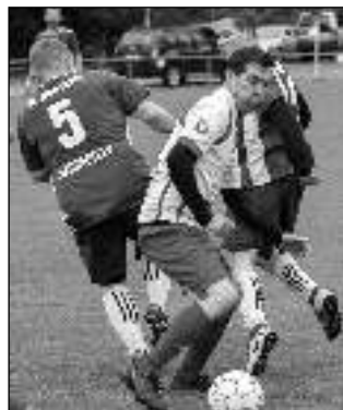
S Neumětely Karlštejn na svém hřišti v jarním zápase remizoval 1:1.

zápas lepila každým, kdo byl k dispozici. Mužstvu pomohl bývalý brankář Humpolík a na několik zápasů i někdejší kapitán Šperl. Do utkání několikrát nastoupili i trenéři mládeže Holeček a Vytern. Vzhledem k nízkému počtu hráčů tak áčko nastoupilo v Žebráku pouze v devíti, na dva zápasy (z toho jeden pohárový) se dokonce vůbec nesešlo a prohrálo kontumačně. Během jara získalo pouhé dva (!) body. Vstříelilo jenom osm branek a s celkovým počtem 25 přesných zásahů bylo nejhůř útočícím mužstvem soutěže. Cíl pro sezonu, tedy udržet okresní přebor, se s vypětím, především psychických sil, ale nakonec přeci jen splnit podařilo. Tým obsadil se ziskem šestnácti bodů dvanácté místo, na sestupující Broumy měl náskok šesti