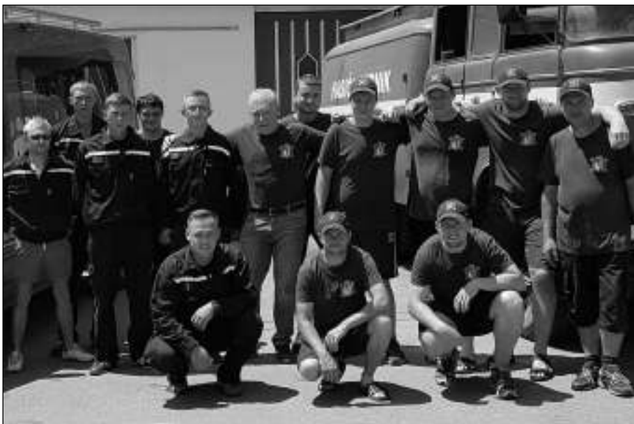
V GERNIKU. Všemradičtí a gerničtí hasiči na hasičské soutěži v Rumunsku.