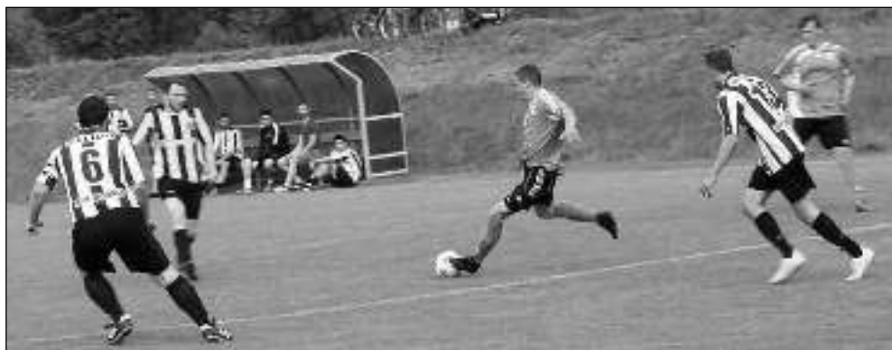
V posledním jarním mistráku prohrály Lety doma se zachraňujícím se běčkem Dobříše 0:3.

Sezona 2018/19 A-týmu v krajské 1. B třídě patří mezi průměrné jak ziskem bodů, tak předváděnou hrou. Po podzimní části přezimovalo mužstvo na devátém místě a na jaře na této příčce i skončilo. To lze považovat za ústup z pozic. Jaro bylo jako na houpačce, po výhrě přicházela skoro pravidelně porážka, zisk dvaceti bo-