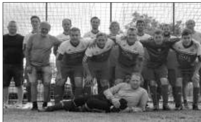
ÁČKO. Fotbalové A-mužstvo Všemradic.

Jak se dařilo fotbalistům FK Všemradice v jarní polovině soutěže? Její začátek se nesl v duchu četných absencí. Po špatných výsledcích v prvních kolech se začalo pracovat na rozšíření kádru. To se nám během sezony podařilo. S přibývajícím lidmi se zlepšila předváděná hra i výsledky. Konečně osmé místo v tabulce rozhodně nelze považovat za úspěch, závěrečná kola nám ale ukázala perspektivu mužstva do příští sezony. Příprava na ni odstartuje v polovině července a vyvrcholí prvním domácím mistrovským zápasem během poutového víkendu 24. - 25. 8. Kromě sobotního zápasu áčka se představí i žáci, přípravka a pravděpodobně i stará garda. Vladimír VYNŠ, Vižina