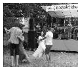
Na třetím Osovském akordu se i tancilo.

Návštěvnost Osovského akordu byla velká s kladným ohlasem. Zábava se posunula do pozdních nočních hodin a můžeme říci, že se vydařila. Kulturní a okrašlovací spolek děkuje všem, kteří se na akci podíleli: členům i příznivcům spolku, OU Osov, sponzorům a přátelům. Děkujeme účinkujícím a vzkazujeme: Tak zase za rok! Jana PTÁČKOVÁ, Osov