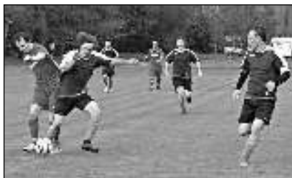
MOMENT JARA. S Podluhami Ostrovan prohrával ještě deset minut před koncem 0:3, přesto dokázal 4:3 zvítězit.

Někteří měli chuť se poměřit se silnějšími soupeři, jiní si byli vědomi náročnosti vyšší soutěže. Když padla volba na postup, bylo jasné, že se bude hrát o záchranu. Proto je třeba brát konečně dešáté místo (26 bodů, 7 vítězství, 5 remíz a 14 porážek) za jednoznačný úspěch. Výš tým, který nemá nijak vysoký věkový průměr, pomýšlet nemohl. Svědčí o tom třeba devítibodový rozdíl mezi OZT a devátým běčkem Loděnic. Přestože ve čtrnáctičlenné tabulce skončil OZT poměrně vyso-