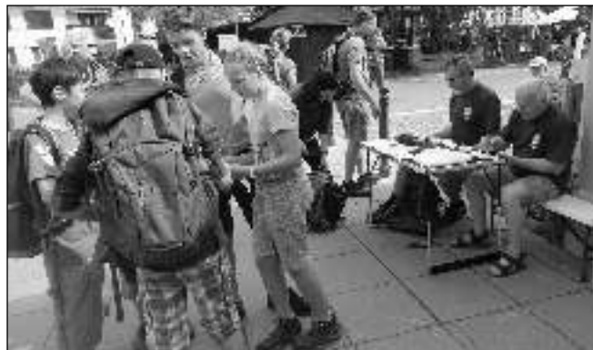
START. Výroční pochod na oslavu sto třiceti let od vyznačení první turistické trasy pořádal 22. 6. Klub českých turistů. Jedna z tras směřujících do Sv. Jana pod Skalou začínala na nádraží v Karlštejně.