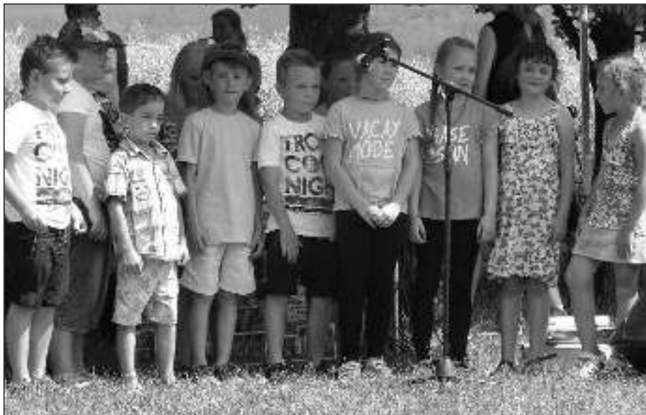
ŠKOLÁCI. Děti na oslavě 35. výročí otevření »nové« školy v Osově.