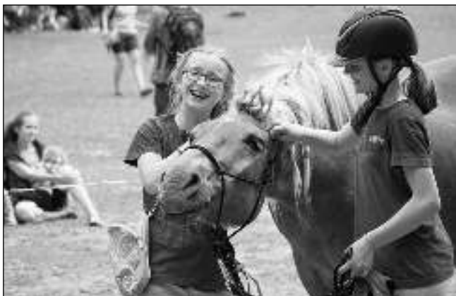
RADOST S KOŇMI. Děti s jedním z koníků na Dnu otevřených ohrad Hiporehabilitace Jupiter.

Tři skvělé moderátorky ve věku 8-12 let návštěvníkům Dne otevřených ohrad vlastními slovy představily všechny koně a velmi fundovaně komentovaly soutěž dětí z koňského