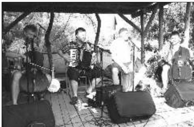
FESTIVÁLEK. Lhotecké předletí v Baru U Emy.

Úmorné vedro a výluka na trati Praha - Beroun mohly za to, že jsem na festiválek Lhotecké předletí k Baru U Emy ve Lhotce dorazil 15. 6. s notným zpožděním. Produkce Divadla na klíče z Teplíc už byla v plném proudu. Nevěděl jsem, o co v představení jde, ale zaznamenal jsem, že je správně trhlé, což se překům muselo líbit. Ti do pohádky aktivně vstupovali a pomáhali hercům Zvirátkům proti zlému Pytlákov. Milé zahájení programu! Po zvukové zkoušce začali hrát první hudební hosté, kapela Pan Sysel a