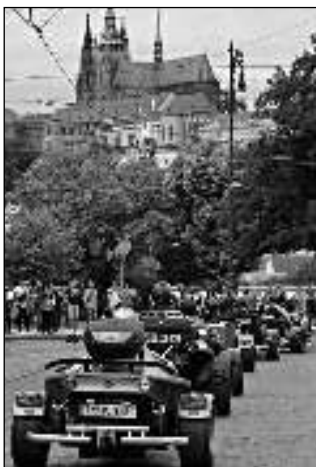
Spanilou jízdu Prahou si »tříkolkaři« užíli.

Před třemi dny, když jsme sraz připravovali, jsem nebrala vážně zmlínku při čtení předpovědi počasí, která