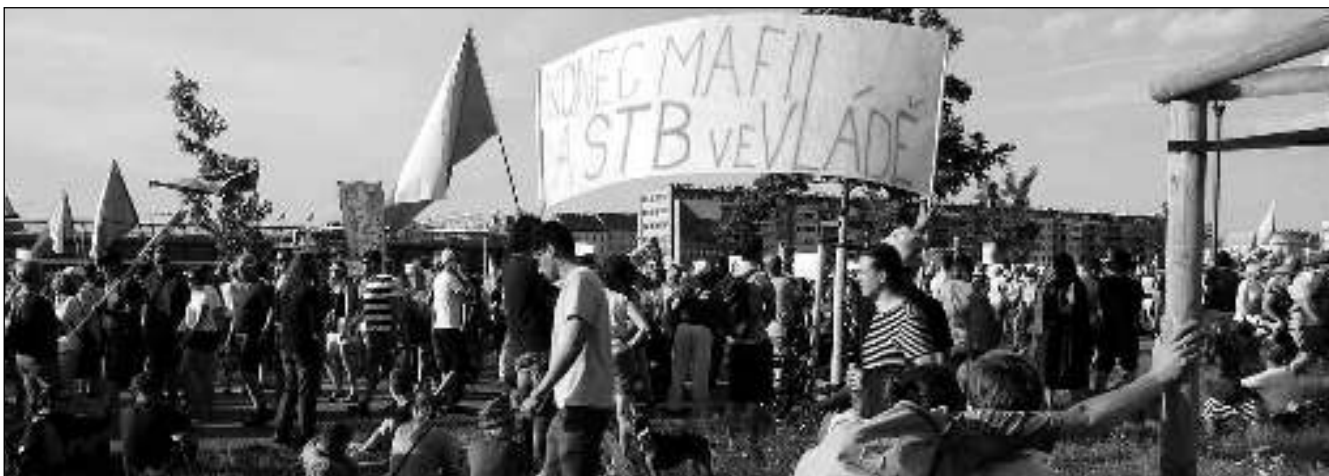
KONEC MAFII A STB. Na pražské Letenské pláni se demonstrovalo proti poměrům, které vládou v nejvyšších patrech politiky.