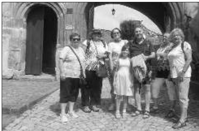
NA HANĚ. Hlásnotřebaňští v Moravském Šternberku.