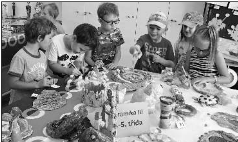
NA VÝSTAVĚ. Malí návštěvníci keramické výstavy hlasují pro výrobky, které se jim líbí.

Aktuální zprávy z Litně, Leče, Bělče, Vlenců a okolí 7/2019 (96)