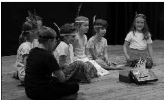
V KULTURÁKU. Děti z Naší školy na akademii.

Nejmladší ročníky si samy vymyslely, o čem budou hrát. Byli jsme svědky třeba příběhu o Jožinovi z bažin alergickém na prášek z letadla, který jde volit Biostranu, aby porazila stranu zlovlného pana Řepky a skoncovala s ničněním přírody. Čtvrtá a pátá třída natočily film podle pří-