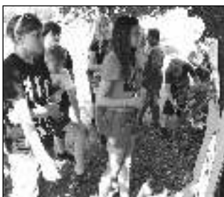
KVĚTINOVÝ DEN. Školáci na jednom ze stanovišť rozmístěných po Litni.

Třetí ročník Květinového dne se koncem školního roku konal v Litni. Program byl odstartován interaktivním divadelním představením deváté třídy, pohádkou s ekologickou tematikou. Následovala cesta Litní, během níž si žáci zopakovali zásady správného třídění odpadu.