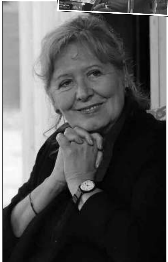
TŘEŠTÍKOVÁ V KŘESLE. Do svinařského Křesla pro hosta usedla proslulá dokumentaristka Helena Třeštíková. (Viz str. 9)