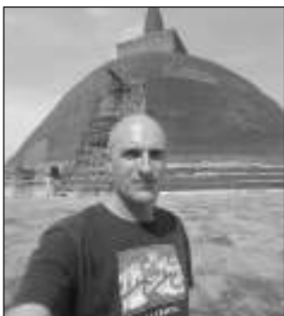
Starosta Dobřichovic letos vyráží na Sri Lanku.

1) Letní prázdniny strávím převážně v Dobřichovicích. V létě rozhodně nemám potřebu jezdit někde za sluncem, zejména s ohledem na to, že teplotních rekordů si hojně užíváme i u nás... Doma budu také proto, že na delší dovolené na Sri Lance jsem byl již v dubnu, jako nashvál zrovna v době, když se tam