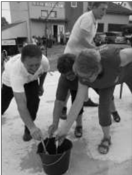
Jedna ze »sranda soutěží« na oslavách v chorvatské obci Dolany.