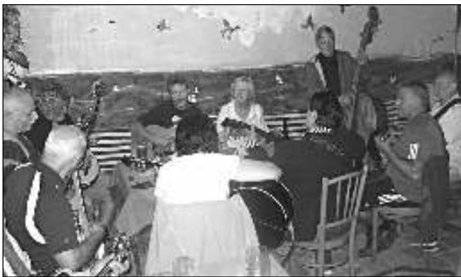
KARLŠTEJNŠTÍ MUZIKANTI. Skupina Karlíček na »hrané« v dobřichovické restauraci Holba...