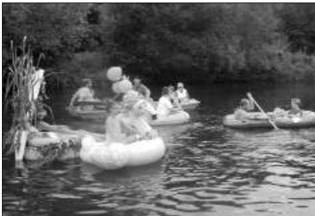
NA BEROUNCE. Část lodí, které se zúčastnily premiérové lampionové plavby od jezu k jezu v Hlásné Třebani.