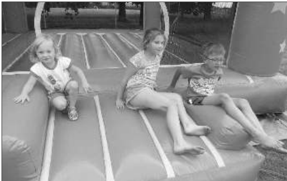
HRADNÍ HRÁTKY. Na Sportovním dnu byl dětem k dispozici skákací hrad.