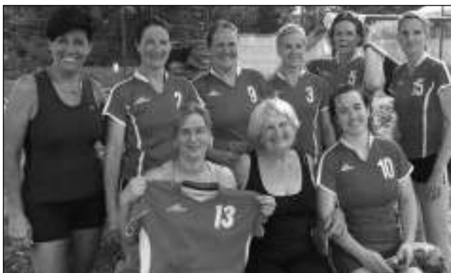
SKONČILY ČTVRTÉ. Dobříčovské volejbalistky na Mistrovství republiky seniorek v Čelákovicích vybojovaly bramborové medaile.

Osmý ročník Memoriálu Lídy Gemperlové letos přilákal na hřiště 7 celků. Předpovědi, které jsme sledovali celý den, vůbec nedávaly na odpolehnou možnost si zahrát! Průtrž nás vyhodila na 2 hodiny z kurtů a narušila organizaci turnaje. Ve zkráceném programu si pak některá děvčata moc nezahrála. Nakonec ale vše dopadlo dobře, občerstvení bylo výborné a ceny za podané výkony se