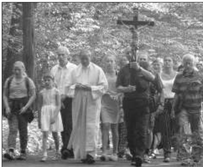
PROCESÍ. Několik desítek poutníků se vydalo procesím z Mníšku k baroknímu areálu Skalka na Brdech.

Byl sestaven tak, aby pobavil celou rodinu - od nejmenších dětí až po prarodiče. Na své si přišli chovatelé, pro které byla připravena třídní výstava drobného zvířectva, i dobrodružné povahy - těm byl určen Den otevřených dveří místních dobrovolných hasičů. Po celý víkend byly v