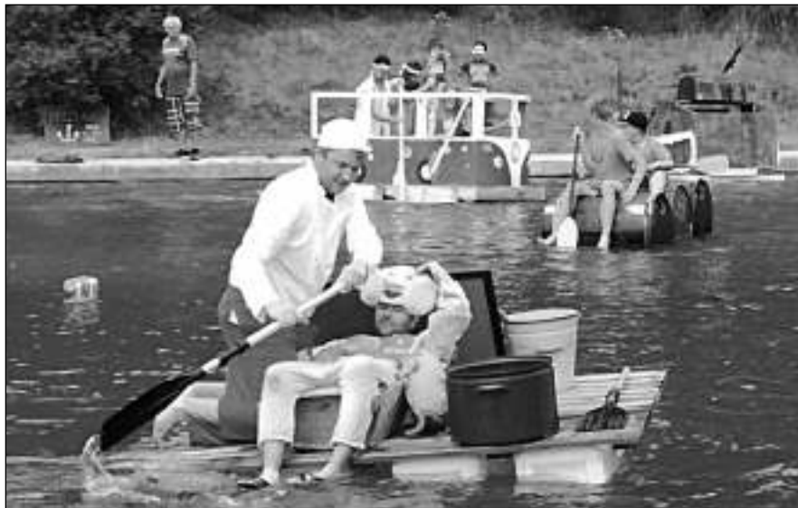
PRVNÍ NECKYÁDA. Účastníci premiérové všeradicé Neckyády při přelouvání koupaliště.