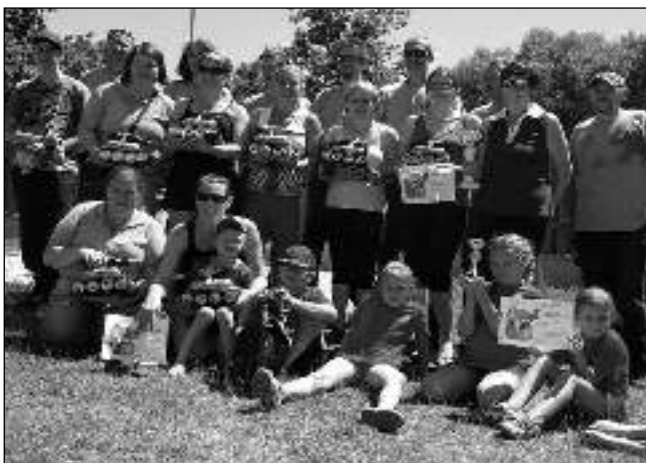
PO BOJI. Výprava osovských hasičů s cenami, které získala na soutěži Podbrdské stříkání.

Soutěž v požárním sportu - Podbrdské stříkání - se konala v Podbrdích. Dorazilo 14 družstev: 4 dětská, 4 ženská a 6 mužských. Soutěžní klání se skládalo ze dvou kol, nejdřív přišly na řadu štafety. Děti běžely jako vždy, pro dospělé si Podbrďáci přichystali štafetu netradiční. První závodník musel nejdříve překonat část trasy na hranolech opatřených plochými lany do ruky, kdy bylo třeba správně skloubit pohyb rukou a nohou. Druhý běžec celou trasu nesl kbelík, který si převzal běžec číslo tři, nabral do něj vodu a společně se čtvrtým (posledním) běžcem, který nesl ruční stříkačku tzv. džberovku uhaněli k cílové čáře. Pak jeden vši silou pumpoval, aby vytvořil dostatečně silný proud vody, druhý se snažil proudem mřít do otvoru v terči a sestřelit plastovou lahev. V druhém kole už se běžely »klasické« požární útoky. Pro osovské malé