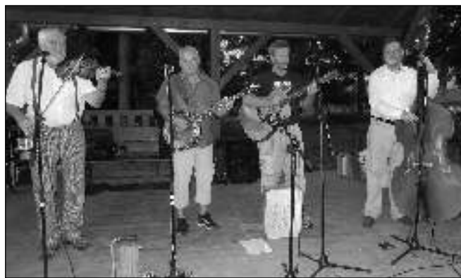
...a country kapela Kapičky při vystoupení na Obecní zábavě v černolickém parku.