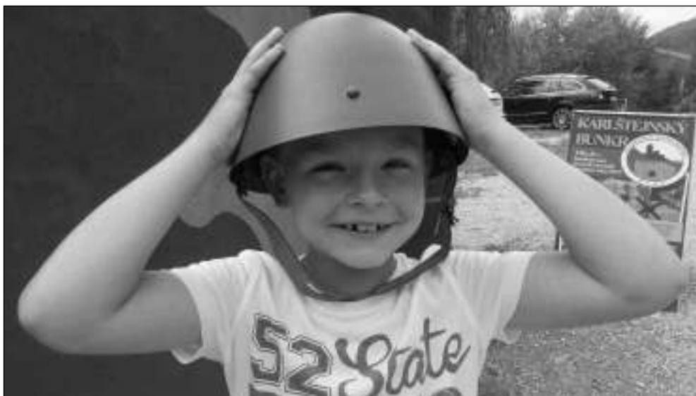
OTEVŘENÝ BUNKR. Demě kromě pondělí od 10 do 18.00 je o prázdninách otevřeno karlštejnské Muzeum lehkého opevnění, které se nachází v předválečném »bunkru« poblíž parkoviště.

Václav Kotek, otec známého herce Vojty Kotky, byl podle ČTK členem Divadla Jára Cimrmana od roku 1973. Začínal jako kulíšák, později účinkoval ve dvanácti hrách souboru jako herec a stal se z něj také manažer divadla. (miř)