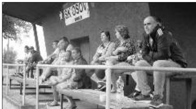
Diváci sledují zápasy poutového turnaje.

Osov zorganizovali Petr Procházka a Marek Poluk. Mače trvaly do pozdního odpoledne, pohár vítězů si odnesl tým s názvem Anglie, druhé místo obsadili zástupci Jince, třetí skončila Stará garda. Akce se vydařila i díky dobrému počasí a neméně dobrému občerstvení, které bylo v nabídce. Organizátoři děkují za pomoc Obecnímu úřadu a Sportovnímu klubu v Osově. Text a foto Marie PLECITÁ, Osov