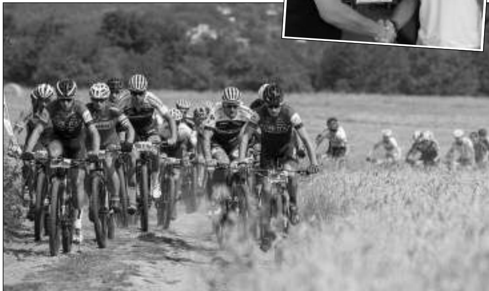
V POLÍCH. Cyklistický závod ČT Trans Brdy se jel v sobotu 20. července. Zázemí bylo letos přesunuto z Dobřichovic do polí u skládky nad Řevnicemi.

„Přes opakované kontroly v pátek večer i v sobotu ráno se škůdci či skupině škůdců podařilo narušit průběh závodů a ohrozit bezpečnost nic netušících jezdců, kteří se kvůli změně značení dostávali mimo trať,“ uvedli organizátoři v oficiálním prohlášení bezprostředně po skončení závodů. Populární cyklistický podnik, součást seriálu Kolo pro život, neznámí útočníci sabotovali už loni, kdy byl start v Dobřichovicích. I tehdy přeznačili trať a svedli závodníky mimo stanovenou trasu. Letos bylo zázemí přesunuto nad Řevnice. (Dokončení na str. 12) (mif)