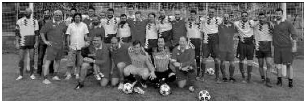
PLICHTA. Karlštejnské áčko a stará garda po exhibičním utkání, jež skončilo smírně 3:3.