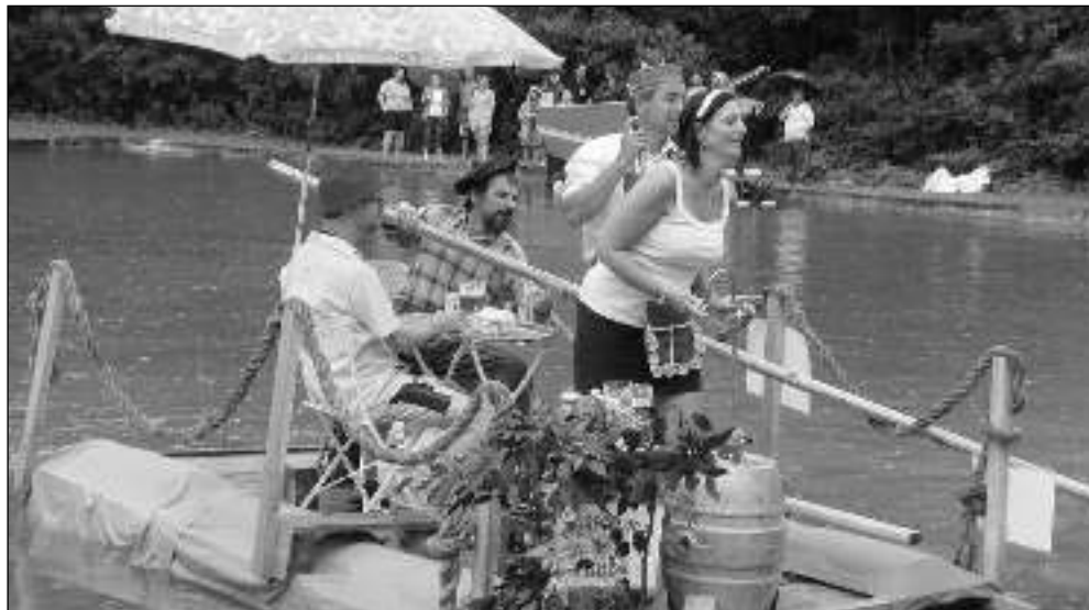
PLOVOUCÍ HOSPODA. Jedno z plavidel, které se zúčastnilo čtvrté Osovské regaty.