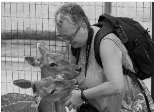
NA SOUSTŘEDĚNÍ. Autorka článku na letním výcvikovém táboře letošských kynologů.

Jaké? Když skoro celý rok pracujete nejen se psy, ale také - a zejména - s lidmi, a to jak v zaměstnání, tak při pejskařině, tak si od nich chcete odpočinout. Vůbec vám nevedí, nejsou-li s vámi na táboře zástupy. Když nás bylo na táboře hodně a měli jsme každý více psů, bylo to velmi náročné - občas nebyla nouze ani o psí konflikty. A že není nic příjemného vyhledávat v cizím městě veterináře, to mi věřte. Když je společně hodně lidí na malém prostoru celých čtrnáct dnů, přijde i »ponorková« nemoc. Pokud se stane, že je ještě ke všemu po celou dobu pobytu na táboře vedro, nastávají problémy s místem v lednici, kam každý táborník ukládá své zásoby a někdy se stane, že musíte přerovnat celý obsah lednice, abyste se dostali ke svému jogurtu, sýru či jiné pochutině. Dalo