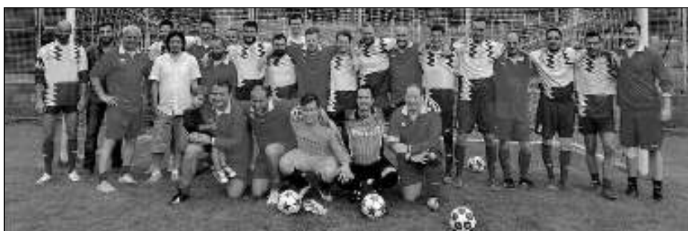
PLICHTA. Karlštejnské áčko a stará garda po exhibičním utkání, jež skončilo smírně 3:3.