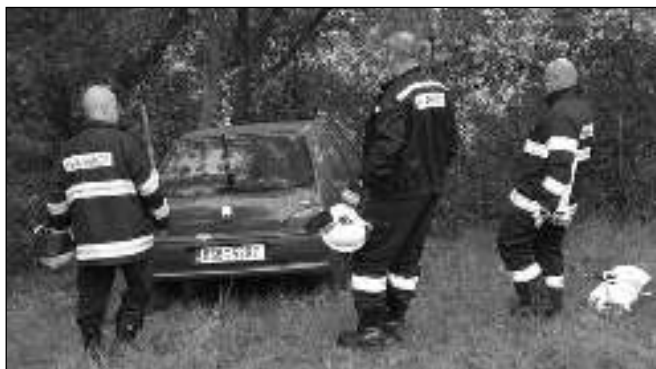
AUTO V PLOTĚ. V plotě skončilo auto, které ujelo svému majiteli na Čihově. O jeho vyproštění se postarali místní hasiči.