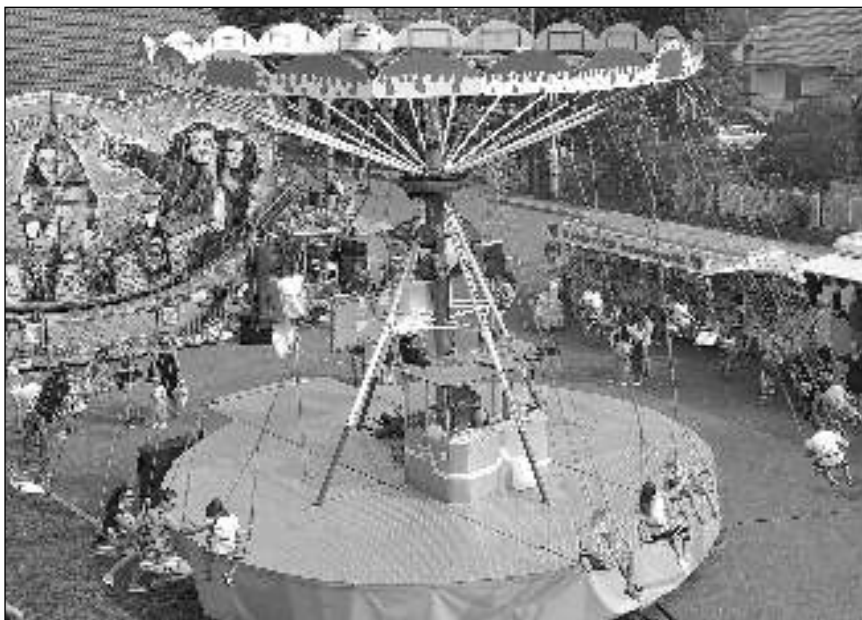
NA ŘETÍZKÁČI. Předposlední prázdninový víkend se ve Všeradicích konala tradiční Bartolomějská pouť. Kolotoče, houpačky, střelnice... nesměly chybět.

V areálu minigolfru se o víkendu konala výstava drobného zvířectva Svazu chovatelů Suchomasty, na níž byli k prohlédnutí i zakoupení králíci, drůbež či holubi. Ivana NÁJEMNÍKOVÁ, Všeradice