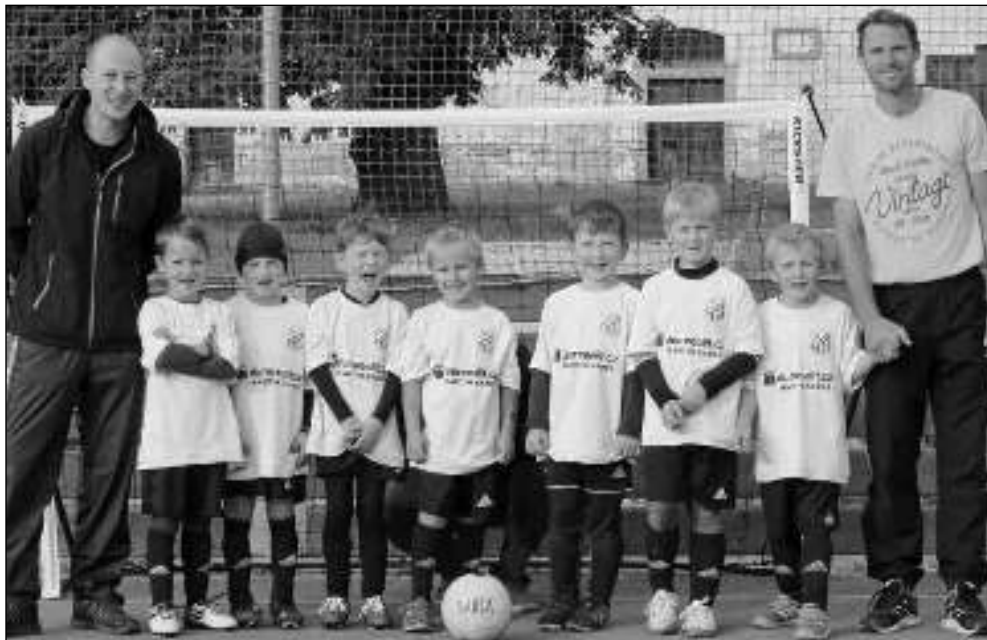
NA TURNAJI. Nejmenší všeradičtí fotbalisté na turnaji fotbalových nadějí.