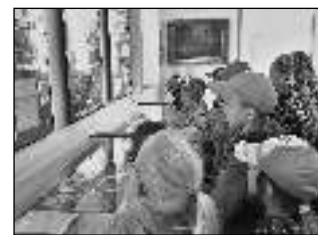
Liteňští druháci v místním muzeu.