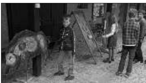
V MUZEU. Zadnotřebeňští školáci v berounském Muzeu Českého krasu.

Na konci září se vydali starší žáci ze zadnotřebeňské málotřídky do berounského Muzea Českého krasu. Jeho pracovníci připravili pro děti zajímavý interaktivní program. Díky němu se dozvěděly, jak vznikají sopky a že člověku sopečná činnost nemusí přinášet jen zkažu, ale i užitek. Mohli jsme si osahat sopečné kameny a polodrahokamy. Děti zhlédly několik naučných videí a na závěr si vytvořily svoji vlastní sopku. Tímto programem naše spolupráce s berounským muzeem nekončí. Na konci října se vydají zaměstnanci muzea k nám s pořadem Země a příroda vypráví, pomáhá, ale i překvapuje. Zmíněné programy vhodné doplňují naše učivo prvouky a přírodovědy. Pokud bude očekávaný program stejně zdařilý, jako ten předchozí, mají se školáci opravdu na co těšit! Pavlína FIALOVÁ, ZŠ Zadní Třebeň