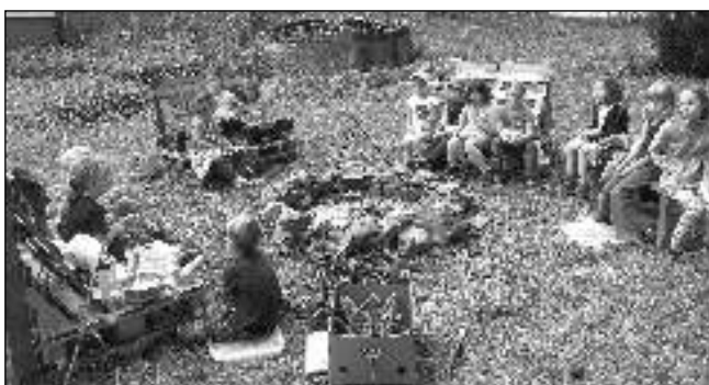
NA ZAHRADĚ. Děti z Naší školy u ohniště.

Děti sledují aktuální ekologické dění ve světě a mají zájem přispět svým dílem. I my, učitelé, cítíme zodpovědnost za budoucnost planety, ale spíše než demonstrace za klima podporujeme u dětí praktickou činnost k jeho zlepšení. S nadšením jsme se přihlásili i do akce Nový les pro