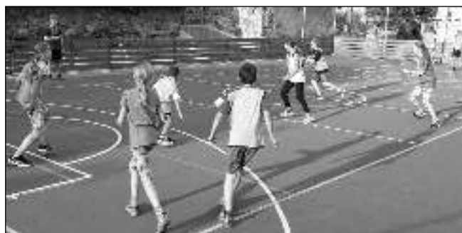
FOTBÁLEK. Na sportovním odpoledni se hrála i kopaná.