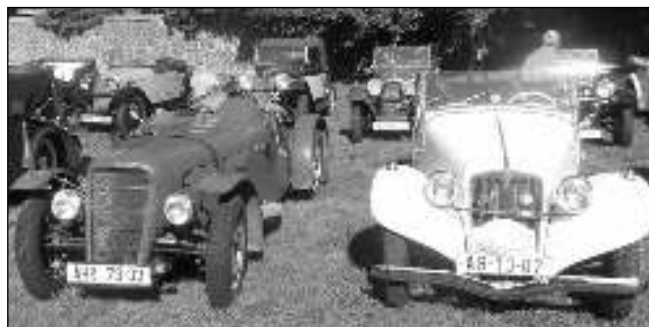
AEROVKY POD MOSTEM. Nablýskané vozy zn. Aero vystavené pod mostem v Dobřichovicích.