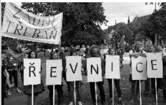
START. Řevničtí a zadnotřebaňští účastníci pochodu před začátkem akce na náměstí v Řevnicích.