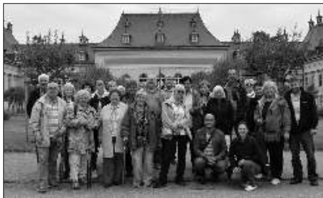
V SASKÉM ŠVÝCARSKU. Výprava hlásnotřebeňských zahrádkářů v areálu zámku Pillnitz.

Pillnitz, který sloužil jako rezidenční sídlo saských kurfiřtů a králů. Obrovský komplex budov - Nový palác, Horní palác s čínskými motivy na fasádě, kaple, pivovar - napodobuje čínské exteriéry i interiéry. Zahrada kolem zámku byla za držením kurfiřtů značně rozšířena o anglickou část, sbírku jehličnanů i kolekci rostlin z celého světa. Raritou je nejstarší japonská kamelie v Evropě - byla přivezena a zasazena již v roce 1801. Vedle ní stojí velká železná stavba, která po speciálních kolejkách kamelii v zimě ochraňuje. Dobře vymyšlené. Park doplňují pavilony a budovy, třeba dům palem nebo oran-