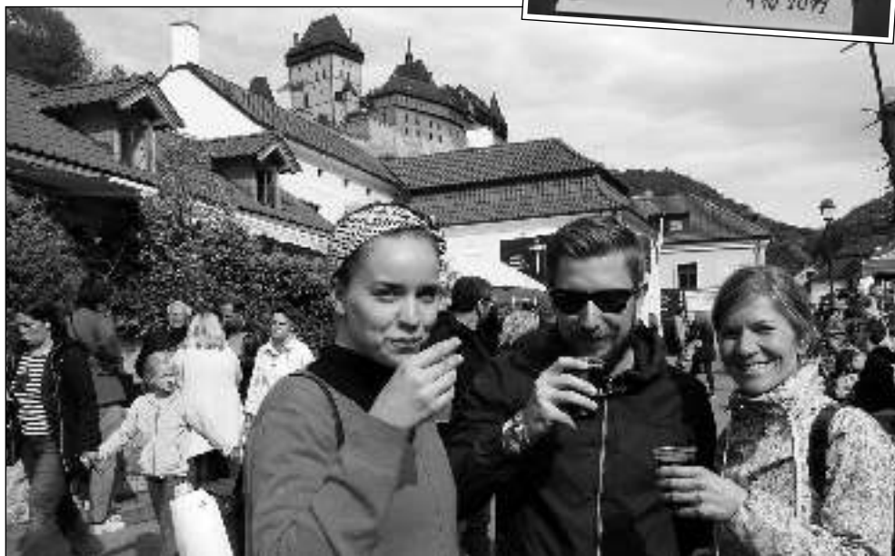
NA ZDRAVÍ. Návštěvníci karlštejnského vinobraní ochutnávají zdejší burčák.