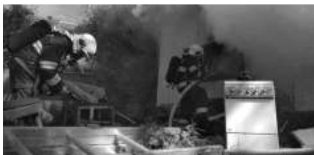
Liteňští hasiči likvidují požár chaty v Zadní Třebaní.

Po příjezdu k místu události s tatrou a manem se Liteňští na pokyn velitele zásahu napojili hadicemi na rozdělovač, připravili třetí útočný proud a spolupracovali s profesionály z Řevnic. Hasiči na začátku zásahu pracovali v dýchací technice, prováděli průzkum, hašení a rozebírání střešních konstrukcí k dohašo-