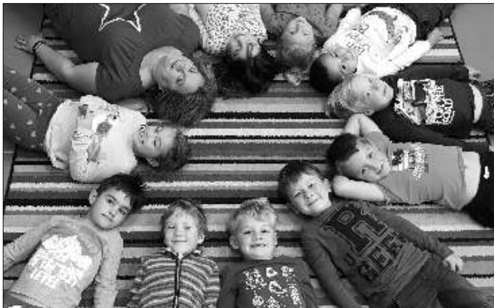
DEN ÚSMĚVU. Prvníci při jedné z akcí, kterou oslavili Den úsměvu.

Aktuální zprávy z Litně, Leče, Bělče, Vlenců a okolí 10/2019 (99)