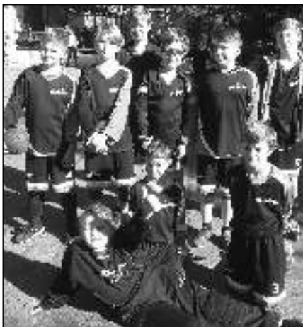
ŽÁCI. Malí řevničtí házenkáři po zápase v Čakovici.

Podzimní sezona řevnických »národních« házenkářů dospěla do finále. V Čakovicích 12. 10. začali chlapi v pro ně nekřesťanskou osmou hodinu ranní. Sice bylo tepleji než před týdnem, ale nízké ostré slunce ztrpčovalo sledování míče při všech činnostech a brankáři si nemohli sluneční branku »vynachválit«. Naši muži si s méně zkušeným soupeřem, který již vyčerpал možnost výpomoci prvotních hráčů, poradili a vyhráli 24:17. Smíšené družstvo mladšího žactva odehrálo vyrovnaný zápas, ale po vyhraném poločase 13:11 už výškové převaze domácích nedokázalo čelit a