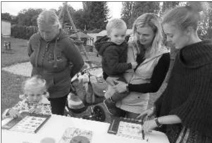
NA POSVÍCENÍ. Na posvícenském odpoledni bylo připraveno dvanáct stanovišť, kde děti plnily nejrůznější úkoly.