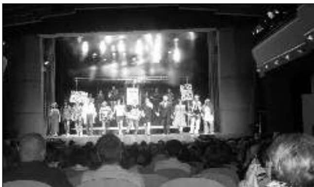
V DIVADLE. Závěrečná děkovačka při představení Šedesátky v pražském Divadle ABC.

Hudební komedie je příběhem retro-fila pana Bora - výletem do časů, kdy klukům rostly dlouhé vlasy a pravda a láska nebyly vulgárními vý-