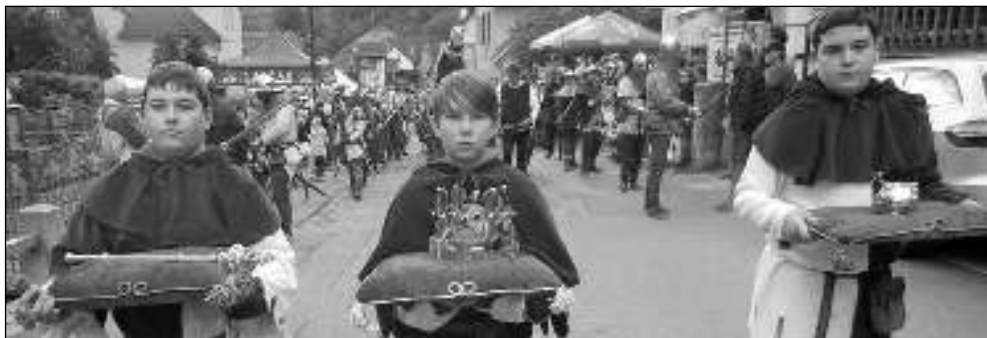
JEDE KRÁL. Před císařem Karlem IV. nesli panoši v průvodu korunovační klenoty.

Bohatý program akce potěšil malé i velké diváky na hradě i v podhradí. Vyvrcholením obou dnů je zahájení a slavnostní historický průvod od vinice až na hrad. V čele jede císař římský a král český Karel IV., nechybí jeho choť Eliška Pomořanská ani příbuzní tři sta členů císařského dvora.