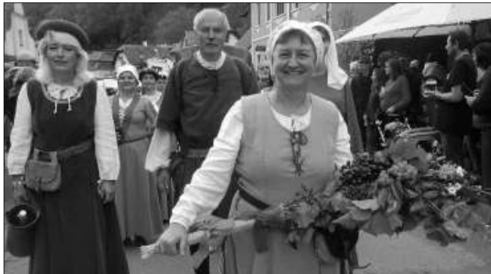
V PRŮVODU. Zlatým hřebem Karlštejnského vinobraní byl - jako vždy - historický průvod. (Viz strana 8)