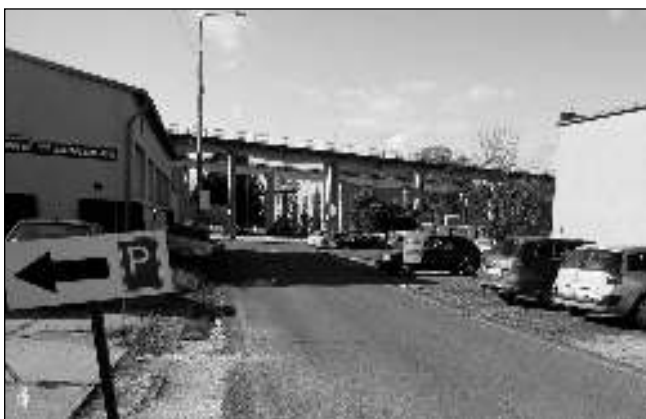
EUROVIA. Vyrostete v zátopové ploše po firmě Eurovia satelitní městečko s desítkami domů a bytů?

Uběhlo několik měsíců a město Řevnice v dlouho připravovaném novém ÚP bohužel navrhuje povolení výstavby v oblasti Pod Lesem i Na Vrážce. Nyní je v jednání i výstavba v oblasti Eurovie. Protože město tuto oblast nekoupilo po nabídce firmy Eurovia, vlastní pozemky soukromá