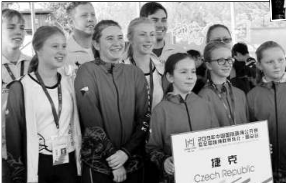
SKOKANKY V ČÍNĚ. Členky řevnického oddílu Rebels O.K. na závodech v Číně.

Řevnice, Čína - Sedmáct medailí vybojovaly na mezinárodním šampionátu, který se konal od 7. do 15. 10. v Číně skokanky přes švihadlo z řevnického oddílu Rebels O.K. Na třetím ročníku mezinárodní soutěže China Open pořádané Čínskou Rope Skippingovou Asociací se sešlo 208 závodníků z 15 různých zemí světa. Českou republiku v maletné provincii Gu'an asi 120 km od Pekingu reprezentovalo 9 skokanů, z toho 6 skokanek z týmu Rebels O.K. Proti světové elitě se holky z Poberouni postavily ve speed a freestyle disciplínách. Čeští reprezentanti si kromě spousty nezapomenutelných zážitků přivezly devatenáct medailí - 17 z nich se houplalo na krku právě našim »rebelkám«. Čeští sportovci se také vypravili na Velkou čínskou zeď, viděli Zakázané město, ZOO v Pekingu a bíločerné pandy. (Dokončení na straně 11)