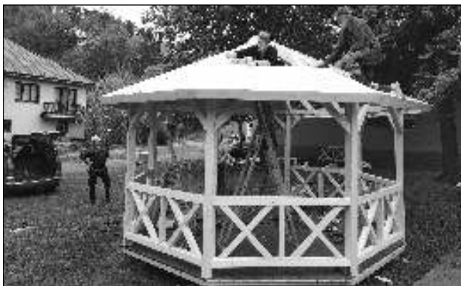
ROSTE. Altán na zahradě třebaňské školy.

Děti a žáci ze zadnotřebaňské málořtřídky si připravili vystoupení na Havelské posvícení. Vzhledem k tomu, že posvícení bylo z důvodu státního smutku zrušeno, předvedli své básničko-písňové pásmo rodičům a přátelům školy na brigádě, která se na