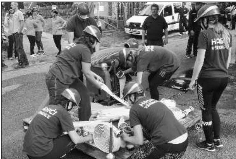
SRANDAMAČ. Všemradické ženy na Hasičských hrátkách v Drahlovicích.

Již tradičně se SDH Všemradice v polovině září zúčastnil Hasičských hrátek, »srandamače«, který pořádají kamarádi v Drahlovicích. Tentokrát nesoutěžili jen naši borci, ale také ani ne rok fungující dámský tým. Přítomná družstva žen a mužů porovnala své síly, resp. časy v požárním útoku a štafetě 4x100 metrů. Předvedlo se i několik týmů žáků. Soutěž se odbyvala v přátelském, poklidném duchu, bez vážnějších zranění a za pěkného počasí. Dva poháry za 2. místa byly třeshinkou na dortu za pěkným sportovním odpolednem stráveným po boku dobrých přátel. A protože se neradí loučíme, pokračovali jsme bok po boku až do pozdních večerních hodin v Somniu, kde teklo šampaňo i krev z bifteků, na kterých jsme si zaslouženě pochutnali. Ivana NÁJEMNÍKOVÁ, SDH Všemradice