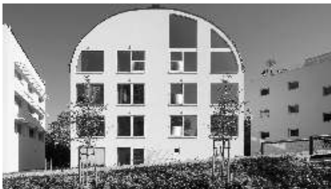
Řevnický komplex Corso Pod Lipami.