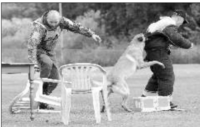
NA ZÁVODECH. O dramatické situace nebyla na podzimním obranářském závodu v Letech nouze.