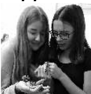
S HADY. Liteňské devítáčky s hroznější.

V liteňské základní škole jsme v rámci výuky měli na podzim několik živých učebních pomůcek. Ve vzdělávání je důležitou součástí názornost, v učebnicích jsou obrázky, v mnoha hodinách používáme počítače, takže obrázky se i hýbou, ale není nad živou ukázkou!