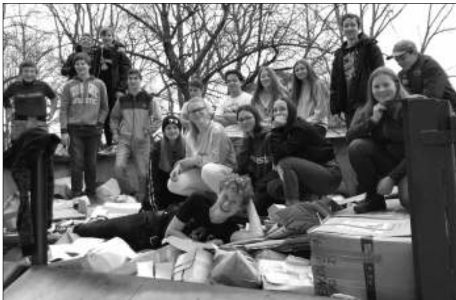
SBÍRALI PAPÍR. Sběr starého papíru zorganizovala liteňská škola. (Viz strana 8)

Aktuální zprávy z Litně, Leče, Bělče, Vlenců a okolí 12/2019 (101)