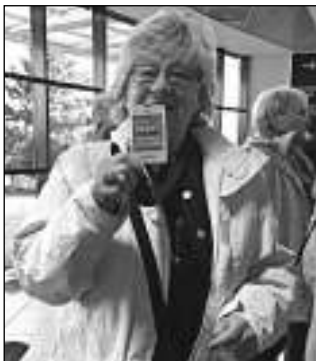
Autorka článku na pražském letišti Václava Havla.

Výlet na pražské letiště Václava Havla podnikla skupina žen z Hlásné Třebové, které si říkají Holky v rozpuku. V Terminálu č. 3 jsme prošli