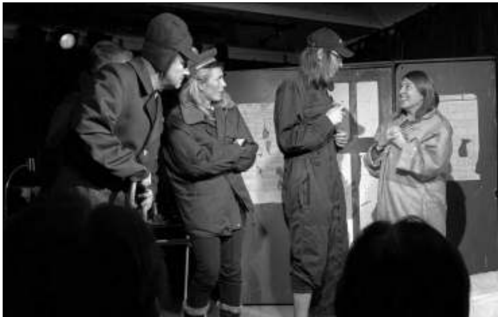
NA NÁDRAŽÍ. Ochotníci z Čenkova při představení ve Všeradicích.

* Výstava fotografií Aleny Šustrové nazvaná Cestou tam i nazpátek byla zahájena 30. listopadu ve Společenském sále Podbrdy. Snímky můžete zhlédnout do 31. 12. v otevřené době místní hospůdky. (aš)