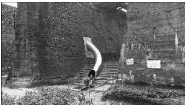
Bývalé průmyslové areály se dají přebudovat různým způsobem. V německém Porúří je využívají i jako zábavní parky.

Otázka budoucího využití bývalého areálu Eurovia mne tíží nejen jako starostku sousední obce, přes kterou se již nyní valí kolony aut a sdílíme