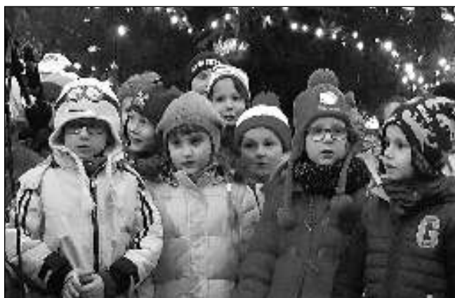
ROZSVÍCILY STROM. Při rozsvěcování stromku na zadnotřebaňské návsi zazpívaly 1. prosince děti z místní školky i školy.

do školky výjimečně o den dříve, 4. 12. Pravděpodobně nezapomene ani na nadílku. Ve středu 18. 12. pořádá od 17.00 ve Společenském domě v Zadní Třebani naše ZŠ a MŠ Váno-