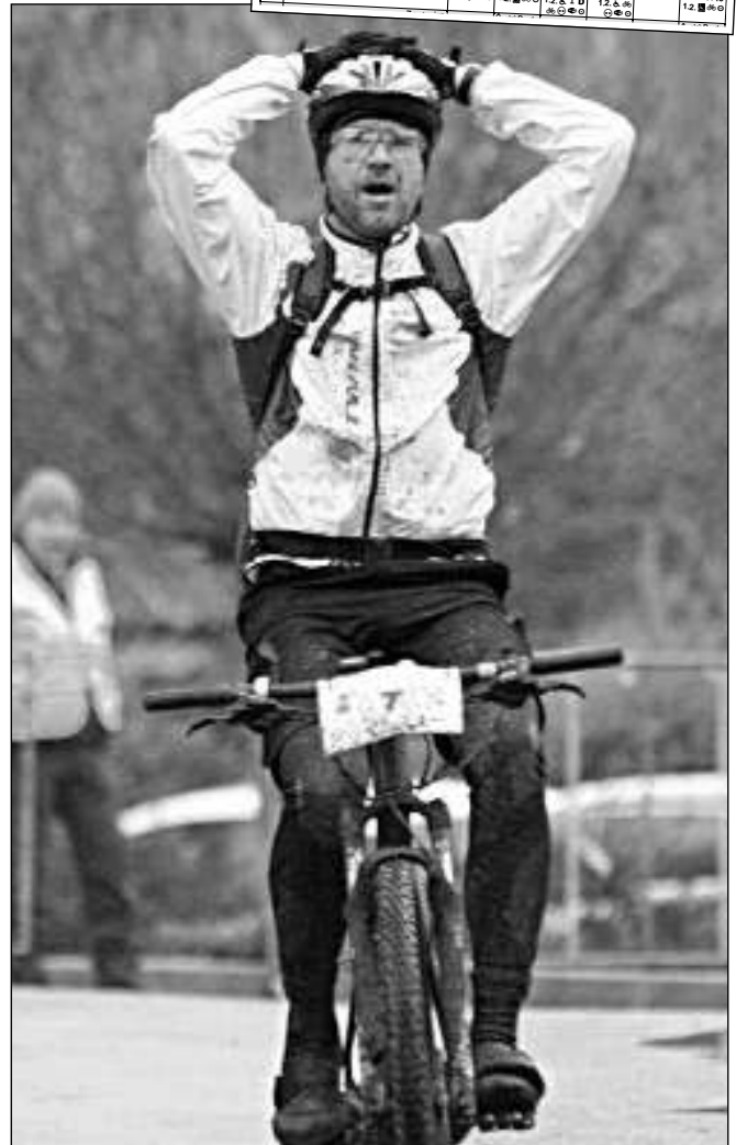
WTB. Cyklistický závod Winter Trans Brdy odstartoval 23. listopadu v pravé poledne z návsi v Letech. (Viz strana 14)

nezvládl viník bouračky nepřehlednou zatáčku, která je místem podobných nehod poměrně často,“ uvedla iDNES.cz. „Uslyšeli ránu, šli se podívat a našli auto zabořené v korytě potoka.“ Podle serveru Dopravní info.cz řidič vyvázl bez zranění. (mif)