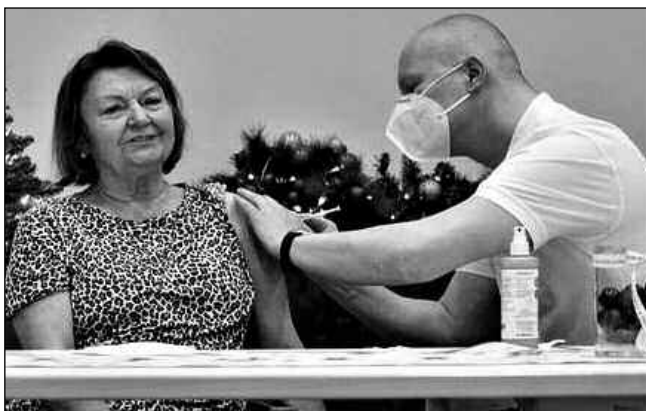
NEJDŘÍV SENIÓŘI. Očkování seniorů v jednom z německých pečovatelských zařízení.

Němci byli chvíli patričně pyšní na to, že jejich výzkumníci spolu s americkými vynalezli očkovací látku, jež byla v Evropě povolena jako první. Radovali se, že očkování je světlo v tunelu epidemie. I v očkování chtěli jít příkladem. Nakoupili však dosud nedostatečný počet vakcín. Radost je brzy přešla. Najednou jsou v jiných zemích miliony naočkovaných, a v Německu jen pár tisíc. V první linii měli být naočkovaní lidé nad 80 let, ale ti, kteří nežijí v pečovatelských domech, nemohou v některých regi-