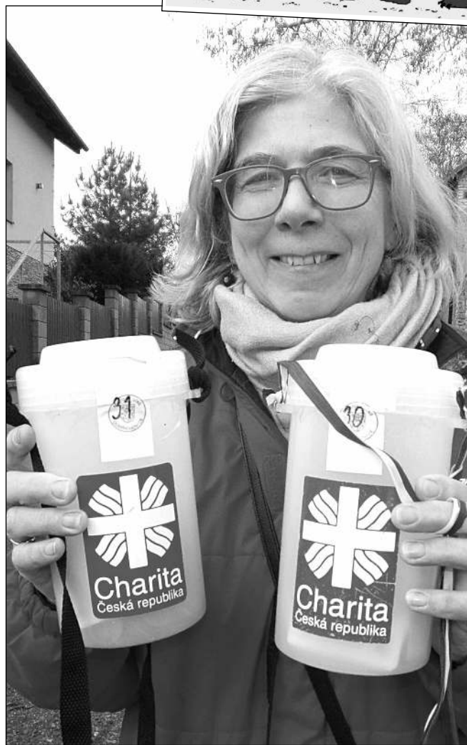
VYBRÁNO. Charitativní Tříkrálová sbírka se konala v našem kraji. V kasičkách se našlo »neuvěřitelných« 82.737 Kč. (Viz str. 9 a 11)

Hrozně mi chybí divadlo, říká »venkovanka« Švandová