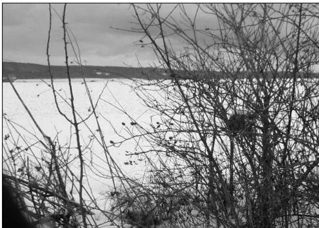
KDE JE HNÍZDO? Najděte, vyfoťte, pošlete. První úspěšný fotograf bude odměněn...

rounského regionu. Využijeme při tom různé dopravní prostředky a budeme poznávat nová místa. Některé trasy jsme si prošli poprvé, jiné jsme si zopakovali. Mezi oblíbené vycházky mnoha obyvatel Karl-