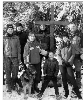
Potomci mlynářů Havlíčků u obnoveného křížku v Havlíčkově Mlýně.

né dobroty, ale zase se může zapojit každý na dálku. Kdokoliv, věk není nijak omezen. Od 1. do 28. února pošlete fotografii své masky na FB: @svetluskymtan. Téma Husité. Hlasovat o nejlepší masku můžete »lajkem« na stránce u jednotlivých fotek. Vítěz získá triko a tématický hřnek. Jana Šmardová KOULOVA, ČČSH, Tmaň