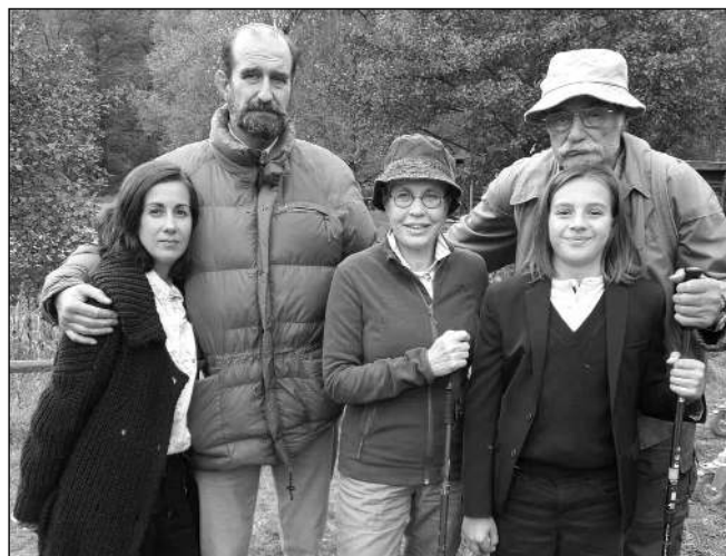
Z NATÁČENÍ. S kolegy při natáčení seriálu Chataři.