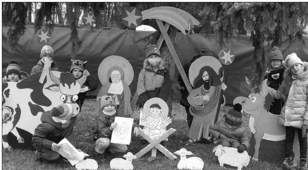
U JESLÍ. Osovské děti v betlémě, který stál u místní prodejny Coop.