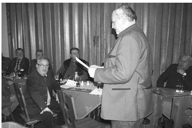
Karlštejnská myslivci na jedné ze svých schůzí.

Honitbu máme pronajatou od Státních lesů za nemalé nájemné, k jehož úhradě nám již několik let vydatně přispívá dotace od městyse Karlštejn. Honitba o rozloze 1169 hektarů zahrnuje podstatnou část národní přírodní rezervace Karlštejn. Příroda je zde chráněna již od roku 1952, je nádherná, ale její ochrana vyžaduje určitá omezení, kromě jiného i při výkonu práva myslivosti. Mimo srnčí zvěře, černé zvěře (divokých prasat), zaběhlé mufloní zvěře a lišky zde není povoleno lovit jinou zvěř (jezevce, kuny, divoké holuby, sluky...). Zajíce a bažanty by sice možné lovit bylo, ale jejich