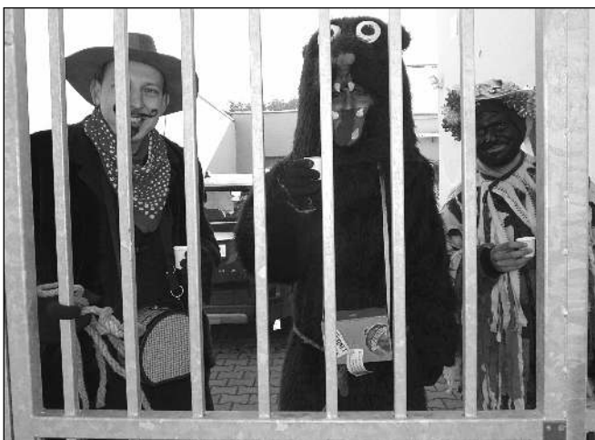
ZA MŘÍŽÍ. Medvěd s medvěďákem a Masopust na snímku tak trochu symbolizujícím letošní »fašank«...

Děkujeme nejen přejícím a pohostinným obyvatelům Zadní Třebaně, ale také všem, kteří se na přípravách a organizaci CO-masopustu-21, neboli XXXII. Poberounského masopustu podíleli. Obecním úřadem počínaje a štědrými dárci cen do tomboly konče. Díky! (mif)