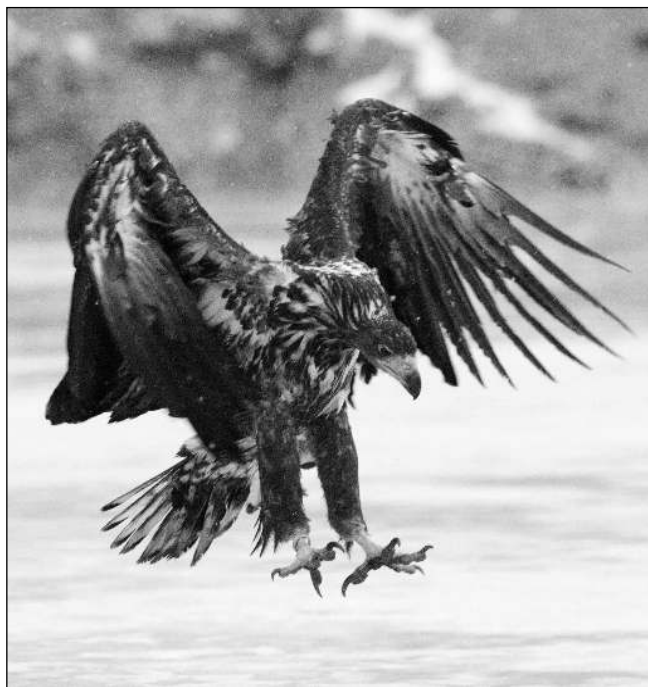
NA LOUVU. Orel mořský.

Každý z nás nese současná omezení jinak. Netroufám si to rozebírat - je to moc citlivé a složité. Ale mohu říci, jak se snažím vyrovnat se s abnormálním životem v této době já. Mediální masáž z televize, internetu i tisku se snažím eliminovat tím, že televizi pouštím výjimečně, internet si pro sebe »filtruju« a zprávy o koronaviru čtu jen občas, nebo se jim vyhýbám úplně. Tisk nečtu vůbec, tedy až na ten regionální. Svůj čas