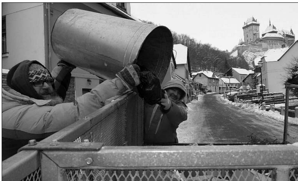
MRAZIVÝ ÚKLID. Ani velké mrazy, které panovaly v první polovině února, nepřerušily pravidelný úklid veřejných prostranství městyse.

Zprávy z městyse i hradu, historie obce, kultura, sport... 2/2021 (113)