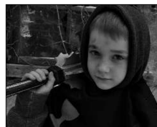
Jeden z malých husitů při první bojovce, která se ve Tmani konala zkráje února.