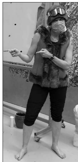
JDEME NA TO! Jiná varianta cvičebního »outfitu«.