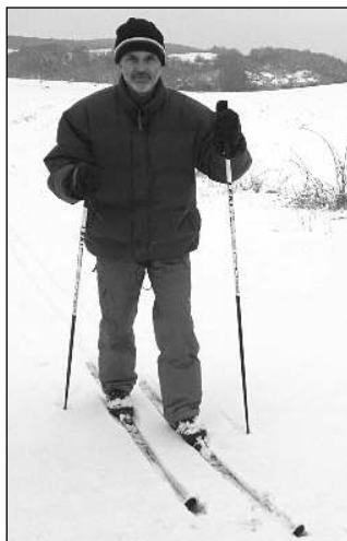
LYŽNÍK. První polovina února vyznavačům zimních sportů přála. Běžkaři se proháněli i v polích nad Všeradicemi.