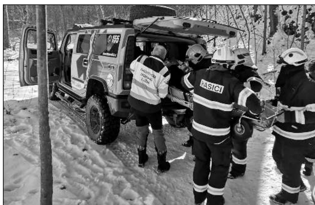
Řevnickí záchranáři při zásahu u Bubovických vodopádů.

Komplikace na cestě k zásahu potvrdil i řevnický profesionální hasič Pa-