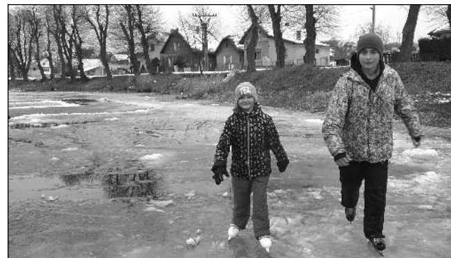
UŽ ROZTÁL. Zamrzlého rybníka se ještě na poslední chvíli před oblohou snažily využít děti ve vesničce Kornu.