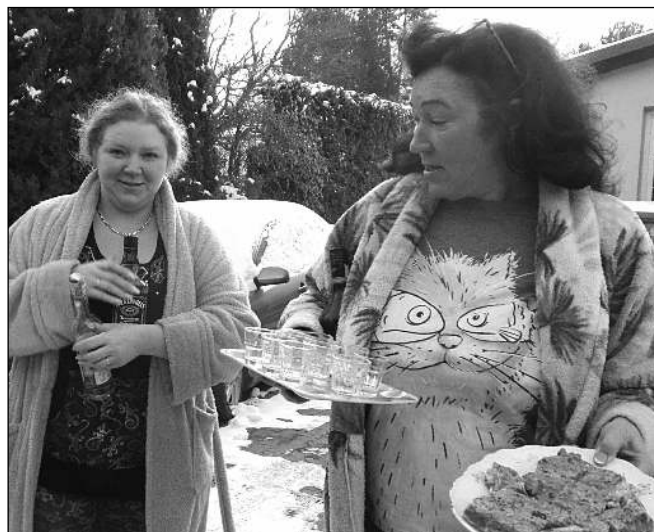
S KOČKOU. A ještě jednou starostka - tentokrát s dcerou a kočkou na triku nabízející občerstvení na zápraží svého domu.