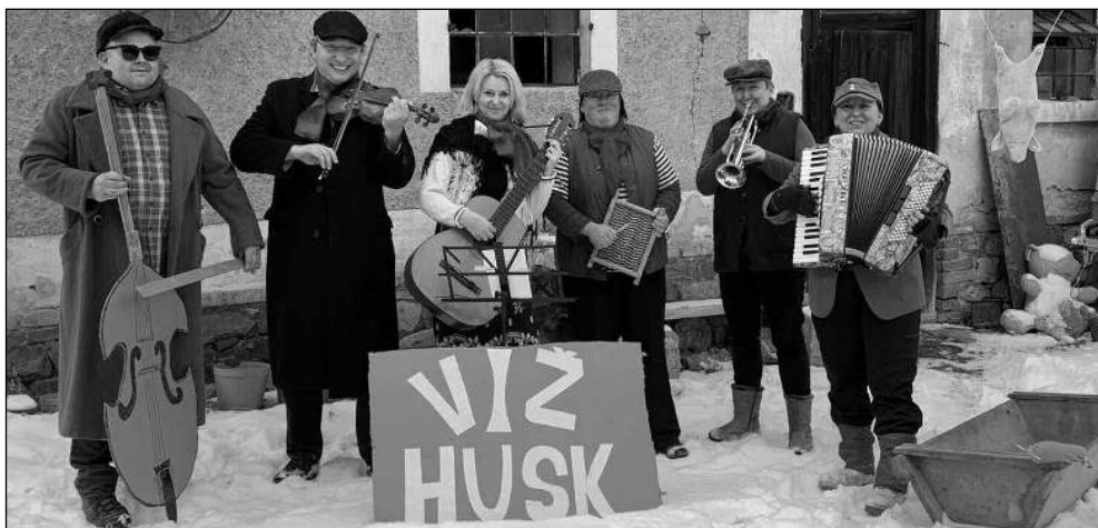
KRÁL MASOPUSTU 2021. Vižinská hudební skupina VIŽHUSK.