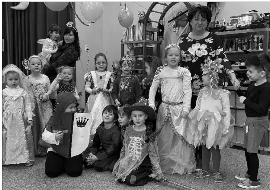
POZDRAV ZE ŠKOLKY. Děti ze všeradické mateřské školy při »bobování« na kopečku uměle vytvořeném na zahradě školky a při společné oslavě masopustu.