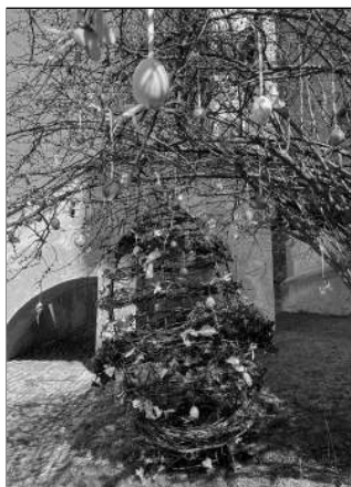
NEJVĚTŠÍ. Velikonoční kraslice na hradě.

NEJVÍCE SE SNAŽILY RODINY PASTORKOVA A ČVANČAROVA