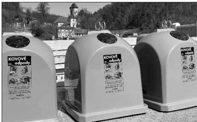
U RADNICE. Kontejnery umístěné u radnice budou brzy přemístěny ke karlštejnskému kempu.