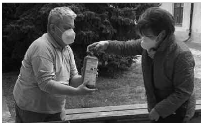
PŘIŠLI JEN TŘI. Jen tři obyvatelé Zadní Třebaně si nechali v polovině dubna bezplatně zkontrolovat hasičské přístroje.

* Požár mysliveckého posedu a kůlny pod ním u lesa v Revnicích likvidovali 9. 4. odpoledne místní profesionální i dobrovolní hasiči. Škoda činí 10 000 Kč. Pavel VINTERA