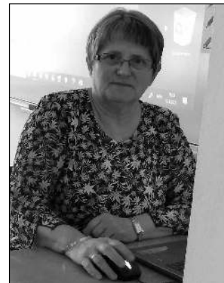
UČITELKA. Světluška ve věvě« ZŠ Daruvar.