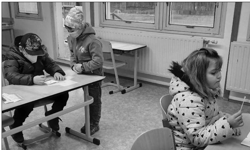
TESTOVÁNÍ. Osovští školáci při povinném testování před začátkem výuky.

Informační občasník Osova a mikroregionu Horymír 4/2021 (192)