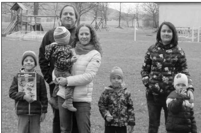
NA CESTĚ ZA POKLADEM. Účastníci venkovní rodinné hry na hřišti v Osově.

Počasí přálo jen střídavě, přesto se hry zúčastnilo na čtyři desítky nadšených dětí. Nadšení byli také jejich rodiče, proto může být spokojený i