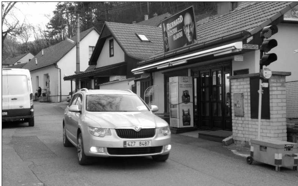
V ULIČCE. Cesta na hrad je uzavřena, auta musí objíždět kolem pošty.

Zprávy z městyse i hradu, historie obce, kultura, sport... 4/2021 (115)