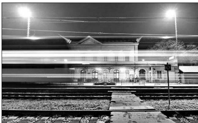
ZVÍTĚZI? Jedna z fotek zaslaných do soutěže.

Je to hlavně výzva pro ty, kteří v době covidu přišli o zájmové aktivity a mají možnost využít čas k cholení do přírody. Jsme rádi, že se do soutěže postupně zapojují i děti. Například pár kamarádů začalo pravidelně vyrazet na kolech po okolí Dobřichovic a zaměřili se na focení zajímavých aut či vlaků. To je přesně cíl soutěže: najít si zájem, zaměření a na tom pracovat. Fotografie by měly být pořizeny v Dobřichovicích, ale přihlásit se samozřejmě může kdokoliv. Soutěží se o zajímavé ceny, vyhrát můžete třeba výrobu vámi zvoleného snímku u firmy Vyrobafo-