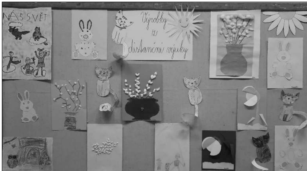
DĚTSKÉ PRÁCE. Výrobky dětí ze všeradické školky, které vznikly během distanční výuky.

* Bioodpad je možné každou sobotu od 9 do 12.00 uložit do kontejneru za budovou OÚ Všeradice. (sov) * Zahájení výstavby dětského hřiště naplánovalo na duben zastupitelstvo Všeradic. Začít také měly práce na rozšíření čistírny odpadních vod a budování květinového záhonu u místního hřbitova. (sov) * Očkování psů se uskuteční 8. 5. od 14.00 za obecním úřadem ve Všeradicích. Cena vakcíny proti vzteklině je 100 Kč, Kombi vakcína vyjde na 300 Kč. (sov) * Neznámý zloděj vnikl 12. 4. mezi 8.10 a 9.00 oknem do rodinného domu v Libomyšli. Z obývacího pokoje a ložnice odcizil peníze, zlatý prstýnek a mobilní telefon. Škoda byla vyčíslena na 5.900 Kč. Případ je prošetřován jako přečin krádeže a přečin porušování domovní svobody a pachatelé hrozí trest odnětí svobody až na dva roky. (min)