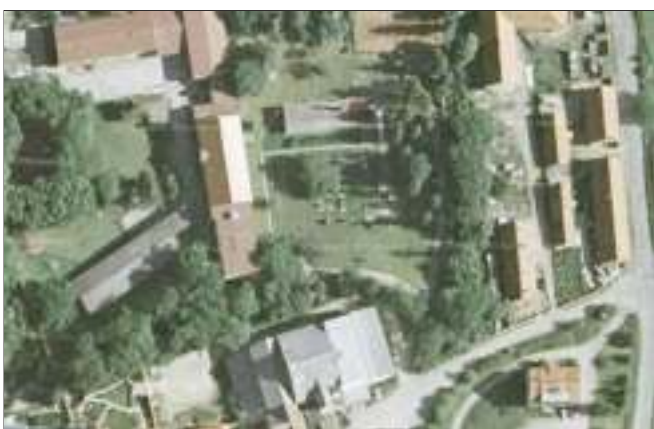
Zahrada školky byla na portále mapy.cz už v roce 2006, přičemž předchozí ortofotomapa byla z roku 2003.