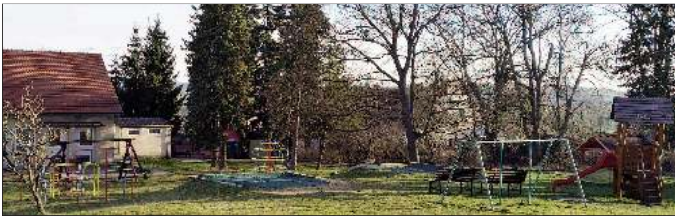
BUDE SE KÁCET? Tuhle část zahrady chce developer oddělit a vykácet. Děti tak přijdou o zahradu a herní prvky.