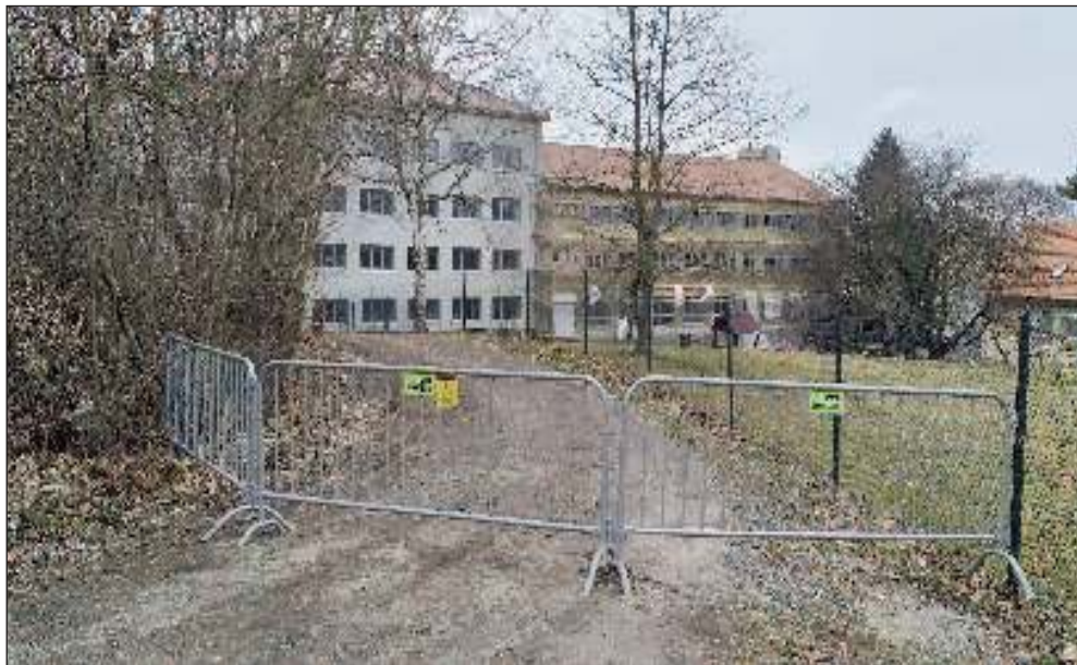
TUDY NECHODTE! První reakcí developera na odpor městyse bylo rozmístění zátarasů na příchodu k liteňské mateřské škole. (Viz: Veřejnou školku chceme zachovat)

Aktuální zprávy z Litně, Leče, Bělče, Vlenců a okolí 5/2021 (119)