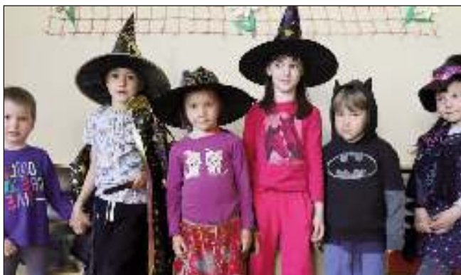
MALÍ ČARODĚJOVÉ. Děti ze zadnotřebské školky na Čarodějnickém odpoledni.

Ve středu 21. 4. odpoledne se za přísných hygienických podmínek konal zápis prvňáčků k základnímu vzdělání. Děti byly rozděleny jednotlivě do tříd, kde s učitelkou vypracovaly test školní zralosti. Uvítali jsme 12