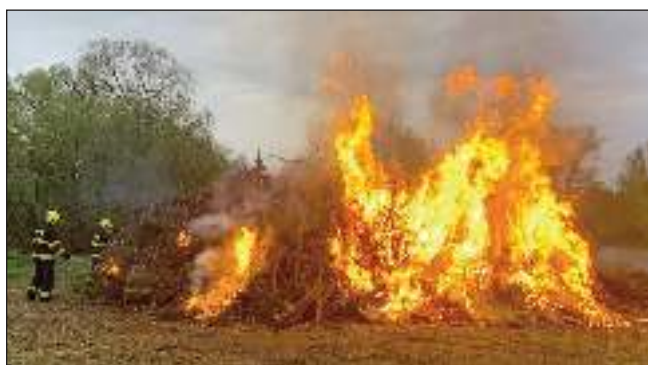
ZAPLÁLÝ OHNĚ. Ačkoli obec Lety oficiálně pálení čarodějnic 30. 4. nepožádala, přesto se oblíbeného rituálu loučení se zimou a upálení všeho špatného na louce u srubu účastnili mali i velcí nejen Letováci. Moc děkuji hasičům, kteří dohlíželi na bezpečnost po celý víkend. Neoficiálně oheň zaplátl i na řevnické Vrážce. Pořadatelé vatru letos nestavěli, pouze spálili lidmi navozené roští a větve.