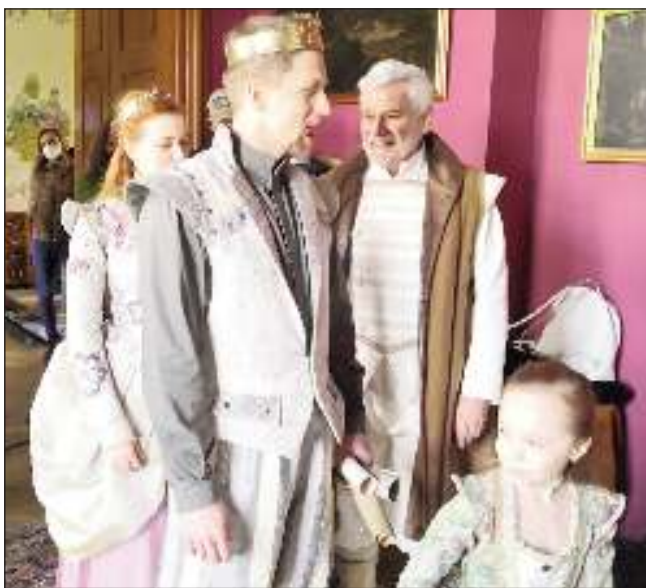
NA PLACE. Herci při natáčení pohádky Tajemství staré bambitky 2 v interiérech mníšického zámku.