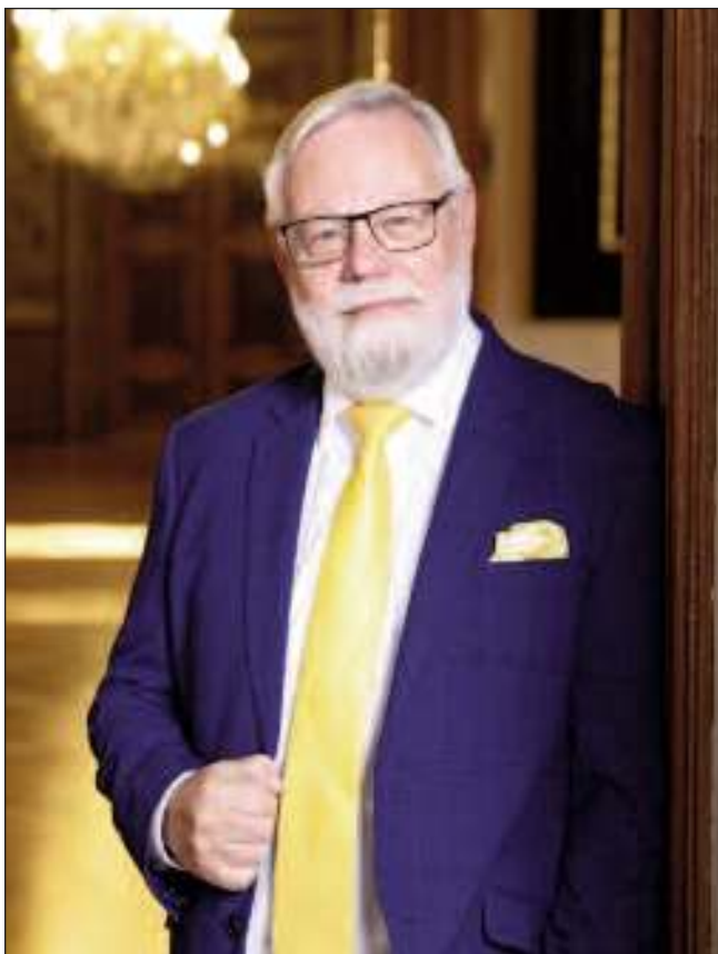
V SENÁTU. Místopředseda Senátu Parlamentu České republiky Jiří Oberfalzer ve Valdštejském paláci.

V Senátu mám odložené asi čtyři akce, jejich termíny už jsou odkládány potřeby. Měli jsme naplánovanou výstavu, třeba výstavu prací žáků