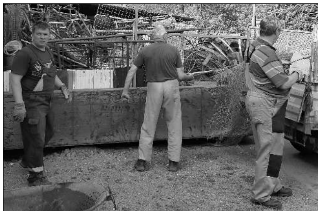
NA BRIGÁDĚ. Karlštejnští hasiči při květnovém sběru železného šrotu.

S příchodem jara přichází každoroční úklid všech domácností a s tím také pravidelný sběr železného šrotu i svoz velkoobjemového a nebezpečného odpadu v naší obci. O svoz kovového odpadu se již tradičně starají karlštejnští hasiči, kteří v den vyhlášeného svozu odvezou od obyvatel obce kromě kovového odpadu i vyřazené elektrospotřebiče. Ty, stejně jako odpad kovový, lze samozřejmě také individuálně během roku