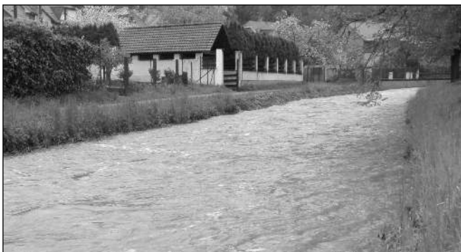
ZŮSTAL V KORYTĚ. Svinářský potok se nakonec v Zadní Třebani z koryta nevytil. Ve čtvrtek 13. května k tomu ale nechybělo mnoho. Odpoledne následujícího dne začala voda pomalu opadávat.