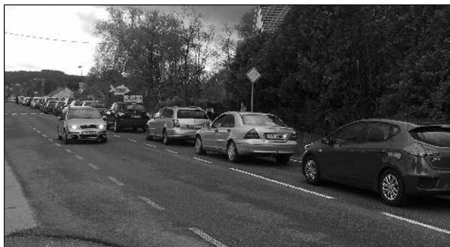
V KOLONĚ. »Objížďka« z Řevnic do Letů musela být kvůli vodě, jež zatopila podjezd pod trať, uzavřena. Kolony aut od řevnického přejezdu dosahovaly až k letovskému kruhovému objezdu.