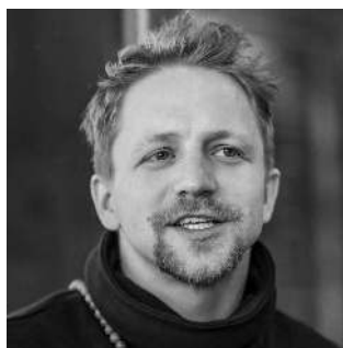
T. Klus.

Mníšek pod Brdy - Pěkně »ostré« album před pár dny vydal jeden z nejpopulárnějších českých zpěváků, obyvatel Mníšku pod Brdy Tomáš KLUS. „Mým cílem je vrátit veřejnosti důvěru ve vlastní moc. Pakliže cítím problém, nesmím mlčet,“ říká v rozhovoru. Vaše nové album se jmenuje ČAU-ČESKU. Hádám, že reklamu facebookovému »čaulidi« Andreje Babiše dělat nemíníte a vyvolávat duchy někdejšího rumunského komunistického dítátora taky ne. Takže, proč - ČAUČESKU? Líbí se mi slovní říčky a tahle je vý-