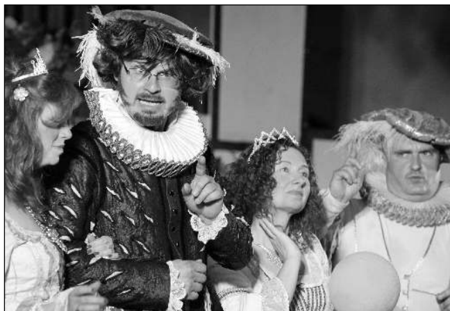
POHÁDKA. Protagonisté pohádky Byl jednou jeden král.