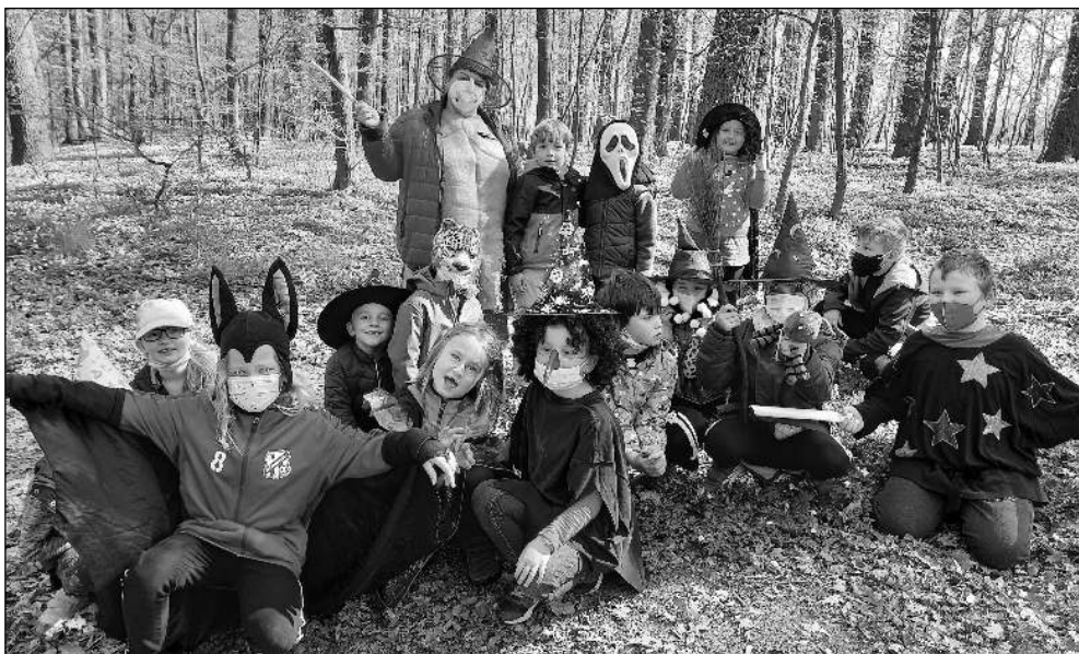
V LESE. Osovští školáci si připomněli čarodějnice, kouzlili a hledali poklad.

Informační občasník Osova a mikroregionu Horymír 5/2021 (193)