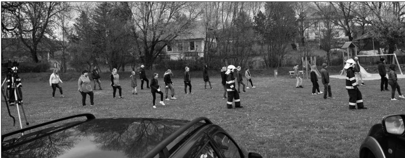
TANEČNÍ NA NÁVSI. Obyvatelé Všeradic při natáčení taneční covid výzvy na místní návsi.