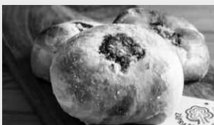
Dvojitěhodné koláče, oceněny regionální potravinou Zápraží.