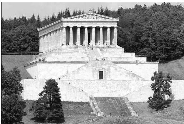
WALLHALA. Památník velkých osobností ve městě Donaustauf u Regensburgu.

je to možné, a zjistili, že Sophie se nikdy nechtěla obětovat pro národ, že nešla vědomě na smrt, že nebyla taková ta hrdinka s praporem v ruce, ale že to byla tichá a odpovědná dívka, která z prvního nadšení pro národní socialismus uzrála v člověka s jasným postojem proti Hitlerovi. Takto až masochistickým způsobem zpracovávají Němci svoji minulost. Je to prostě cesta k pravdě za každou cenu, i za cenu, že se Sophii Scholl pošramotí svatozář. Je to ten přístup, který uplatňoval Tomáš G. Masaryk v případě rukopisů, snažících se zfalšovat českou minulost »k lepšímu«. Pravda za každou cenu. Bydlím ve spolkové zemi, která byla osvobozena Francouzi a také po vál-