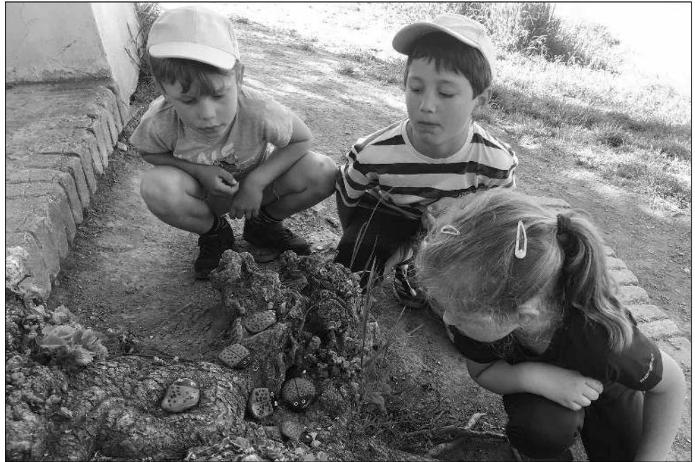
KAMÍNKOVÁNÍ. Děti z karlštejnské školky proměnily kamínky v berušky. (Viz strana 9)