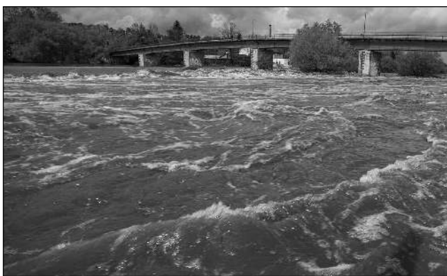
POD LÁVKOU. Vzvednutá hladina Berounky pod řevnickou lávkou v pátek 14. května.

Ale co se nestalo? Po několika málo deštivých dnech je podjezd V Luhu uzavřen, na pozemcích, kde se staví velmi drahé domy je bahno a mokřad. Ale zato budou mít budoucí majitelé zdarma možnost se svést na lodíčkách a možná si i zaplavat. Problém totiž je, že vinou potoka Kejná, který se může kdykoliv při větších srážkách rozvodnit, může hrozit za-