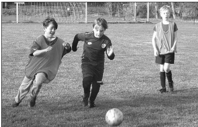
UŽ TRĚNUJÍ. Řevnická fotbalová příprava na jednom z prvních »pocovidových« tréninků.

Delší období bez fotbalu členové oddílu ve spolupráci s mateřskou TJ Sokol Dobřichovice využili k částečné rekonstrukci v provozní budově, a to v kabinách i v přílehlé restauraci. Změny v kádru A-mužstva zřejmě nenastanou. Posily momentálně nesháníme, nikdo totiž neví, co se bude dále dít. Kdy se opravdu začne hrát a za jakých podmínek. Nebo