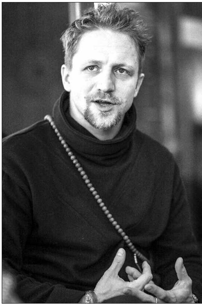
NESMÍME MLČET! „Demokracii musíme denně opatrovat, pracovat na ní,“ říká Tomáš Klus.

Jako písničkář zprostředkovávám především emoce, ale doba tak překypující informacemi a dezinformacemi, doba, kdy je pravda všchno, čili nic, nejasná doba, ta potřebuje jas vysvětlení a tím jsou fakta, data a důkazy. Jejich sbíráním a dokumentací se Jarda kontinuálně zabývá dě-