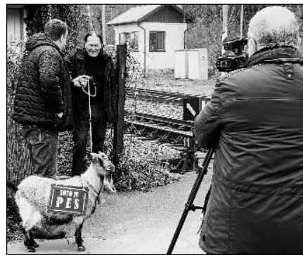
Záběr z natáčení spotu.