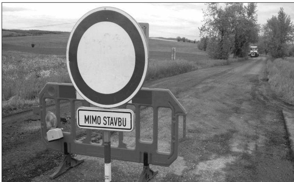
OPRAVENO. Mimo provoz byla ve druhé polovině května frekventovaná silnice mezi Litní a Zadní Třebaní. Poté, co dostala nový povrch, se na ni mohla zase vrátit auta.

Aktuální zprávy z Litně, Leče, Bělče, Vlenců a okolí 6/2021 (120)