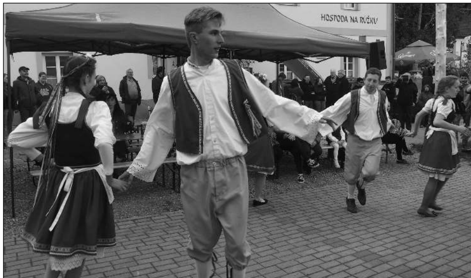
CHASA V KOLE. Všeradická chasa tančila na Staročeských májích českou besedu.