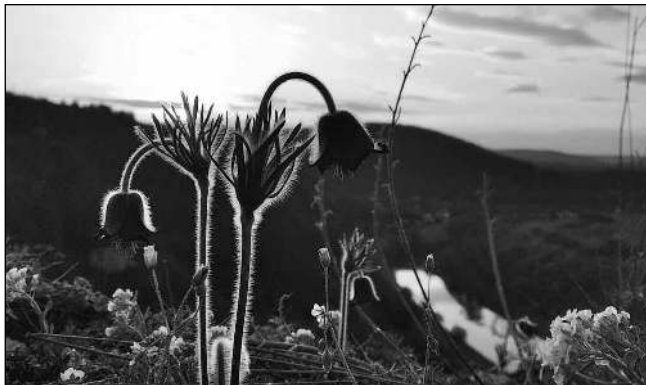
KONIKLEC. Fotografie, která v soutěži Ekotýmu ZŠ Řevnice zvítězila v žákovské kategorii.