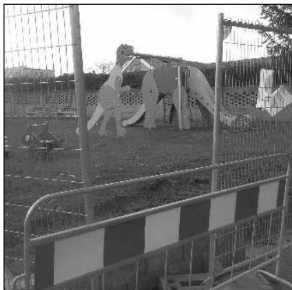
KVŮLI HRÍŠTI. Jedno z trestních oznámení se týkalo dětského hřiště před kinem, vysvětlují liteňští zastupitelé J. Nolčovi.

Co se týká Vašeho vykonstruovaného obvinění z finanční úplaty pana Havelky - po rezignaci pi-