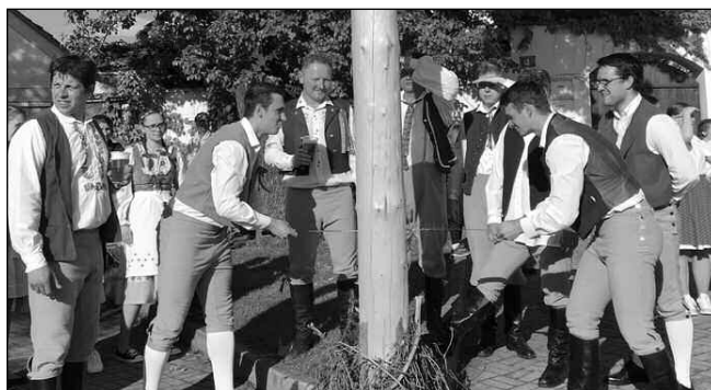
Hlásnotřebaňští »chasníci« při kácení máje.