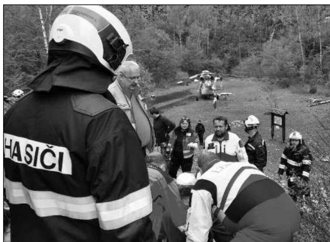
ZÁSAH V LOMU. Hasiči a zdravotníci při záchranné akci v bývalém lomu Kobyla.

Veškeré elektro si vyzvedne Elektrowin, který se zabývá jejich recyklací a sbor za to obdrží finanční odměnu. Letos hasiči například zakoupili starší kontejner na Avii, plánují dovybavit zázemní v hasičárně a pořídit defibrilátor AED, který by měla v užívání jednotka SDH Liteň. Té by v případě potřeby mohl KOPIS vyhlásit poplach, pokud by došlo v okolí například k úrazu, nebo srdeční příhodě a bylo potřeba co nejdříve poskytnout první pomoc, než by na místo přijela posádka zdravotnické záchranné služby s profesionálním vybavením. Na financování by se podíl měly Liteň, SDH a JSDH Liteň.