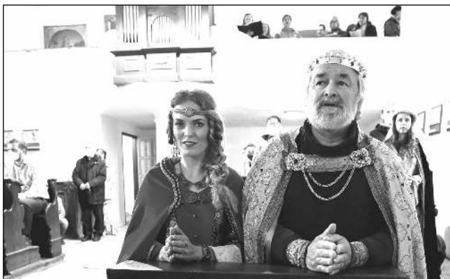
CÍSAŘ V KARLŠTEJNĚ. Noci kostelů v karlstějnském kostelíku sv. Palmácia se zúčastnil císař Karel IV. s chotí Eliškou.