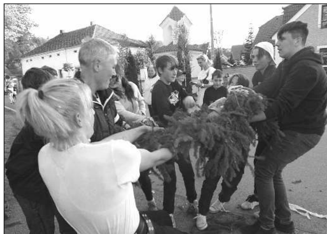
LÍTÝ BOJ. Tahanice o »kytku« a fábrory ze špičky poražené máje byla letos v Zadní Třebani obzvláště dlouhá a nesmlouvavá.