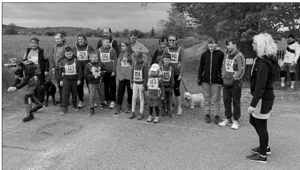
NA STARTU. Účastníci vižinského Běhu pro paměť národa.