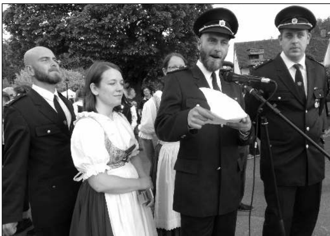
VÁŽENÁ RYCHTÁŘKO TŘEBAŇSKÁ! Mladí zadnotřebaňští hasiči při žádání starostky o udělení práva k pořádání májů.