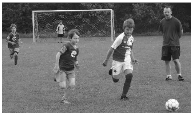
SMÁZLI »SLÁVII«. Třicet branek nasázela (osm dostala) v prvním přátelském zápase po skončení uzávěry řevnické fotbalová příprava vrstevníkem ze Všeradic. Ti nastoupili v dresech pražské Slavie.

Jsmo rádi, že jsme opět mohli začít alespoň trénovat. Pravidla přátelských utkání se neustále měnila, tak jsme vyčkávali. Trenéři jsou ale při-