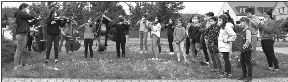
PRVNÍ ZKOUŠKA. Notičky na první zkoušce, která se po zrušení karantény konala 22. května před řevnickým Zámečkem.

S nápadem natočit společné streamové video přišla moje dcera Kristýnka, která se s přítelem Ondrou Štarhou ujala zpracování, střihání, mixu i zvuku. Nejdříve natočily Notičky píseň Rybníček, poté jsme pustili do světa koledu Fum, fum. Primáška Magda obstarala základ, na který pak děti natočily doma na mobily svoje party či tančily. Před Vánoci jsme natočili video vánočních koled. Bylo to náročné, děti směly být pouze po deseti - jedna část muzikantů natáčela s primáškou Magdou, další část s druhou primáškou