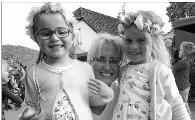
NA NÁVSI. Malé tanečnice se starostkou Letů.

V sobotu 29. května jsme v Letech díky kapelám 4Kafky, After 40, Orkus a hlavně Voší hnízdo zažili restart kulturního a společenského života. Měli jsme možnost užívat si jej celé odpoledne a večer především v rytmu rockové hudby. Společně s Letováký tento zážitek vychutnalo mnoho Dobřichovičáků i sousedů z Řevnice a dalších obcí v okolí. Dle ohlasu stánkařů, kteří nestačili dodávat občerstvení pro všechny přichozí, se diváků během odpoledne a večera protočilo kolem tisíce. Májku porazili letovští hasiči kolem osmé hodiny večer za velkého ohla-