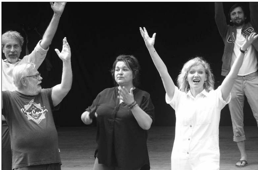
NA ZKOUŠCE. Aňa Geislerová s dobřichovickými a řevnickými ochotníky při zkoušení pohádky Byl jednou jeden král . Po její pravici režisérka představení Lucie Kukulová.

divadle mě baví kontakt s živým publikem. Baví mě právě ty improvizace, ta akutní nutnost něco stvořit. Zkoušky jsou zkoušky, ale kouzlo se stejně vždycky stane, až když dorazí diváci. Pak do toho teprve vstoupí ten neznámý element a začne to být zajímavé. Čili trému mít nebudu, těším se.