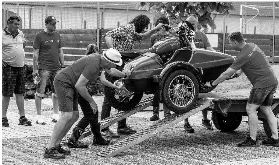
ŠUP S NÍM DOLŮ. Jeden z exponátů, které se zúčastnily motosrazu ve Všeradicích.

* Závěrečné účty a účetní závěrky obce, školky a mikroregionu Horymír budou na programu veřejného zasedání Obecního úřadu Svinaře, které se koná 18. června od 18.00 v Klubu U Emy ve Lhotce. (sos) * Minigolfové hřiště i Galerie a muzeum Magdaleny Dobromily Rettigové ve Dvoře Všerad Všeradice je otevřeno od pátku do neděle 11 - 19.00. (bos) * Očkování proti Covid-19 s vystavením certifikátu nabízí v Hostomicích MUDr. Jaroslava Jiráková. Objednat se můžete na tel. číslo 311 584 416. (smh) * Bioodpad je možné každou sobotu od 9 do 12.00 uložit do kontejneru za budovou OÚ Všeradice. (sov) * Přísný zákaz napouštění bazénů platí ve Všeradicích. Zájemci o dovoz vody se mohou obrátit na VAK Králův Dvůr, tel.: 602 211 445. (sov) * Osmdesát stromků - třešní, hrušní, jabloní, švestek a jeřábů - bylo vysazeno v Podbrdech. Projekt byl hrazen z dotací Státního fondu životního prostředí. (sop)