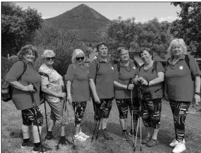
V ČESKÉM STŘEDOHOŘÍ. Hlásnotřebeňské Holky v rozpuce na jednom ze svých výletů, pod kopcem Lovoš.

HLÁSNOTŘEBAŇSKÉ HOLKY V ROZPUKU SE VYPRAVILY DO ČESKÉHO STŘEDOHOŘÍ I K SÁZAVĚ