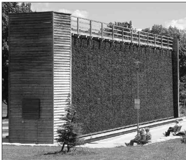
U ZDI. Solné kapénky, jež vyrábí »zeď« z nalisovaných větviček, mají blahodárný účinek na lidi s astmatem.