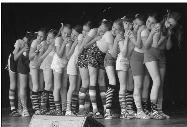
MÍŠ MAŠ 2021. Jedno z vystoupení na Mix festivalu ZUŠ Řevnice v místním Lesním divadle.

Pak už se publikum mohlo nechat unášet výkony dětí - tancem, zpěvem i vtipnými básničkami a příběhy dětí z dramatického oddělení. Program se z odpoledne protáhl do