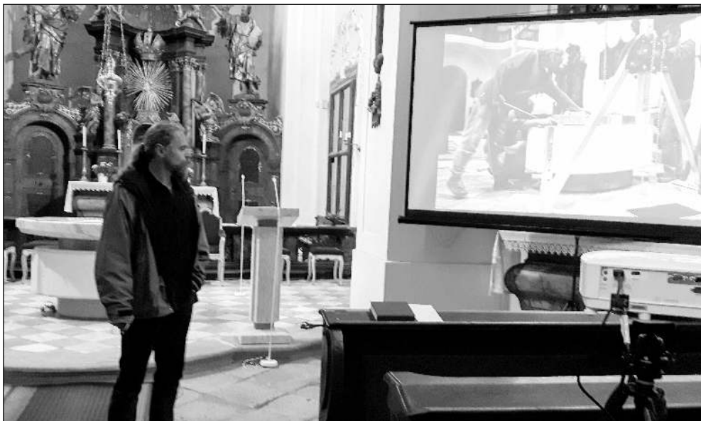
NOC KOSTELŮ. Návštěvníci viděli obrázky instalace nového oltáře.

Informační občasník Osova a mikroregionu Horymír 6/2021 (194)