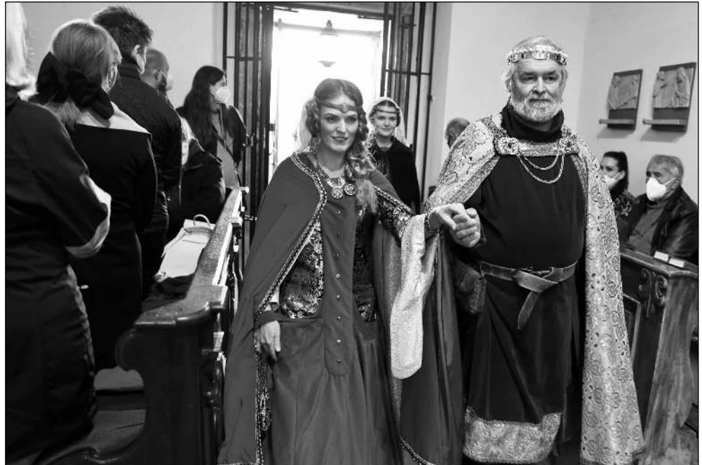
CÍSAŘ V KOSTELE. Karlštejnské Noci kostelů se zúčastnil císař Karel IV. (Viz strana 8)

* Každodenní aktualizaci vývoje nemoci Covid-19 v Karlštejně najdete na adrese mestyskarlstejn.mobilnirozhlas.cz/covid-report . Bezplatná informační linka ke koronaviru 1221 je k dispozici v pracovních dnech od 8 do 19.00 o víkendech od 9 do 16.30. (smk)