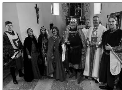
PŘED OLTÁŘEM. Císař se svým doprovodem v kostele sv. Palmácia.