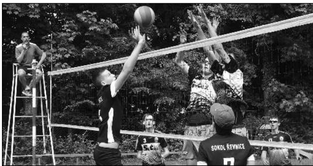
TURNAJ KADETŮ. Krajský turnaj volejbalových kadetů hostily 5. června Řevnice. Vítězem se stalo družstvo VK Příbram, které 2:0 porazilo domácí (na snímku) i Sokol Králův Dvůr. Z výhry 2:0 nad »Královákem« se mohli radovat také hráči Řevnic. O týden později se v Řevnicích konal turnaj juniorů. Ovládli ho volejbalisté Benátek nad Jizerou před Nymburkem a domácími borci. Poslední skončil bez bodu Komárov.

Zadnotřeboňský Ostrován hraje ve skupině A s Hostomicemi, Všeradicemi a Osovem. Po dvou zápasech má vyrovnanou bilanci - nejprve na hřišti Všeradic prohrál 0:2, následně ve stejném poměru zvítězil v Hostomicích. Po závěrečném utkání se odehrají zápasy o umístění s družstvy ze skupiny B (Tetín, Hudlice, Výsoký Újezd). (Mák)