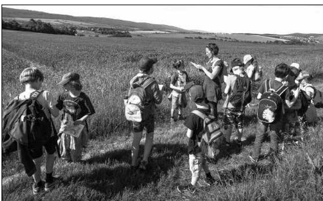
SMĚR BĚLEČ. Zadnotřebská školáci na cestě k bělečské farmě Homolka.

V pátek 4. června se tak vydali žáci 2. a 3. ročníku na poznávací vycházku do Bělé na zdejší farmu Homolka. Každý dostal ve škole svou mapu okolí, naučili jsme se topografické značky a snažili se orientovat, kde se právě nacházíme. Za krásného slunečného počasí jsme za necelou hodinku dorazili do Bělé, kde jsme si pohladili čerstvě narozená telátka a zakoupili sýrové dobroty z místní výroby. Cestou domů jsme si ve Vatinách udělali piknik a smočili no-