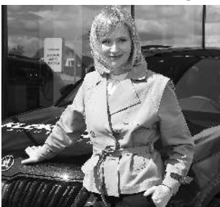
Herečka Aňa Geislerová.