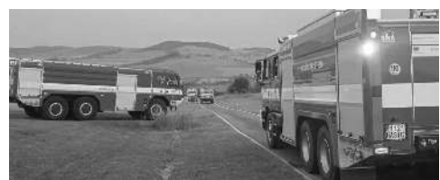
HOŘELO TRAFU. Hasičské vozy při zásahu na golfovém hřišti.

cen na levém břehu pod mostem při vědomí a předán záchrance. Josef ČVANČARA, velitel JSDH Karlštejn