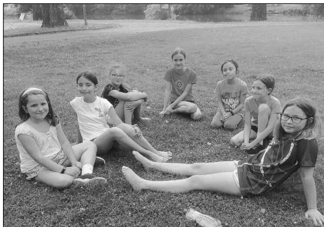
V KEMPUPU. Účastnice sportovního dne karlštejnské školy, který se v místním kempu konal předposlední den školního roku.

V následujícím týdnu se žáci 1. a 2. ročníku zúčastnili představení sokolníka a jeho práce s dravými ptáky na zahradě školky. Děti byly opravdu nadšené, program se jim velice líbil. Předposlední den školního roku pro-