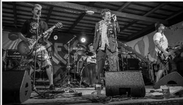
Večer plný hudby si užili všichni, co se vydali v pátek 25. 6. večer do Svinář. V areálu místního Sokola to na plný pecky rozjela nejprve latinskoameričtí Lozt Mezzal z Mexika City, které poté vystřídala kapela Plexis. V jejím více než hodinovém vystoupení zazněly i písně z alba Půlnoční rebel včetně skladby Svět jsou bary. Všichni se výborně bavili, pivo teklo proudem a drinky se nestačily michtat. O tom, že Punk's Not Dead, není pochyb! Text a foto Lucie BOXANOVÁ, Svináře