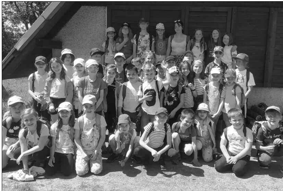
NA VÝLETĚ. Karlštejnští školáci na výletě v závěru školního roku. (Viz strana 8)