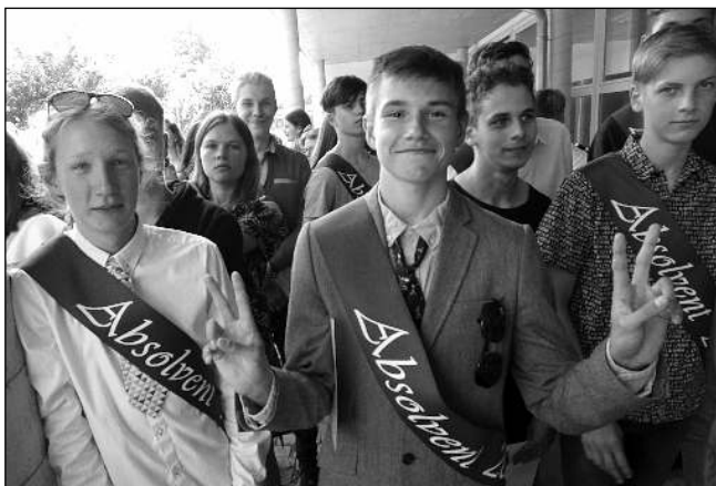
ABSOLVENTI. Část letošních řevnických devátáků při šerpování a loučení se základní školou.

Vzpomíná se na uplynulých devět let, připomínají se učitelé, jejichž trpělivými rukama všichni prošli, v proslovch se děkuje rodičům i kamarádům. Třídní učitelky předávají žákům šerpy a pamětní listy se známkou vzdělané sovy, opačným směrem se darují voňavé kytice lilii, gerber i růží. Na závěr slavnosti si