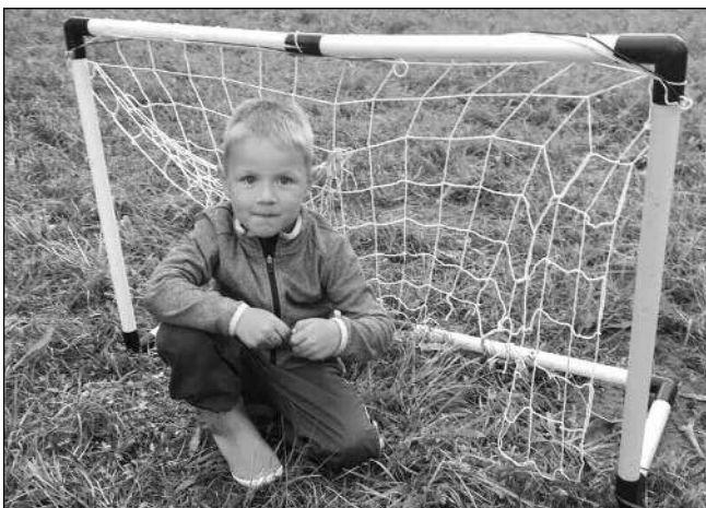
BRANKÁŘ. Jeden z malých účastníků Vítání léta, které se v Hlásné Třebani konalo v pátek 2. července.

Splování Berounky tradičními i ne-tradičními plavidly se mělo v Hlásné Třebani konat poslední červnovou sobotu. Akce byla bezvadně naplánovaná i připravená, dokonce se přihlásil i větší počet plavidel, než loni. Moc jsme se těšili - součástí programu byly dětské vodní hry, soutěže, vyhlášení neoriginálnějšího plavidla i kostýmu, na jednom z vorů měla plout kapela. Vše připravit dalo obrovskou práci, která - bohužel - přišla vniveč. Počasí se zbláznilo, přišlo a přišlo, hladina Berounky se začala pěkně zvedat. Vše se hlídalo a vedly se nekonečné debaty, zda plavbu uskutečnit, nebo ne. Nakonec se organizátoři rozhodli, že by to bylo fakt nebezpečné a akci zrušili. Škoda, těšili jsme se opravdu hodně. Další termín splování je předběžně stanoven na 28. 8. Včas bude zveřejněno, zda platí. Snad vše vyjde. Na první červencový pátek připraví-