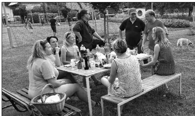
NA PLÁCKU. Na Malém náměstí v Řevnicích se dá nejen sportovat - místo slouží také k setkáním a piknikům.

Malé náměstí v Řevnicích mimo odpočinku u ohniště nabízí i plochu na fotbal. Nově je možné zahrát si nohejbal, volejbal či přehazovanou. „Jsme velice rádi, že můžeme nabídnout sporty i ne-fotbalově zaměřeným dětem i dospělým. Je to vlastně návrat k myšlence nabídnout na