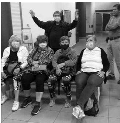
A ČEKÁME. Holky v rozpuku na cestě směr Náměšť nad Oslavou.

Spoj z Jihlavy nám samozřejmě ujel, do Třebíče jsme dojeli s asi devadesátiminutovým zpožděním. Tady, pozor, změna: vlaky nejezdí! »Náhradní« autobus měl zpoždění, takže do cíle jsme dojeli už s dvouhodinovou »sekerou«. Cesta na zámek trvá asi hodku. Jenže: rezervace byla zrušena, tudíž jsme se do zámku už nedostali. Tak jsme si ho aspoň vyfotili a pokračovali do restaurace. „Vaše rezervace už neplatí,“ sdělil nám personál. „Jestli se chcete najíst, musíte čekat asi hodinu.“ Měli jsme všichni obrovský hlad, tak jsme souhlasili. Z toho ovšem vyplynulo, že zpáteční