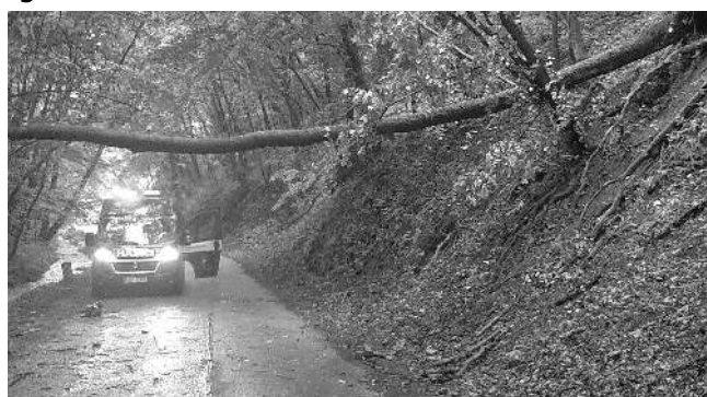
V červnu karlštejnští hasiči mimo jiné odstraňovali několik popadných stromů, které ohrožovaly provoz na silnicích.

Dva dny nato byl jednotce v brzkých ranních hodinách vyhlášen krajským operačním střediskem poplach - na golfovém hřišti v Bělči hořela trafostanice. Na místo požáru dorazila jednotka profesionálních hasičů z Revnic i dobrovolné sbory z Litně a Karlštejna s velkoobjemovými cisternami. S těmi se bohužel po úzkých golfových cestičkách nelze pohybovat beze škody. (Dokončení na straně 8) (pep)