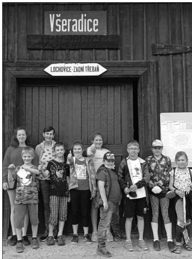
NA VÝLETĚ. Mladí osovští hasiči ve Vseradicích.

Hned zpočátku studia na medicíně jsem se chtěla stát součástí některé ze studentských spolků. Zaujali mě Medici na ulici, kteří sdružují budoucí zdravotníky se zájmem poskytovat péči lidem v nouzi, tak jsem se přihlásila do pražské buňky. Naši členové několikrát týdně chodí na domluvená místa ošetřovat bezdomovce, kteří to potřebují. Pro mě je to skvělá zkušenost, která mi změnila pohled na zdravotnictví i na lidi bez domova. Aspoň na chvíli se ocitám ve společnosti lidí, kteří mezi sebe jen tak někoho nepustí a můžu se toho od nich spoustu naučit o životě. Myslím, že je to dobré hlavně pro mladé zdravotníky či studenty, kteří mají často zkrácenou představu o realitě. Já jsem se naučila lépe komunikovat a vycházet s lidmi z různých sociálních vrstev. Dokonce se mi podařilo být součástí pořadu Nedej se! , který s Mediky na ulici natočila Česká televize. Pokud se chcete dozvědět více nebo přispět na činnost, neváhejte a obraťte se na vedení našeho spolku, jako jsem to udělala loni já. Rozhodně nelituji. Pavlaína ČABOUNOVÁ, Osov