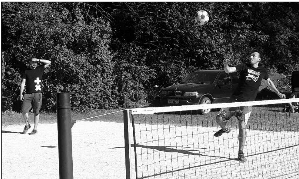
MEMORIÁL. Nohejbalový turnaj se konal poslední červencovou sobotou v Osovi.

Informační občasník Osova a mikroregionu Horymír 8/2021 (196)