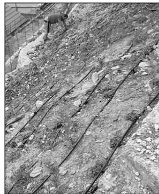
Jeden z vinařů při výsadbě nové vinice.