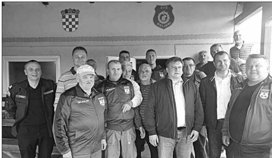
V DOLANECH. Hasiči z chorvatské obce Dolany, v níž žijí čeští krajané.

„Pražan za volantem vozu značky Volvo při jízdě Radouší směrem na Lochovice při projíždění zatáčky nepřízpůsobil rychlost stavu vozovky a nezvládl řízení,“ uvedla policejní mluvčí Jana Šteinerová. „Auto přední částí narazilo do oplocení domu a skončilo na zahradě, kde poškodilo plechovou popelnici i zahradní světlo,“ dodala. Policisté řidiči naměřili 2,95 promile alkoholu v dechu. „Po prvotním šetření nehody policisté berounského dopravního inspektorátu zadrželi muže řidičský průkaz a vyzvali ho k lékařskému vyšetření s odběrem biologického materiálu, kterému se dobrovolně podrobil v hořovické nemocnici,“ sdělila Šteinerová s tím, že hříšníkovi za ohrožení pod vlivem návykové látky hrozí tři roky za mřížemi. (mif)