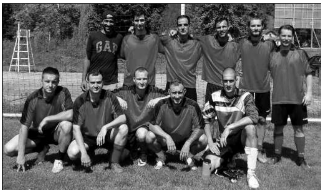
NA TURNAJI. Fotbalisté Karlštejna se v rámci přípravy dvakrát zúčastnili domácího turnaje v malé kopané.

Divadelně zpracované prohlídky Císař není doma, myši mají pré!, během nichž se dozvíte, co se asi tak mohlo dít na hradě, když vladař Karel IV. nebyl zrovna přítomen, se na Karlštejně konají 27. a 28. srpna, každých 30 minut mezi 19. a 22. hodinou. Petra FRYDLOVÁ, Zadí Třebáň