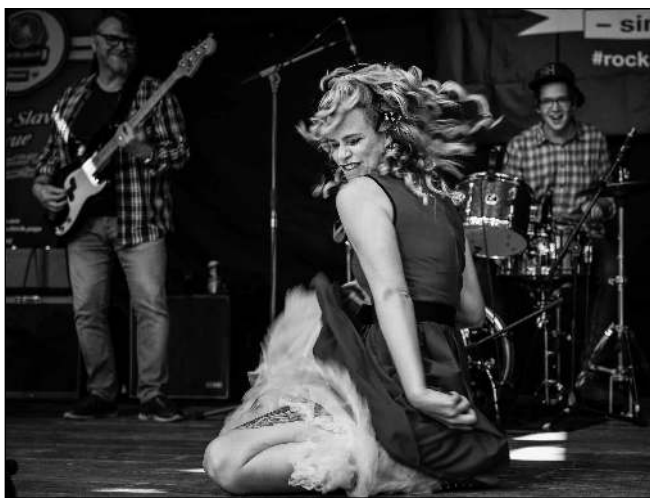
Divoký tanec na podiu v doprovodu kapely Charlie Slavik.

Trináctý ročník se 31. července uskutečnil hladce, osm českých kapel udrželo vysokou hudební úroveň nastavenou předchozími ročníky. O úvod se postaral St. Johnny, následoval