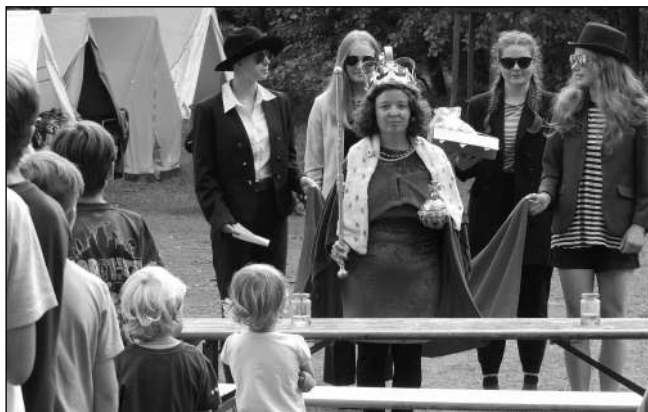
TÁBOROVÁ HRA. Za nalezení zcizených korunovačních klenotů přijela skautům poděkovat samotná britská královna.

V sobotu přijely děti z mladších oddílů (vlčata a světlušky) a na obou loukách začal na dva týdny běžný táborový program. S tím byla zahájena také táborová hra, sportovní aktivity, tajné zkoušky, služby v kuchyni, bodování úklidu, hlídky, čajovny a také večerní táboráky i noční hry. Tématem letošní celotáborové hry byli