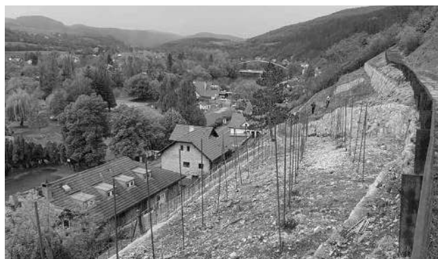
Obnovená historická vinice nad stanicí.

Vína z podhradí měla v Hradci silnou konkurenci. (Dokončení na str. 8)