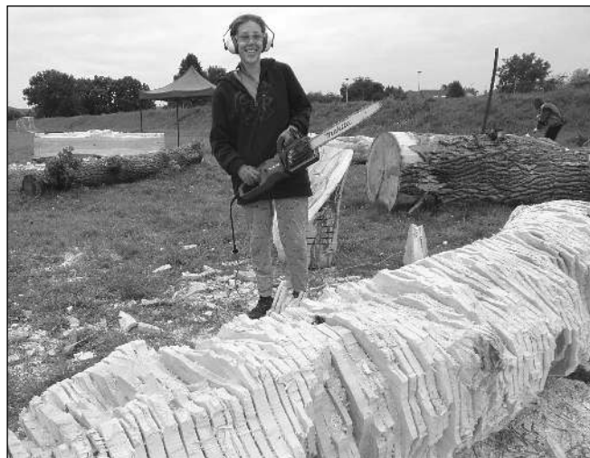
... a při práci na něm.