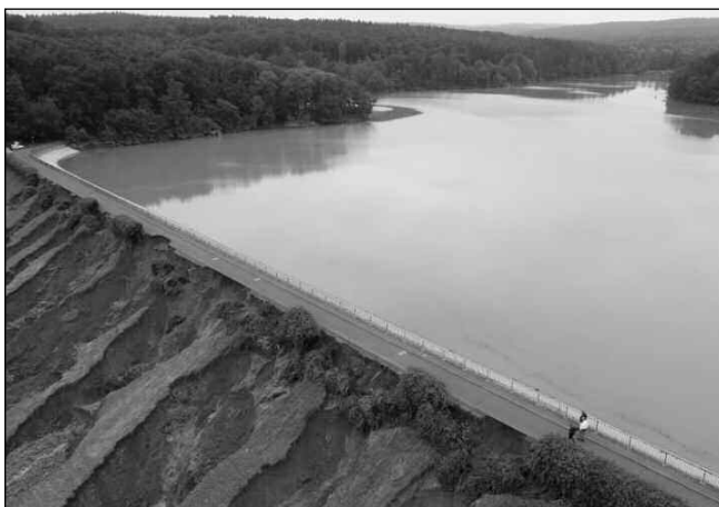
VYDRŽELA. Hráz přehrady Steinbach v Severním Porýní-Vestfálsku málem nevydržela obrovský nápor vody a prorhla se.

Když katastrofa vrcholila, stal se tento příběh: Přehrada Steinbach v Severním Porýní-Vestfálsku nedaleko města Euskirchen se naplnila po okraj; zdálo se neodvratitelné, že hráz tlak vody neudrží a povolí. Po břehu pobíhali hasiči i lidé z technické pomoci a snažili se vymyslet řešení. Hráz ale zpevnit nešlo. Části se ulamovaly a i když se voda odčerpávala, přehradě se neulevilo, protože hlavní odtokový kanál ucpala hlína a kamení. Odpovědní úředníci nařídili evakuaci lidí v obcích a městech pod přehradou. Čas se vlekl, v noci nikdo moc nespal hrůzou, že hráz nevydrží. Lidé, kteří opustili domovy, trávili noc v evakuačních centrech ve školách a tělocvičnách a měli hrůzu