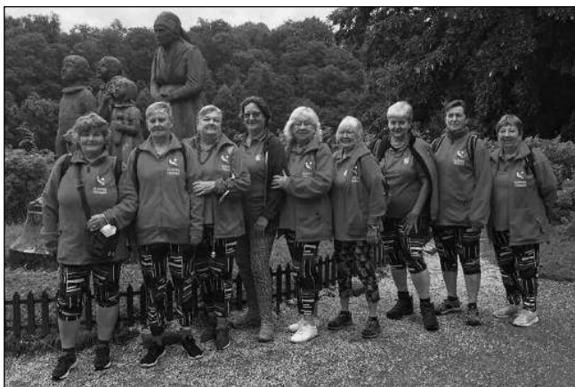
V BABIČČINĚ ÚDOLÍ. Holky v rozpuku u sousoší Otto Gutfreunda a Pavla Janáka Babička s dětmi.

Pokračovali jsme dále směr zámek Ratibořice, který je Národní kulturní památkou. Proslul jako sídlo kněžny Kateřiny Vilemíny Zaháňské a předčil naše očekávání. Překrásné interiéry - vstupní hala, dámské pokoje, hu-