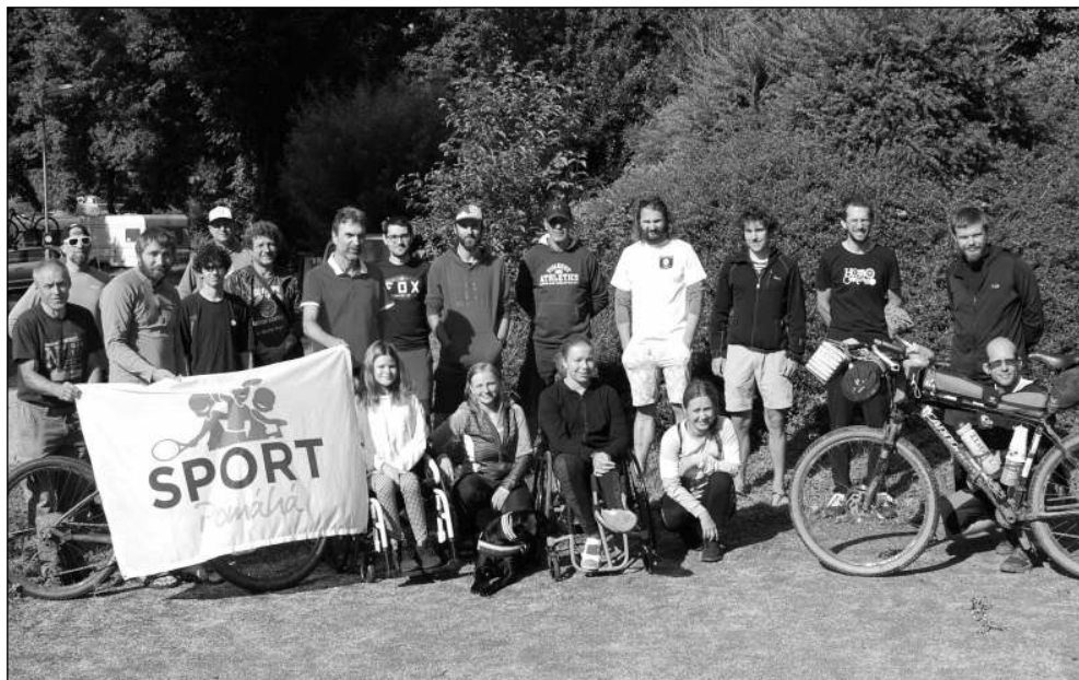
OKOLO MĚSÍCE. Charitativní akce Okolo Měsíce, jejímž smyslem bylo podpořit dvě hendikepované dívky, se první srpnový víkend zúčastnila padesátka extrémních cyklistů. Nelehká trať a bouřky daly účastníkům pořádně zabrat. Start, cíl i zázemí byly v karlštejnském kempu.