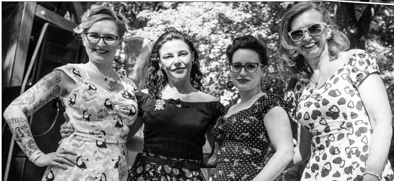
RETRO V LESNÁKU. Festival Rockabilly CZ Rumble se konal poslední červencovou sobotu v řevnickém Lesním divadle. (Viz str. 4)