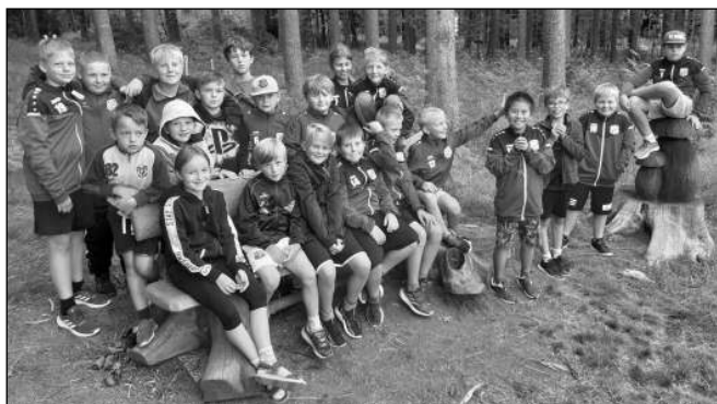
NA SOUSTŘEDĚNÍ. Mladí všeradicckí fotbalisté na srpnovém soustředění v Krušných horách.