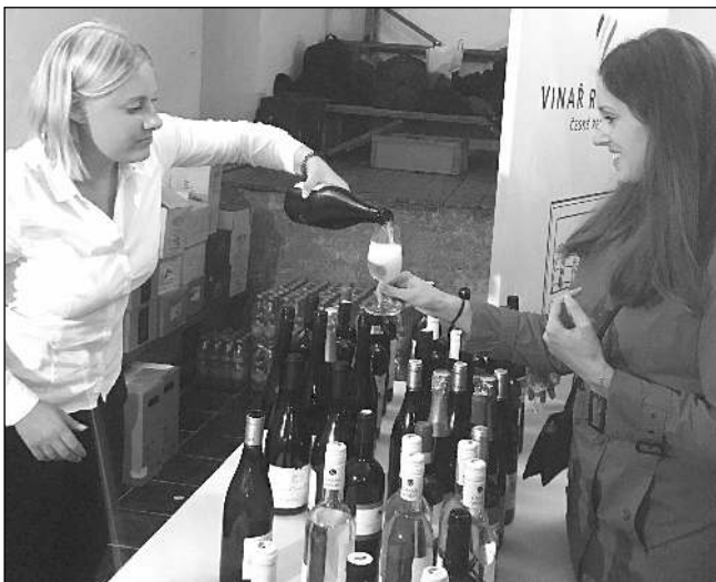
Vinařským slavnostem předcházela páteční společenský večer spojený s ochutnávkou vin ze soutěže Vinař roku 2021.