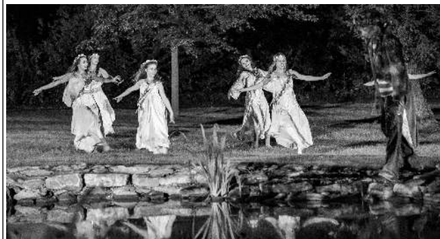
Koncertním provedením nejznámější opery Antonína Dvořáka vyvrcholily 28. 8. večer oslavy jubilejního 10. ročníku Festivalu Jarmily Novotné. V zámeckém parku v Litni se před vypradaným hledištěm uskutečnilo představení pod širým nebem s názvem Rusalka v parku. Před 10 lety byla rovněž založena nezisková organizace Zámek Liteň, jež festival pořádá. Koncert byl pojat i jako pocta opeře Rusalka, jež byla poprvé uvedena před 120 lety. Foto Jan ŽIROVNICKÝ Barbora DUŠKOVÁ, Zámek Liteň