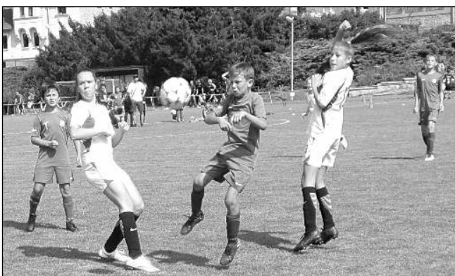
Žáci AFK Podolí v zápase s dívkami Sparty Praha.