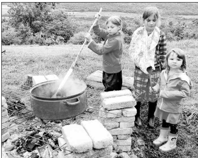
U OHNIŠTĚ. Děti ze Dvora Sofie při vaření povidel.

* Mimořádné večerní prohlídky hradních kaplí nabízí 10. a 17. 9. od 18.00 hrad Karlštejn. Vstupenky je možné koupit pouze v předprodeji, nebo on-line. (shk)