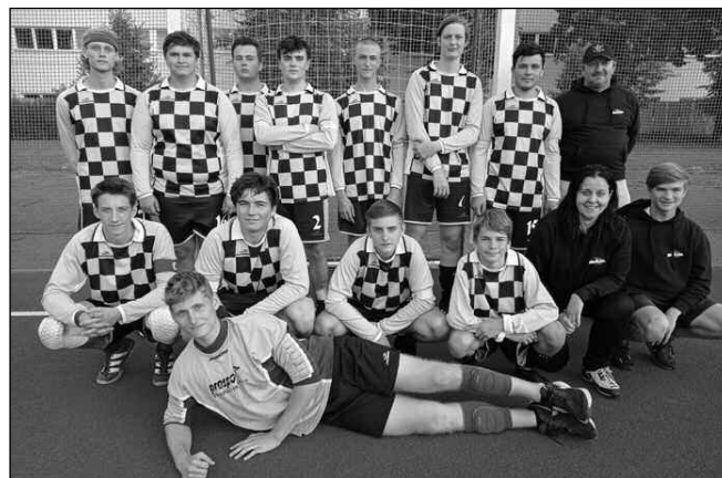
STŘÍBRNÍ. Řevničtí dorostenci na Poháru ČR.

Naše noviny - XXXII. ročník nezávislého poberounského občasníku.