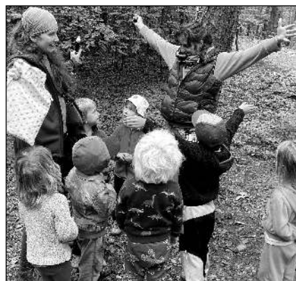
V LESE. Do lesa se děti vydaly za Budulínkem, za pohádkou.

Dalším v pořadí byl Opravdový tábor s přespáváním, který se inspiroval letošními Olympijskými hrami. Děti se setkávaly s Bohy a plnily jejich