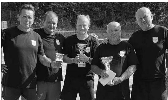
POHÁR PRO OSTROV. Nohejbalový turnaj trojic přivítal 4. 9. na Řitce osm týmů. Po bojích ve dvou čtyřčlenných skupinách následně triumfovalo družstvo Ostrov složené z hráčů, kteří se schází ve stejnojmenném zadnotřebeňském kempu. Druhý tým Třebeň skončil čtvrtý.

FK LETY, krajská I. B třída FK Lety - Tatra Sedlčany B 3:3 Branky: Hřebeček, Král, Veselý Od prvních minut měli domácí převahu. Po mnoha šancích se dočkali ve 25. minutě: centr zpracoval Chalupa, přihrál Hřebečkovi, který uklidil míč do sítě. Těsně před přestávkou se uvolnil v pokutovém území Král a přízemní střelou zvýšil na 2:0. Druhý poločas se hrál pod taktickou hostů, kteří mezi 54. a 58. minutou využili chyb v obraně a vyrovnali. Domácí se znovu ujali vedení v 63. minutě - rohový kop prodloužil hlavou Chalupa na volného Veselého, který dorazil míč do sítě. Poté spálili domácí další dvě příležitosti a přišel trest - hráč hostů oběhl tři Letovské a vyrovnal. Jiří KÁRNÍK SK Černolice - Lety 3:1 Branka: Hřebeček Z vítězství v derby se radovali do-