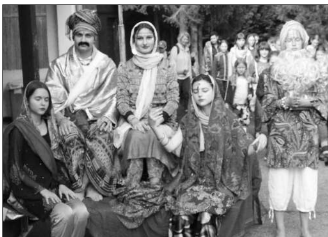
VINDII. Řevnická zuška na táboře v Běstvinách.

Tábor se tradičně věnuje filmu, výtvarné tvorbě, divadlu a letos jsme po pár leté přestávce oprávnili i tanec, který se těšil velké popularitě. Do soustředění, tj. odborných činností