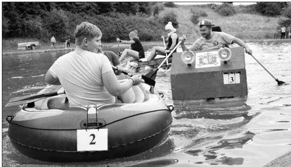
NA HLADINĚ NÁDRŽE. Na třetí všeradiccké neckyádě změnila poslední srpnovou sobotu před zraky šedesáti diváků síly tři plavidla.