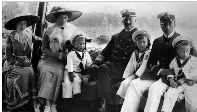
»ŠÍLENÝ« CÍSAŘ. Wilhelm II. s rodinou.

Je zajímavé číst třeba životopis německého císaře Wilhelma II., kterému se všeobecně předhazuje, že zavinil I. světovou válku. Jedna moje německá přítelkyně, lékařka, komentovala jeho životopis: „Pokud