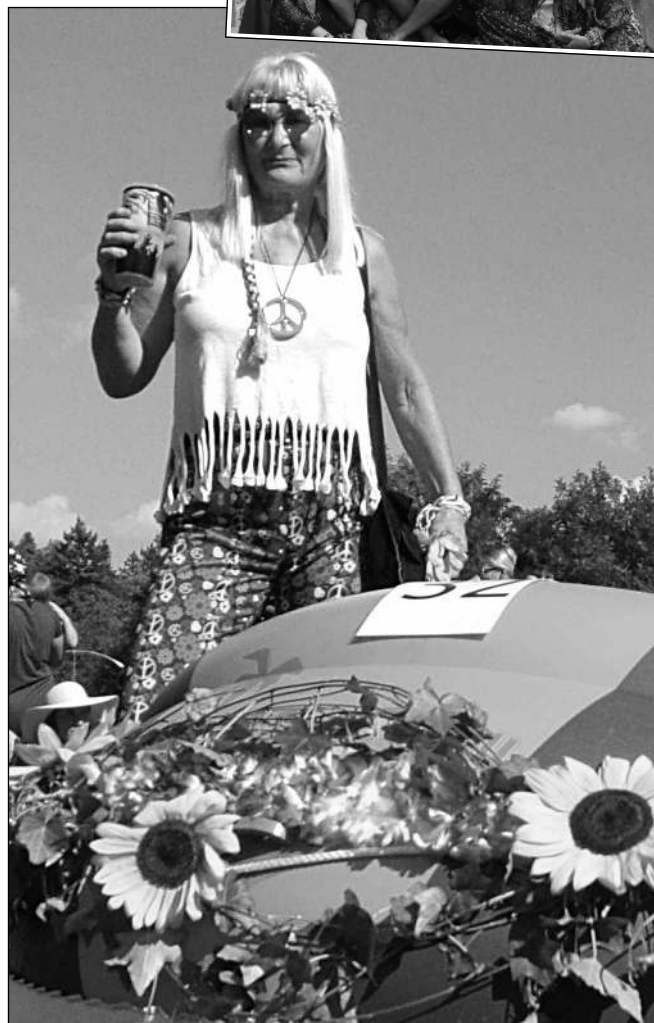
PLAVBA PO BEROUNCE. Přes čtyři desítky lodí všeho druhu s originálně vymóděnými posádkami absolvovaly 4. září plavbu po Berounce od karls- tejského jezu k jezu třebaňskému.