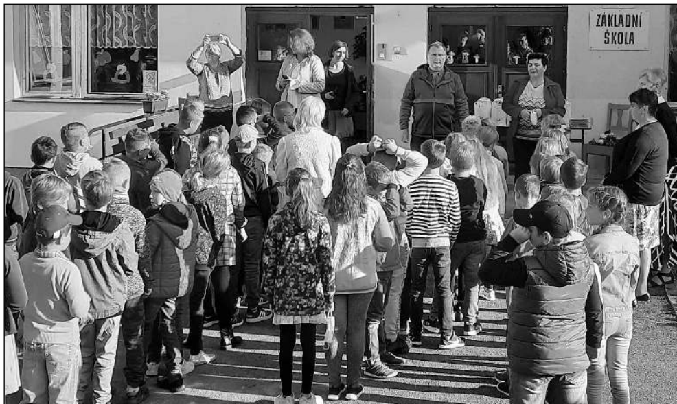
POPRVÉ. Osovské děti 1. září před »svojí« školou.

V pátek 3. září se sešli členové spolku KOS Osova, aby zhodnotili činnost a naplánoval další činnost. Nedávný Country večer se vydařil, pokud nezasáhne vyšší moc, měl by program do konce roku obsahovat osvědčené akce: Drakiádu, Pietu u pomníku, Slavnost světél, Čekání na Mikuláše a adventní Osovské vítí. Dále to budou brigády v areálu prodejny, na farní zahradě a bude se prosekávat kaštanka nad obcí. V dlouhodobějším výhledu je založení aleje v polích mezi Osovem a Osovcem. Zde se ještě musí vyřešit zajištění souhlasu četných vlastníků pozemků, řady nutných povolení a zvolit správný druh vysazovaných stromů. Diskutovalo se i o významném výročí obce - 800 let od první písemné zmínky o ní v roce 2025. Spolek se chce účastnit oslav a plánovat jejich náplň. Uvažuje se o výstavě ve škole i o knize obsahující dějiny Osova, představí se místní spolky. Marie PLECITÁ, Osova