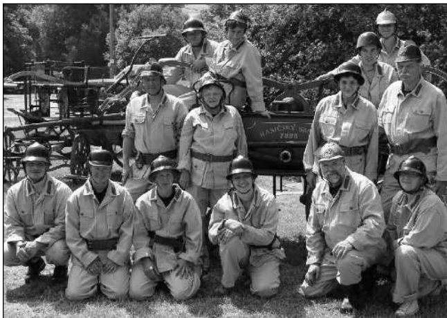
HASIČSKÉ RETRO. Řevničtí hasiči v dobových uniformách a s historickou ruční stříkačkou.

Od té doby uplynulo mnoho času a pokrok se projevil i u hasičů. V Řevnicích se ve vybavení sboru vystřídal různá technika. Ruční stříkačku nahradily stříkačky motorové a různé druhy dopravních automobilů. Následovaly cisterny až po dnešní modernější vozidla. Nyní má naše jednotka k dispozici nové malé dopravní auto Ford Transit určené pro dopravu lidí a dýchací techniky. Můžeme připojit hasičský přívěs s novou motorovou stříkačkou a patřičným vybavením. Nejnovější technika byla pořízena zčásti z dotace a zčásti z peněz města Řevnice. K zásahu máme též k dispozici to hlavní: cisternu CAS-32 Tatra a zásahové vozidlo Avia vybavené materiálem potřebným například při živelných pohro-