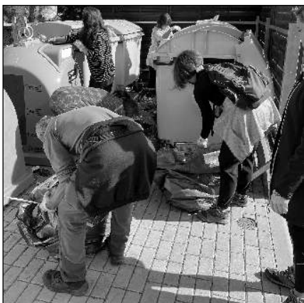
JEŠTĚ ROZTRHÁVAT. Brigádníci při třídění posbíraného odpadu.