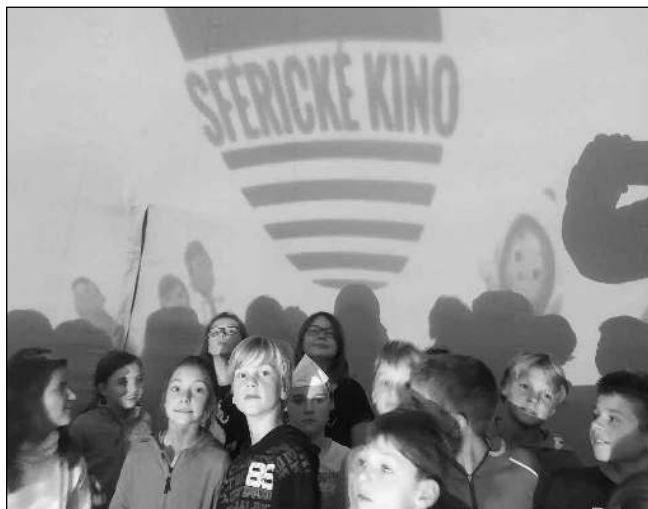
V KINĚ. Karlštejnští školáci navštívili Sférické kino v místní sokolovně. Program byl zaměřený na lety do vesmíru.

Ani v říjnu jsme nezaháleli. Všechny děti se měly možnost zúčastnit lekce Karlštejnské tenisové školy. Nejen, že se toho mnoho dozvěděly, ale měly také možnost vyzkoušet si na vlastní kůži tenisový trénink včetně odpalů tenisovou raketou. Pánové z