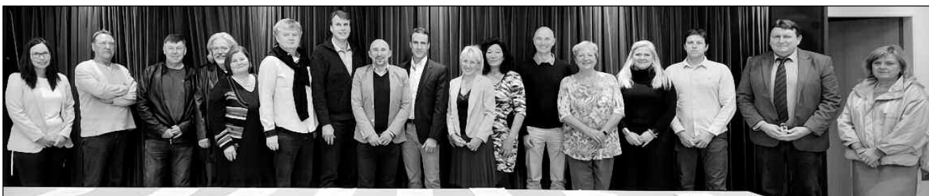
UJEDNÁNO, PODEPSÁNO. Starostové okolních obcí a měst při ustavení Dobrovolného svazku obcí Poberounské odpady.