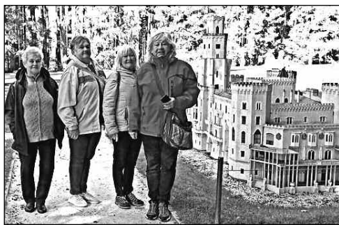
U ZLÁMKU. Hlásnotřebaňské »holky« u modelu zámku Hluboká v parku miniatur Boheminiem.

10) PROCHÁZKA Petr, Svináře - za dlouholetou práci pro obec i místní Sokol