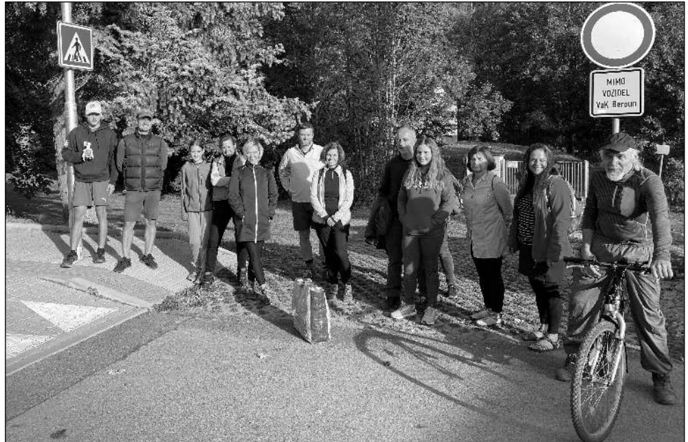
BRIGÁDNÍCI. Účastníci akce Uklidme Karlštejn, která se konala první říjnovou neděli. Brigádníci naplnili odpadky patnáct velkých pytlů. (Viz strana 8)