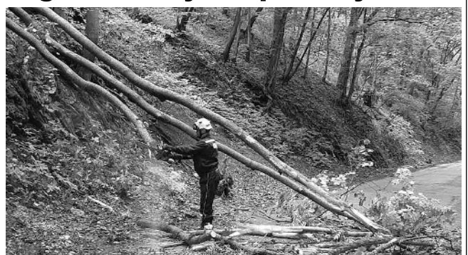
PO BOUŘI. Jeden z karlštejnských hasičů při odstraňování stromů, které v říjnu porazila větrná bouře Ignatz.

Na začátku prázdnin se v nočních hodinách topil návštěvník místního autokempu. Na jeho záchraně se vedle SDH Karlštejn podíleli i profesionální hasiči z Revnic a Berouna. Po vytažení z řeky jej sanitka odvezla na jednotku intenzivní péče nemocnice v Hořovicích. Nedlouho poté se na Berounce v Klučickém jezu převrátil gumový člun se dvěma vodáky. K záchraně se sjely jednotky kromě Karlštejna také z Hlásné Třebaně a Revnic. I tentokrát to dopadlo dobře - mladíci byli po nezbytném vyšetření převezeni do nemocnice. (Dokončení na straně 9)