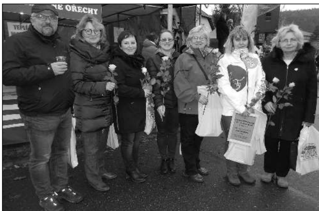
Předložití finalistů Ceny NN. Kdo vyhraje letos?

Více o minulých cenách si můžete přečíst na stránkách http://cnn.nase-noviny.net . Josef KOZÁK