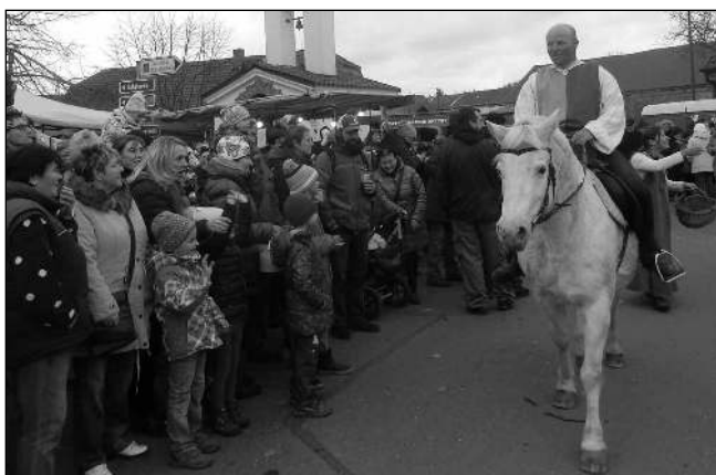
PŘIJEDE MARTIN. Ani letos nebude na posvícení v Letech chybět svatý Martin, i letos přijede na koni.

Oslava Svatomartinského posvícení se uskuteční 13. listopadu od 13.00 hodin na návsi v Letech. Přípraven je tradiční jarmark i bohatý program. Během odpoledne bude - jako každý rok - předána Cena NN určená těm, kteří se nezištně snaží o to, aby se v našem kraji žilo lépe. Návštěvníci se mohou těšit na kapely Los Fotros a Kompaktor, profesionální ohňovou show i lampiónový průvod. Pro děti bude nachystána pohádka Jak to bylo na Sv. Martina spojená s dílnou draní peří a výrobou husy. Součástí posvícenského pro-