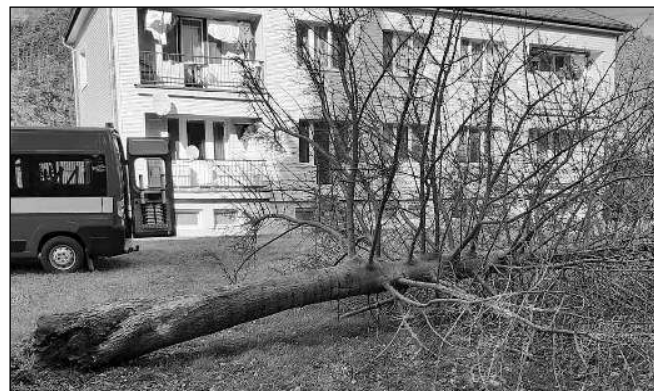
NEVYDRŽEL NÁPOR VĚTRU. Smrk, který vyvrátila větrná bouře Ignatz před bytovým domem v Karlštejně.