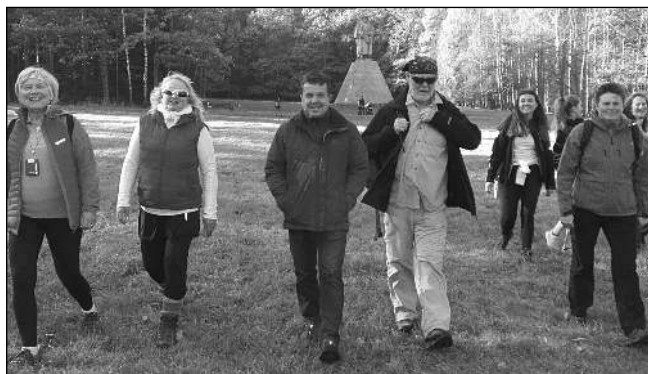
U ŽÍŽKY. Podhůřím Slepčích a Novohradských hor putovali poslední říjnový víkend zadnotřebaňští turisté. Cestou z Borovan do Trhových Svinů si nenechali ujít návštěvu Žížkova rodiště v Trocnově.

Na květen příštího roku chystáme ve škole Den otevřených dveří k výročí zahájení stavebních prací na stávající budově ZŠ a MŠ. Rádi bychom touto cestou oslovili a vyzvali pamětníky, kteří se například podíleli na stavbě, mají fotografie či zajímavé postřehy, aby se s námi spojili,