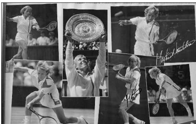
MARTINA. Areál LTC Řevnice je vyzdoben fotkami Martiny Navrátilové a předměty, které jsou s ní spojené.

„Na první hru na skutečném dvorci si dobře pamatuji. Nebylo mi ani šest let a opět jsem hrála svůj velký zápas proti zdi, když mě táta zavolal na volný kurt a začal mě učit forhend. Sotva jsem učtila, jak mi chřupe antuka pod nohama a prožila to blaho odpálit míč přes síť, poznala jsem, že tohle je můj svět,“ vzpomínala o dvacet let později.