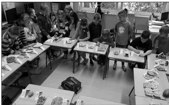
Zadnotřebaňští školáci při ochutnávání ovoce.

V zadnotřebaňské málotřídce jsme při prvouce zapojili do výuky všechny smysly. Děti přinesly na hodinu různé druhy ovoce a zeleniny, které jsme poznávali vizuálně, po hmatu i chuťově. Kromě tradičního ovoce a zeleniny, které známe z českých sadů a polí, jsme ochutnali fíky, kaktus, mango, granátové jablko, dýni, avokádo, vodnici nebo fenýkl. Vzor-