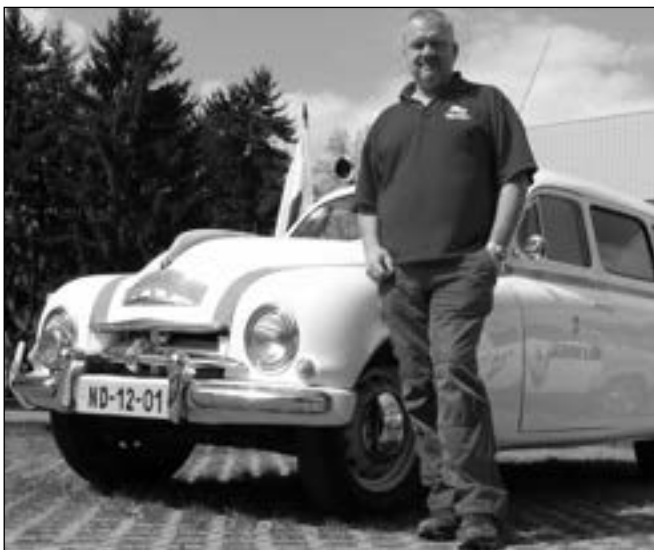
S VETERÁNEM. Ředitel řevnické záchranky s jedním ze svých historických sanitních vozů.

Sebevražedný pořad přibývá, mnoho lidí, zvláště mladých, nezvládá životní situace a jediným řešením pro ně je ukončit svůj život. Často by stačilo si s někým promluvit, jindy může někdo z blízkého okolí zaregistrovat sebevražedný úmysl a pomoci. V našem okolí nejvíce lidí ukončí život oběšením, skokem pod vlak nebo zastřelením... (mjf)