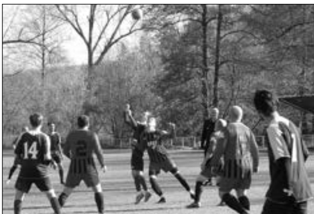
S Mořinou si třebaňský Ostrovan doma poradil 5:2.

Bude sice těžké druhou a možná i postupovou příčku (záleží na výsledcích ve vyšších soutěžích) na jaře