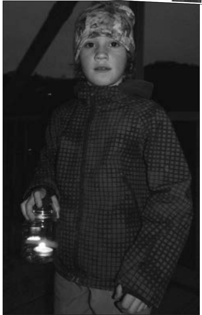
NA LÁVCE. Malí i velcí zapalovali na počest Dne boje za svobodu a demokracii svíčky na lávce mezi Třebaními. (Viz: strana 2)

předvečer svátku 16. 11. Ve středu 17. 11. se lidé scházeli odpoledne u kašny, kde díky iniciativě Marty Kouché měli možnost zapálit svíčku, vložit ji do sklenice a přidat k již hořícím svícím lemující kašnu. Po setmění sousedské čekání zakončila reprodukováná Modlitba pro Martu. (Dokončení na straně 2) (pan)