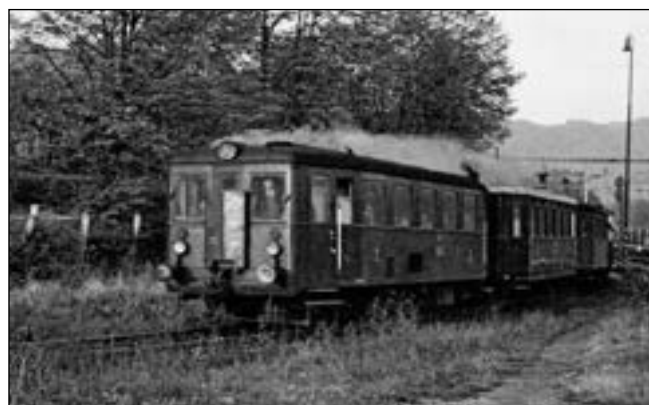
JEDE HURVÍNEK. Typické tmavě červené motoráky M 131 zvané Hurvínek kralovaly »liteňce« dlouhých 30 let.

postavena během jednoho roku 1900-1901. Josef KOZÁK