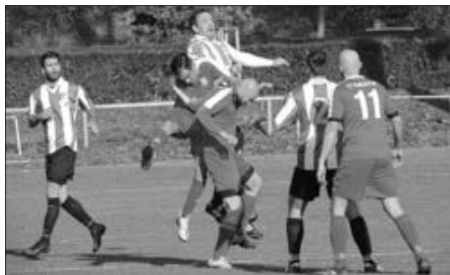
Cembřitu Beroun karlštejnští fotbalisté podlehli 1:5.

Karlštejn - Hořovice B 2:3 Tetín - Karlštejn 5:0 Karlštejn - Nižbor 2:4 Zaječov - Karlštejn 9:1 Karlštejn - Chyňava 1:5 Neumětely - Karlštejn 7:2 Trubín - Karlštejn 3:0 - kontumačně Karlštejn - Drozdov 0:0 Nový Jáchymov - Karlštejn 10:0 Karlštejn - Stašov 1:3 Cembřít - Karlštejn 5:1 Karlštejn - Beroun B 0:10 Žebrák - Karlštejn 7:0