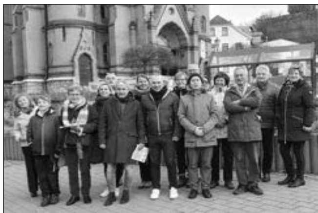
PŘED KOSTELEM, Společné foto po jednání české, italské a německé delegace v německém Mylau.

kusí zapojit do plánovaných aktivit především školská zařízení na svém území – cílem by mělo být zvýšení vzájemného povědomí o partnerských městech, jejich jazyce a každodenní realitě. Prvním projektem v této oblasti by měl být plánovaný zájezd karlštejnské základní školy do Montecarla plánovaný na jaro roku 2022 - pokud samozřejmě pandemická situace realizaci této již dříve odložené cesty umožní. Diskutovány byly také možnosti zapojení delegací z partnerských měst do rozličných společenských a kulturních akcí či aktivit v jednotlivých městech: výročí 70 let založení městyse Karlštejn, výročí založení partnerského spolku v Althen atd. Také tento bod bude samozřejmě dále rozvíjen v souvislosti s vývojem zdra-