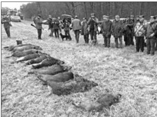
PO LOVU. Karlštejnští myslivci při výřadu divočáků ulovených při naháňce, která se konala 20. listopadu.

Lovu se účastnilo 52 střelců, honců a psodů. Podařilo se ulovit pouze pět divočáků, převážně odrůstajících letošáků a dvou lončáků. Lov se konal za mimořádně pěkného počasí. Po první leči se všichni účastníci sešli na svačině při opékání špekáčků, pití kávy nebo čaje i ochutnávání vynikajících zákusků napečených ženami domácích myslivců. Slavnostní výřad ulovené zvěře se neobešel bez předávání úloмок úspěšným lovcům. Naháňku zakončily lovecké fanfáry zatroubené na lesnici. Většina účastníků společného lovu se po