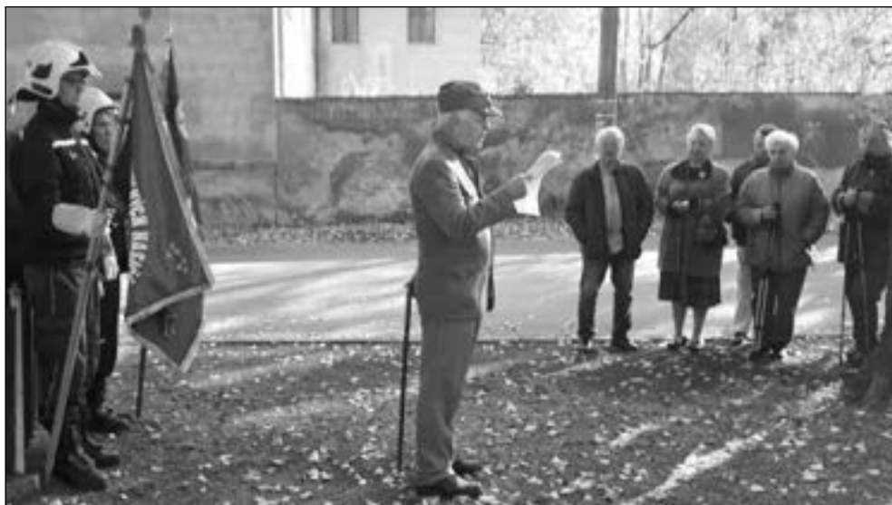
VZPOMÍNKA NA PADLÉ. Obyvatelé Osova u pomníku uctili památku vojáků, kteří bojovali v první světové válce.

* Další brigádu , tentokrát v kaštanové aleji, která je součástí trasy Čtyřlístku stezek, absolvovali členové spolku KOS. Byly odstraňovány četné nálety a vysekáváno křoví bránící v průchodu touto krásnou cestou. (map)