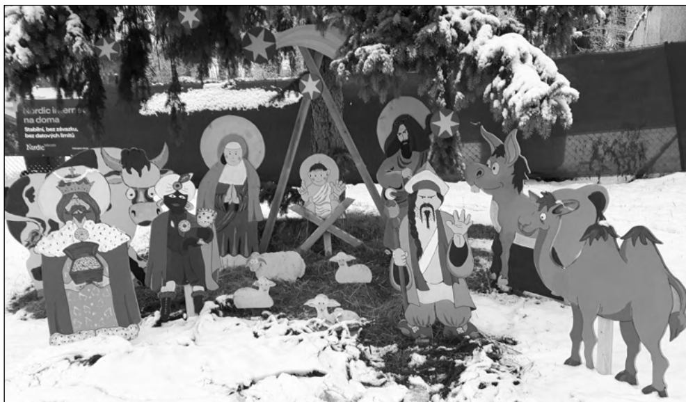
PŘIBÝLI TŘI KRÁLOVÉ. Osovský betlém s novými figurkami.