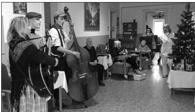
HRÁLI SENIORŮM. Na Štěpána, 26. 12., zahrála kapela Třehusk koledy seniorům v Dobřichovicích (na snímku) i v Řevnicích.