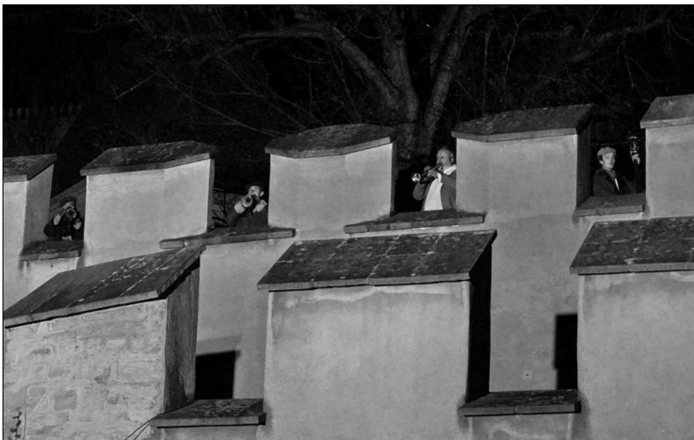
NA HRADBÁCH! Adventní obchůzku Karlštejnem zakončili trubači na hradě.

Zprávy z městyse i hradu, historie obce, kultura, sport... 13/2021 (124)