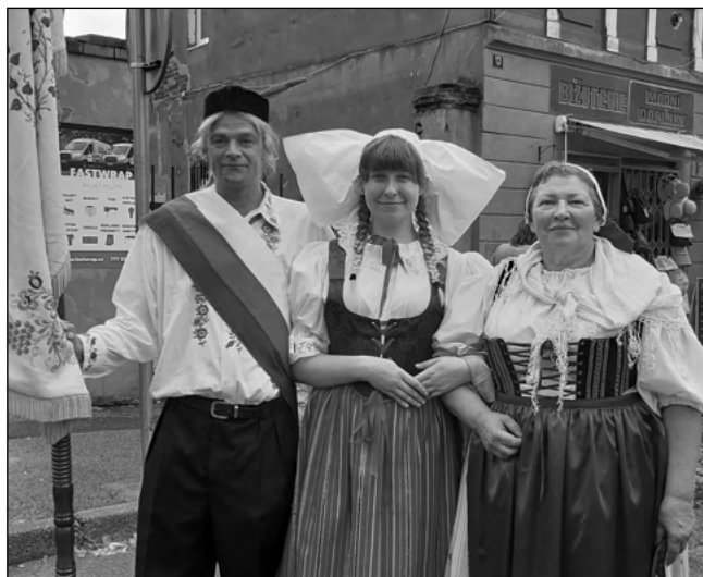
PŘIJEDE KRÁL. S krojovanými baráčníky při vítání Královského průvodu v Rěvnících.