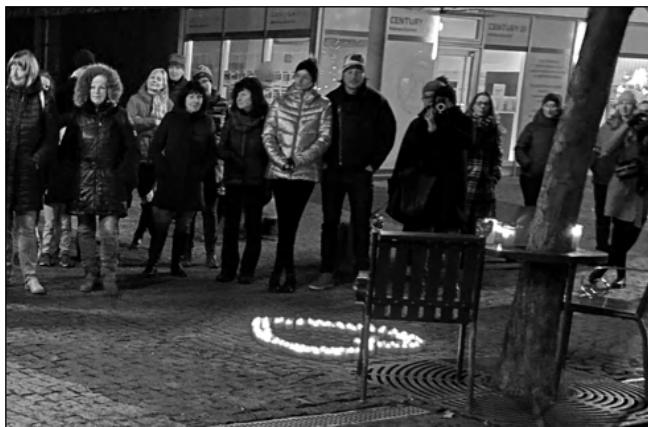
U LAVIČKY. Srdce z hořících svíček u Lavičky Václava Havla na novém náměstí v Černošicích - Vráž.