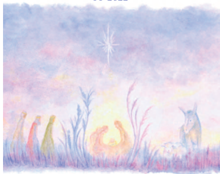
Kéž by svět očistěn a rozzářil se v plné kráse naše nová Zem.