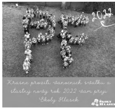
Krasno prozili vánočních svátků a šťastný nový rok 2022 vám přeje Školy Hlásek

Naše noviny-nezávislý poberounský občasník vybírají