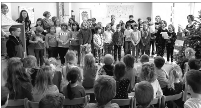
Třebaňské děti při nahrávání vánočního pásma.

Půlnoční a V jeslích dítě spinká. „Abychom se podělili o tento skvělý zážitek a dětskou radost i s vámi všemi, požádali jsme obec, aby pásmo pustili rozhlasem. To se stalo 21. 12. a posleze i na Štědrý den. Děti byly nadšené, že se slyšely v rozhlase, některé maminky chodily do MŠ dojaté se slzou v oku, dorazila i poděkování mailem,“ dodává Macourková. Audio nahrávky si lze poslechnout i na webu školy. Do nového roku pevně zdraví, mnoho štěstí a radosti. Lucie BOXANOVÁ , ZŠ Zadní Třebaň