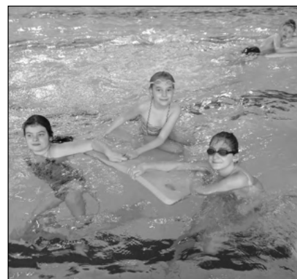
V BAZÉNU. Osvoští školáci při výuce plavání.