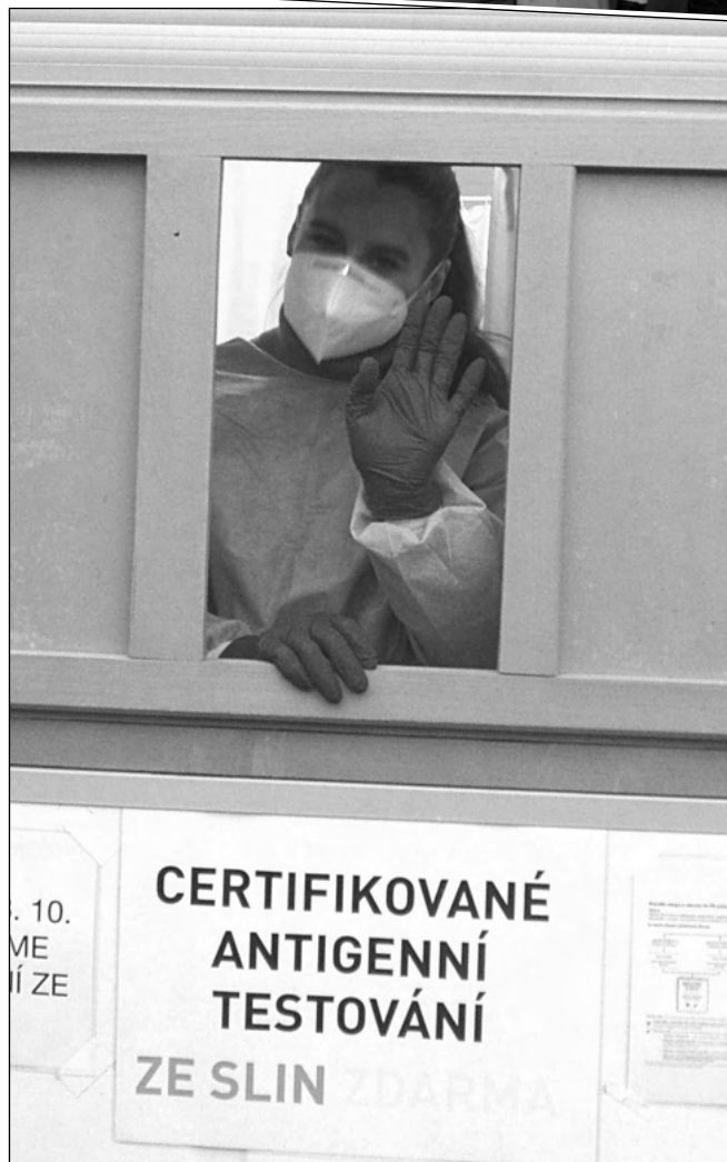
STÁLE TESTUJÍ. Provoz testovacího centra u řevnického nádraží se nezačal ani na přelomu starého a nového roku.

a pomalu tušenou čtvrtou či pátou, na to můžeme vzpomínat s rozpačitými úsměvy. V našem regionu se podařilo pro posílení nadějí udělat maximum, přesto to mnohým nestačí. Za pár týdnů si budeme připíjet k ročním narozeninám nápadu, který se zjevil jako šilený a fantasmagorický. (Dokončení na str. 11) (jg)