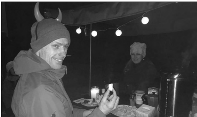
Betlémské světlo bylo k máni 23. 12. u křížku v Zadní Třebani. Zpívaly se koledy, spolek Salto připravil občerstvení.