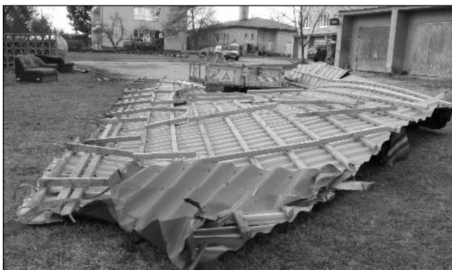
Střecha školy v Neumětělicích, kterou shodil vítr.

pytlomat, kde si zájemci budou moci vzít rukavice a pytle na odpad. Naplněné pytle po úklidu je možné nechat na sběrných místech v obci, OÚ se o jejich odvoz postará. Pytlomat bude k dispozici od 1. do 3. 4. v ulici Lipová, vedle prodejny Coop. Díky, že pomáháte, příroda nám to vrátí! Petra FRÝDLOVÁ, zastupitelka Zadní Třebané