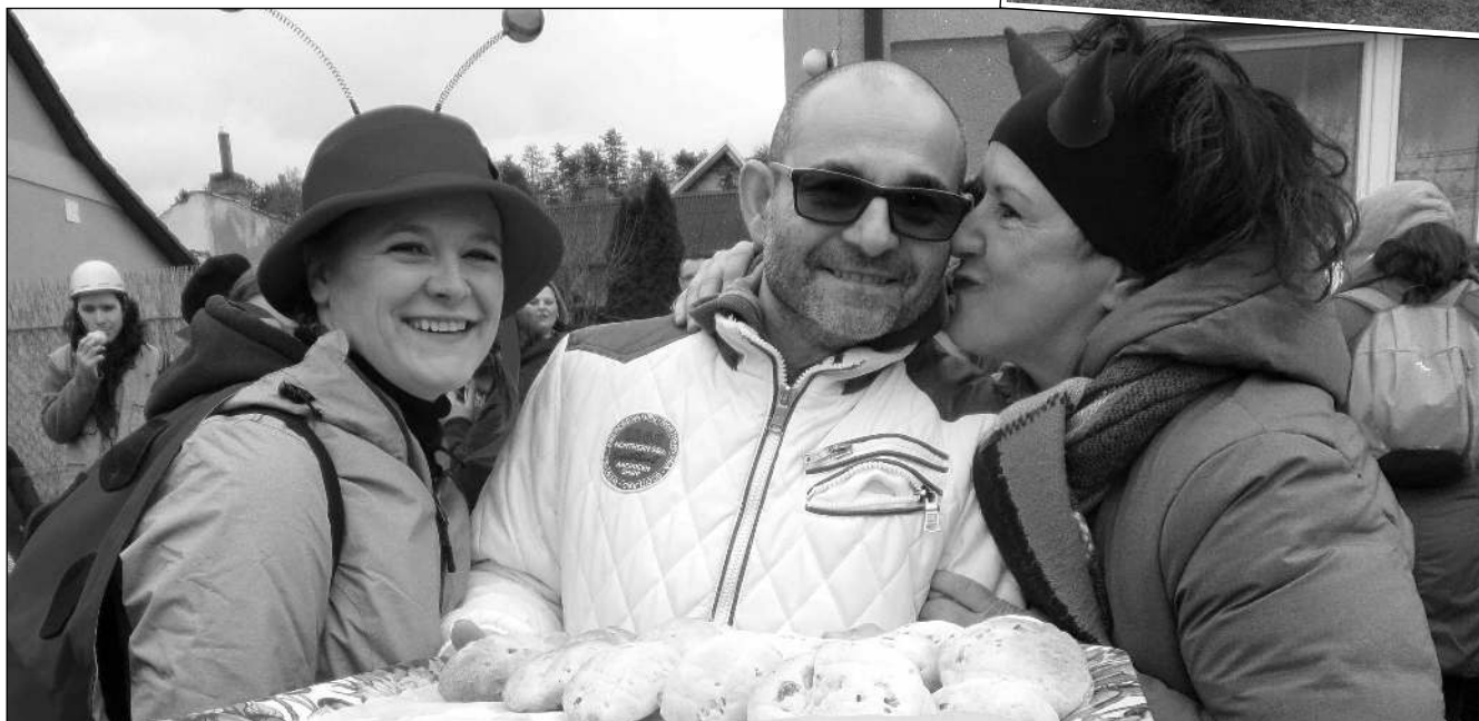
Vyhlášený Poberounský masopust se konal 26. února v Zadní Třebani. (Viz strana 13)