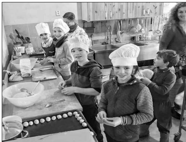
V KUCHYNI. Učedníci při přípravě oběda.

Na podzim 2021 se v Německu uskutečnila mezinárodní konference s názvem Lernziel - Handeln können, v českém překladu Učební cíl - umět konat. Konference byla určena především pedagogům, lékařům a zemědělcům. Nahlíželo se na to, jak ozdravující je to, když dítě může denně vyrůstat na farmě a během té doby se učit vedle dovedností potřebných pro každodenní život i dalším věcem, které jsou obsahem výuky ve školách. Když se dítě na mnoho let neoddělí od světa, ale v procesu vzdělávání zůstává jeho přirozenou a nedílnou součástí. Zazněla i informace o tom, že většina laureátů Nobely ceny vyrůstala na farmě. Na této konferenci jsme prezentovali činnost karlštejnského Dvora So-