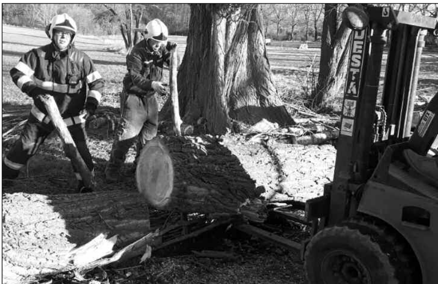
Osovští hasiči při odklízení vichřicí sraženého topolu u obecního úřadu.

Informační občasník Osova a mikroregionu Horymír 2/2022 (203)