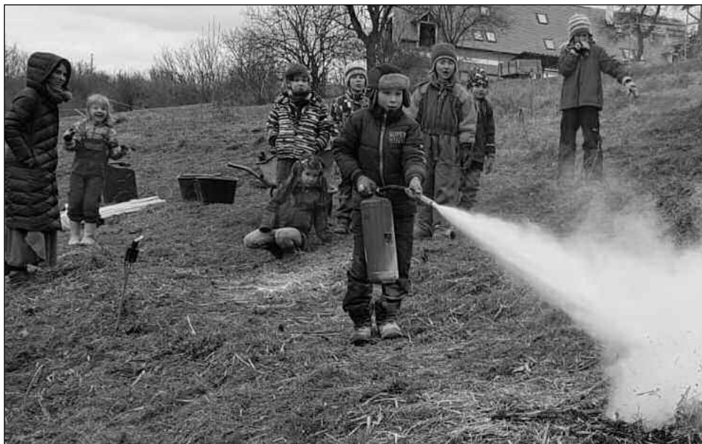
Dvůr Sofie v Karlštejně - Krupně zaujal účastníky mezinárodní konference v Německu. (Viz str. 8)

Zprávy z městyse i hradu, historie obce, kultura, sport... 2/2022 (126)