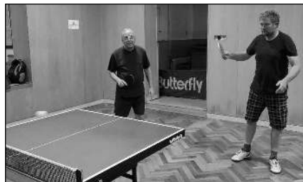
U STOLU. Karlštejnští stolní tenisté při jednom ze svých zápasů..

Ve 14. kole muselo běčko odložit utkání proti Olešné B z důvodu onemocnění covidem. Áčko sehrálo dramatický souboj se Srbskem A. Soupeř nastoupil pouze ve třech, takže jsme opět začínali s vedením 5:0, ale bojoval statečně a dotáhl až na 8:8. Rozhodovaly poslední 2 zápasy, které roz-