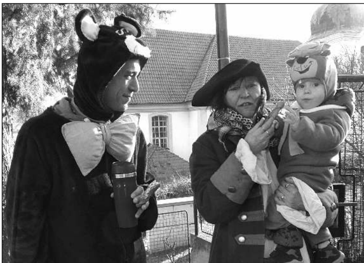
MASOPUST. Všeradicemi 19. února obcházely maškary, ve Dvoře Všerad se konala krajská zábava