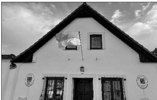
ZA UKAJINU. Letovská radnice je jednou z mnoha v našem kraji, na niž zaválala vlajka Ruskem napadené země.

Poberouni, Podbrdsko - Veliké škody napáchal vítr, který se po polovině února přehnal našim krajem. Odnesl i střechu školy v Neumětělicích. „Mezi 17. a 21. 2. jsme vyjžděli k pětadvaceti událostem spojených se silným větrem,“ uvedl velitel profesionálních hasičů z Revnic Jaroslav Růžička. „Jednalo se o vyvrácené, zlomené nebo jinak nebezpečné stromy na silnicích a zahradách či poškozené části střešních ohrožující okolí,“ dodal s tím, v Rovinské ulici v Hlásné Třebani vítr utrhl větší část střešních dřevěných krovů. „Dopadla na sousední pozemek, kde navíc poškodila plot,“ uzavřel Růžička. Vichřice 18. 2. kolem desáté večer utrhla velkou část střešy ZŠ a MŠ Neumětely. „Střecha odlétla asi 85 metrů k bytovým domům. Cestou zasáhla pouze kontejner na sklo, který se vysypal, a zadní nárazník zaparkovaného