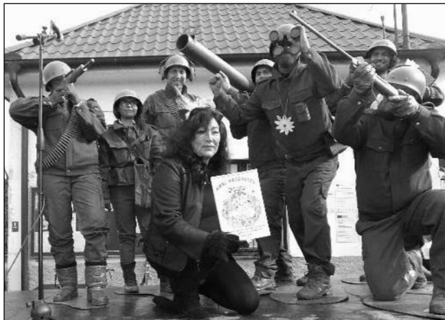
KRÁLOVÉ MASOPUSTU. Nejlepší maskou XXXIII. Poberounského masopustu v Zadní Třebani byli vyhlášeni plastoví vojáčky. Foto NN M. FRÝDL

Průvod masek vedený policajtem, medvědem s medvěďákem a Masopustem obcházeli vesnicí přes šest hodin. Pohoštění se mu dostalo u osmatřiceti domů. Skvělého pohoštění: pečená masa, polévky, škvarkové placky, řízky, obložené chleby, koblihy, šišky, koláče, vdolky, sekaná, pálenka.... MOC děkujeme. Živo bylo i v zaplněné pivnici místního »kulturáku«, kde Třehusk po průvodu ještě skoro tři hodiny vyhrával. „Ve Třebani to bylo super, samé báječné zážitky,“ zhodnotila XXXIII. Poberounský masopust Marie Plečtitá z Osova. Miloslav FRÝDL