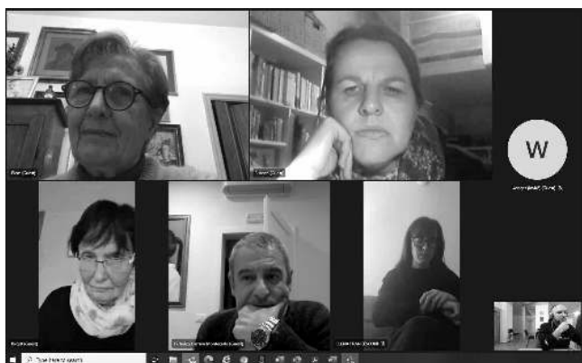
Zástupci partnerských měst na únorové telekonferenci.