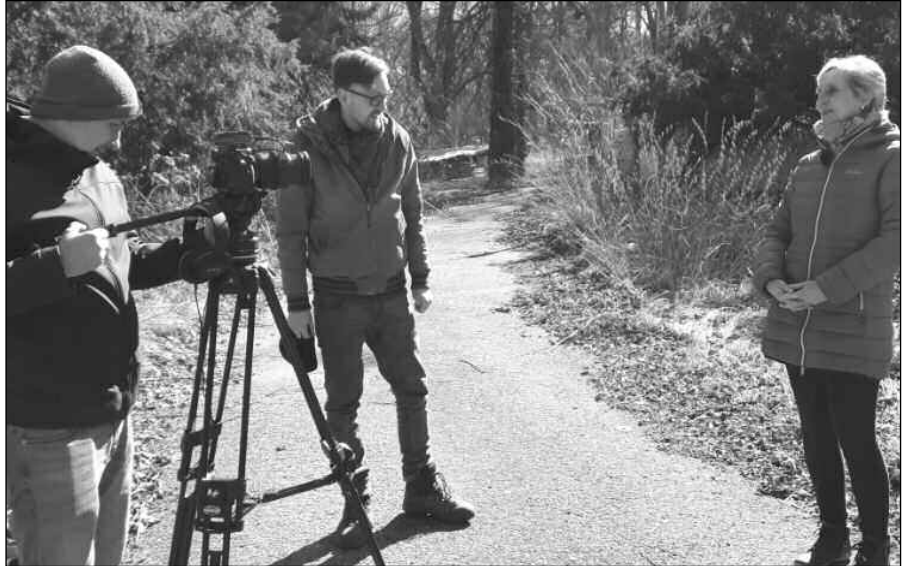
TOULAVÁ KAMERA. Starostka Osova a štáb České televize při natáčení.

* Milí spoluobčané, připojte se k výzvě Velikonoční Kuřátkov 2022. Stačí vyrobit kuřátko o velikosti minimálně 30 cm, vystavit ho, vyfotit a poslat do Velikonočního pondělí 18. 4. pi Slánské na email: slanska@osov.cz. Kuřátko bude započítáno do soutěže. Vyhlášení »Kuřátkova« se uskuteční 22. 4. Stane se jím Osov? (map)