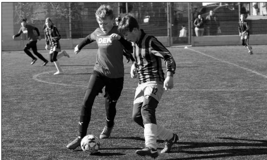
PRÁTELÁK. Všemradičtí fotbaloví žáci v jednom z přípravných zápasů.