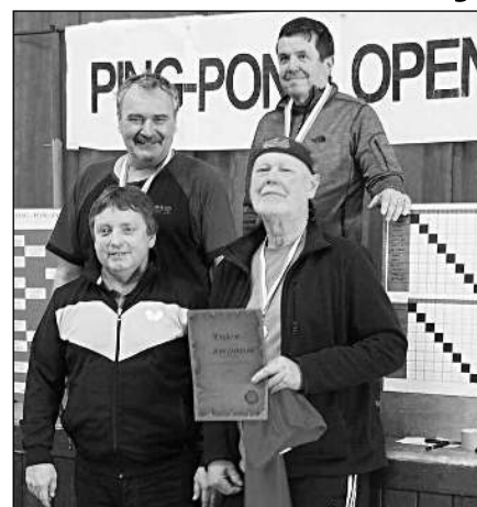
VÍTĚZOVÉ. Nejúspěšnější hráči turnaje spolu s Jindřichem Panským (vlevo dole).