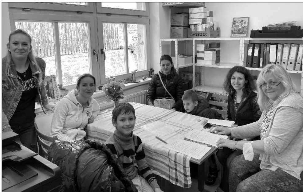
NOVÍ ŽÁCI. Ukrajinské děti v karlštejnské škole.

Zprávy z městyse i hradu, historie obce, kultura, sport... 3/2022 (127)