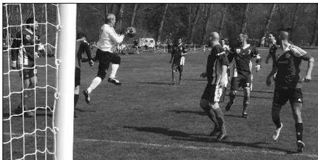
TO SE NEPOVEDLO. Zadnotřebská fotbalisté na úvod jarní části soutěže prohráli doma s posledními Praskolesy.

FK LETY, krajská I. B třída Spartak Rožmitál - FK Lety 0:0 První utkání v sezoně bývá obvykle bojovné, hraje se hlavně na výsledek bez ohledu na libivost. Podobně to vypadalo v Rožmitále, domácí byli důraznější, hosté v prvním poločase fotbalovější. První šanci měl v 6. minutě Veselý: centr před branku nedokázal umístit mezi tři tyče. Ve 12. minutě se situace opakovala, prudký přízemní centr skončil z kopačky Čermáka opět těsně mimo. Další příležitost měli hosté ve 33. minutě, střela Hřebečka z 20 metrů se neve-