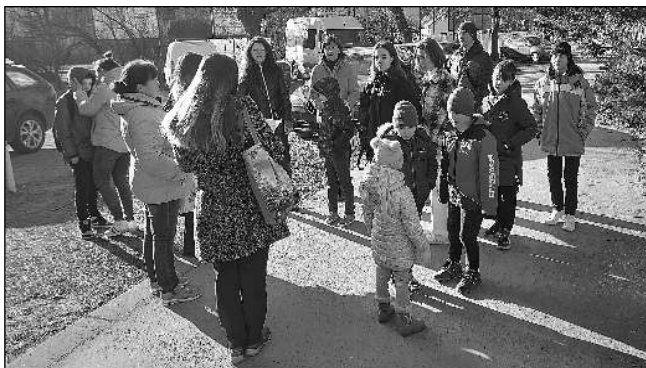
PŘED ŠKOLOU. Ukrajinské děti před vyučováním.

Pokud se podaří vše zrealizovat podle našich představ, měli bychom