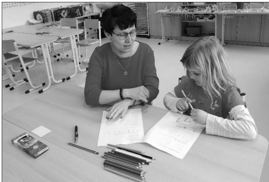
U ZÁPISU. Jedna z budoucích školáček u zápisu do ZŠ Liteň.

Zápis žáků do první třídy pro školní rok 2022/23 se konal 7. 4. v ZŠ Liteň. Během odpoledne jsme přivítali téměř padesát budoucích školáků. Zápis hostila nová budova školy, s organizací pomáhali žáci devátého ročníku. Od 13.00 začali chodit k zápisu malí předškoláci s rodiči, často i v doprovodu sourozenců, poslední zapsaný školák opustil budovu těsně po 18.00. Zákonní zástupci vyřídili potřebné formality a děti se zatím s učitelkami pustily do práce. Za svou snahu dostali drobné odměny. Dětem i rodičům se u nás líbilo, budoucí prvňáčci byli šikovni a my se těšíme na září, až se společně sejdem. Zápisu 30. 3. předcházela den otevřených dveří liteňské školy. Dveře se otevřely pro rodiče žáků, babičky i dědečky, pro všechny, kdo se chtěli přijít podívat. Také rodiče našich budoucích žáků byli vítáni, často přišli i se svými dětmi. Zájem o nahlédnutí do tříd byl veliký, přišlo přes 60 hostů. O tom, že se jim u nás líbilo, svědčí pochvalné zápisy při odchodu. Otevřeno bylo v obou našich budovách, ale do nižších ročníků pochopitelně zavítalo více návštěvníků. S organizací pomáhali devátáci, kteří se své role zhostili na jedničku. Hana HAVELKOVÁ, ZŠ Liteň