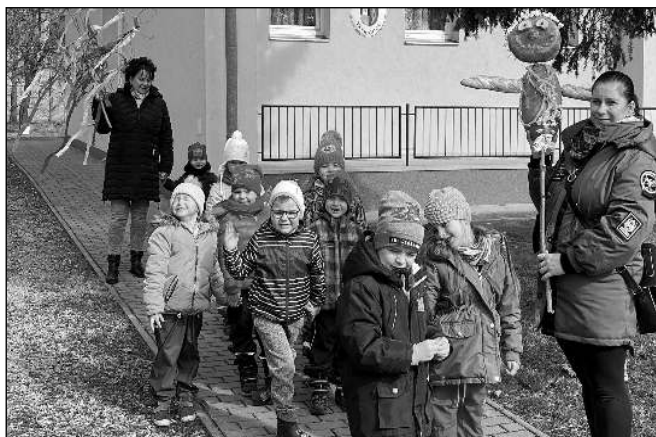
Děti z MŠ Všemradice se rozloučily se zimou a přivítaly jaro. Vyrobity z pečiva Moranu a vynesly ji do rybníka Trnovák, kde Morana posloužila i jako krmivo pro ryby. Po vhození Morany do vody přinesly děti do školky tzv. líto - symbol příchodu jara. Text a foto Pavla NÁHLIKOVÁ, MŠ Všemradice

oběd. Opět se potvrdilo, že výsledky u těchto malých fotbalistů nejsou až tak důležité, důležité je, že po covidu děti opět sportují. Děkuji všem partnerům turnajů, všem, kdo pomohli s organizací a Zámeckému Dvoru za možnost konání turnaje. Text a foto Michal VITNER, Všemradice