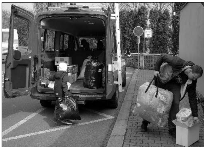
NAKLÁDKA Všemradičtí hasiči při nakládání věcí, které se pro ukrajinské uprchlíky podařilo shromáždit v Osově.

Hmotný výtěžek sbírky jsme rozdělili přibližně na třetiny. První putovala do Dobřichovic, kde vzniklo středisko pro pomoc uprchlíkům z Uk-