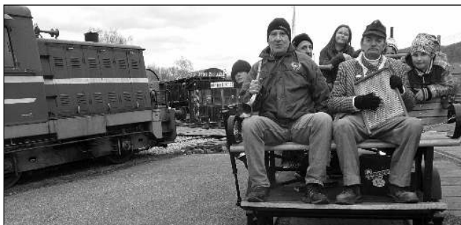
OTEVŘENO. Muzeum Výtopna Zdice bylo po zimní přestávce znovu otevřeno 2. dubna. Expozice historických kolejových i silničních vozidel přilákala navzdory nevlídnému počasí stovky návštěvníků. Svězt se mj. mohli na ručně poháněné drezině.

13. 4. 17.00 a 20. 4. 20.00 POSLEDNÍ ZÁVOD 13. 3. 20.00 EXTASE 14. 4. 17.00 PŘÍŠERÁKOVI 2 14. 4. - 16. 4. a 27. 4. 20.00 (St 17.00) VYŠEHRAD: FYLM 15. 4. 17.00 PROMĚNA 16. 4. a 22. 4. 17.00 ZLOUNI 17. 4. 17.00 PÁSMO FILMŮ HERMÍNÝ TÝRLOVÉ 17. 4. 20.00 TÁTOVA VOLHA - promítání v ukrajinštině 18. 4. 17.00 JEŽEK SONIC 2 20. 4. 17.00 MEKY 21. 4. 17.00 HAVEL 21. 4. - 23. 4. 20.00 PO ČEM MUŽI TOUŽÍ 2 23. 4. 17.00 MIMI A LÍZA: ZAHRADA 24. 4. 17.00 MÝŠÍ PATŘÍ DO NEBE - promítání v ukrajinštině 24. 4. 20.00 HASTRMAN - promítání v ukrajinštině