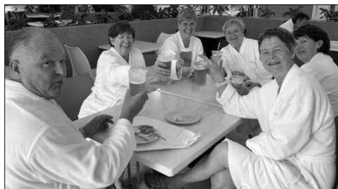
LÁZEŇSKÁ SIESTA. Část výpravy od Berounky v maďarských lázních Kehidakustány.