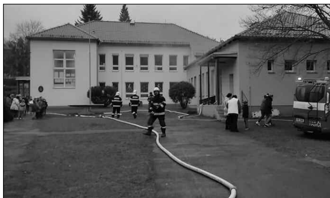
HOŘELO V KUCHYNI. Hasiči při cvičení v areálu zadnotřebeňské školy a školky.

Byl využit vyvíječ umělého kouře a obě naše vozidla. Po příjezdu našich jednotek začal průzkum. Dle scénáře hořelo v přízemí v kuchyni, kde se měla v té době nacházet kuchařka. Jedné třídě se podařilo budovu opustit, další třída zůstala uvězněna v 1. patře a přes zakouřenou chodbu se nemohla dostat pryč. Následoval standardní postup. Jedno družstvo začalo s D proudem hledat kuchařku