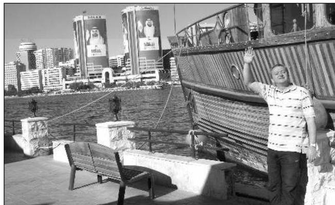
S Českou filharmonii se Jindřich Kolář podíval i do Dubaje.

- vystudoval konzervatoř v Plzni a AMU v Praze - během studií získal několik ocenění na soutěžích v rámci Pražského jara i v Kraslicích - s Českou filharmonii spolupracuje od roku 1985, než se stal jejím členem, byl sólohornistou orchestru Národního divadla - jako sólista vystupoval v Japonsku, USA i v Evropě - vyučuje na plzeňské konzervatoři, je kapelníkem dechovky 12°Plzeň - vyučuje na interpretačních kurzech, pořádá Liteňské hornové dni - je otcem sedmi dětí, s rodinou žije v Litni