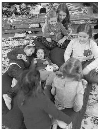
Děti z uprchlických rodin si zaslouží pozornost a péči.