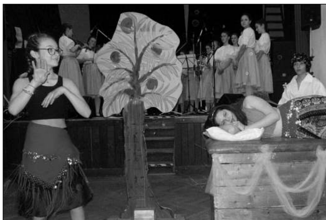
PŘEKVAPENÍ. Na plesu Notičky sehrály několik scének z pohádky Lotrando a Zubejda.

Letos se ples nesl v duchu pomoci Ukrajině. Jelikož v »kulturáku«, kde se konal, máme ubytované tři rodiny, napadlo Lenku Kolářovou nejen pozvat naše nové sousedy na ples, ale také je podpořit výtěžkem z občerstvení, které nachystali rodiče a příznivci Notiček. O výzdobu sálu v bar-