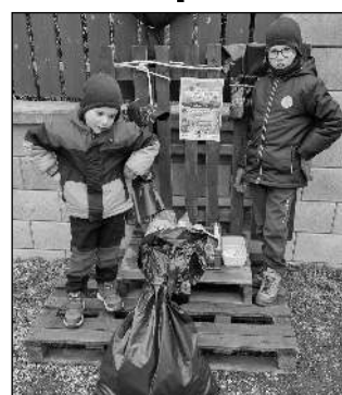
POMOCNÍCI. Do úklidu se zapojily i děti.