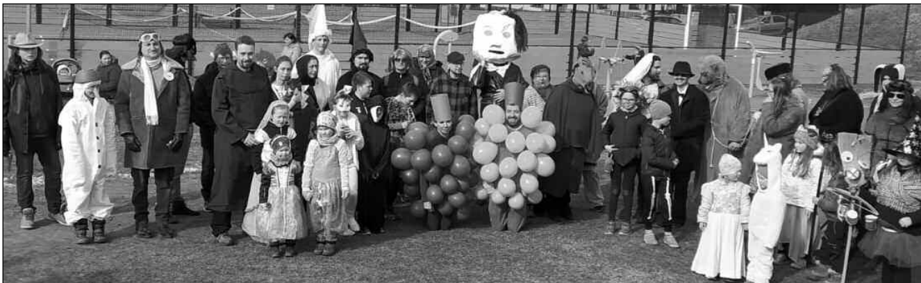
V PŘEVLECÍCH. Maškary, které se zúčastnily premiérového masopustu ve Vižině.

Informační měsíčník obce pod Skálou a brdskými Hřebeny 4/2022 (25)