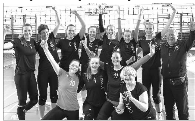
MISTRYNĚ. Dobřichovické volejbalistky - vítězky I. ligy žen.