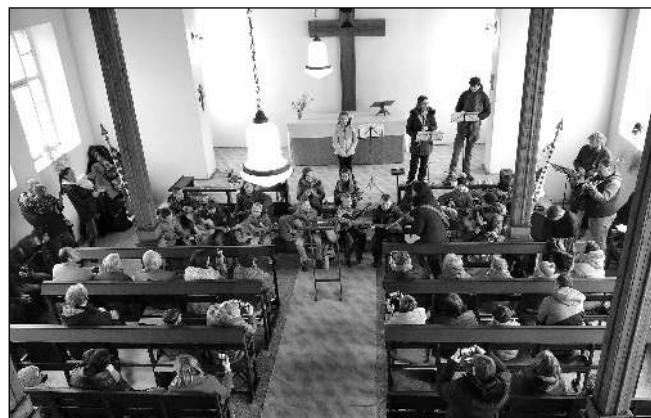
Koncert dětí ve tmaňském sboru.