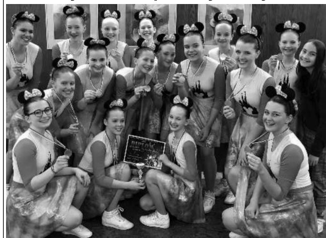
Po úspěchu v pražských Modřanech si aerobičky AC Olympia Všenory v pódiových skladbách zkusily trochu jiný druh soutěže - v neděli 10. 4. se zúčastnily Dvorské jedničky ve Dvoře Králové nad Labem. I tam se jim dařilo: všechny tři týmy vybojovaly zlaté poháry (na snímku). Týden na to jely na taneční soutěž Čáslavský čtyřlístek, kde svoje první místa obhájily. Cesta domů byla veselá, i když jsme se vrátily pozdě. Všem blahopřejeme a přejeme, ať se jim daří a zůstanou pořád taková skvělá parta, jaká jsou. Text a foto Katka ČERNÁ, AC Olympia Všenory