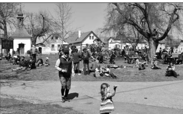
Zaplněná náves na MořinkaFestu.