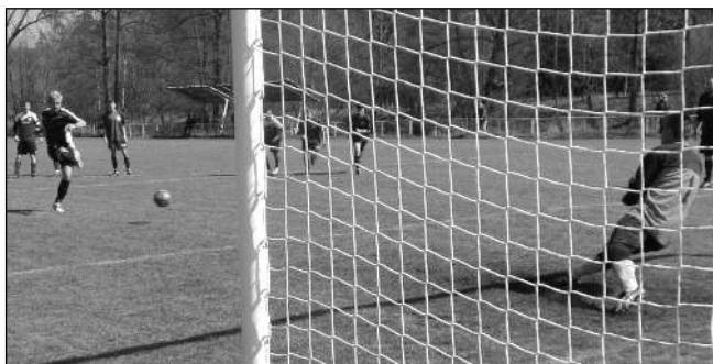
EXEKUTOR GÓLMAN. Na 2:0 v zápase Zadní Třebeň s Osekem zvyšoval z penalty domácí brankář Zima.

Dohrávkou podzimního zápasu starších žáků s Podlázkami zahájili 23. dubna řevničtí »národní« házenkáři jarní část soutěže. Vyrovnaný zápas skončil po boji remízou 4:4. Hned potom se žáci pustili do odvety, která už vyzněla pro Řevnice 8:5. Muži nastoupili proti Litvínovu s plnou soupiskou, tedy v patnácti hráčích, ale než jsme se srovnali do formací, už jsme prohrávali 2:7. Tento rozdíl se držel až do poločasu 10:15. Ve druhém poločase jsme už vyrovnali hru a přiblížili se na rozdíl 3 branek, ale Litvínov se ukázal jako takticky vyzrálý tým a vyhrál 27:20. V příštím domácím zápase přivítají řevničtí házenkáři 14. května družstva Čakovice. František ZAVADIL, NH Řevnice