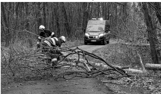
ÚKLID PO VICHŘICI. Karlštejnští hasiči při likvidaci stromů shozených vichřicí.

Členové jednotky sboru dobrovolných hasičů Karlštejn po únorových vichřicích, které přinesly mnoho popadaných stromů v okolí městyse, provedli sběr a odvoz humanitární pomoci na válkou postiženou Ukrajinu do sběrného místa v Dobřichovicích. V březnu členové karlštejnské jednotky se sbory z okolí likvidovali požár chaty v Zadní Třebaně. Naše jednotka dodávala vodu z velkoobjemových cisteren dálkovým hadicovým vedením spolu s jednotkami Hlásné Třebaně, Litně a Mnišku pod Brdy. V současné době jsou na programu výcviky a školení stávajících i nových členů zásahové jednotky, jež byly z důvodu covidových opatření přerušeny či zrušeny. Náš spolek také v březnu po dvou-