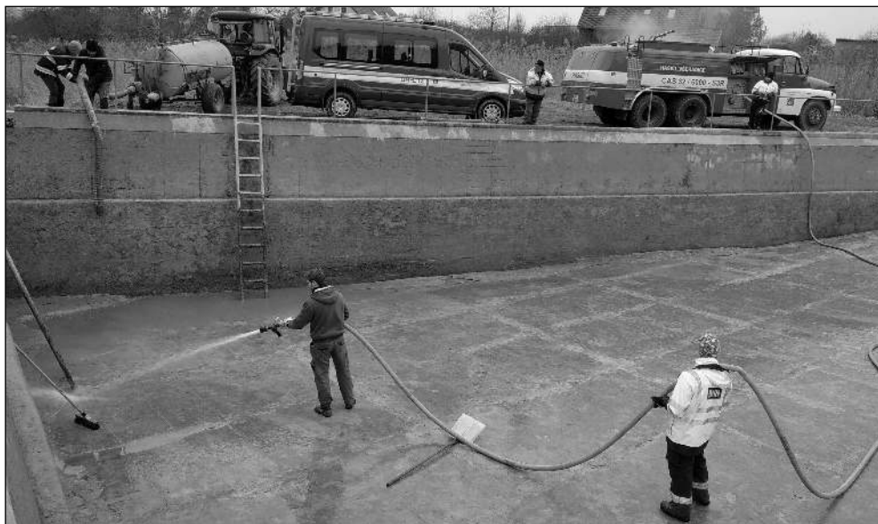
V NÁDRŽI. Všeradičtí hasiči při čištění místní požární nádrže.

* Provozní dobu pro veřejnost omezil poštovní úřad ve Všeradicích. Nově je otevřeno v pondělí i čtvrtek od 8 do 10.00, v úterý od 13 do 14.00, ve středu od 14 do 18.00 a v pátek od 14 do 15.00. V sobotu i v neděli je zavřeno. (zov)