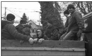
BRIGÁDNÍCI. Účastníci akce Uklidme Osov.