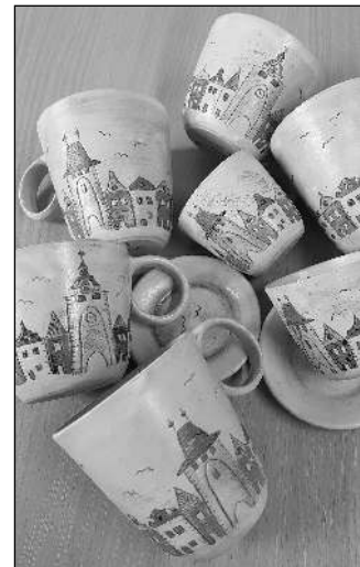
DEKOR BEROUN. Hrnečky ozdobené berounskými branami a domy.

Vzhledem ke všem výše popsaným aktivitám předpokládám, že advokacii či soudnictví už se v budoucnu věnovat nehodláš. Nebo se pletu...? Ano, máš pravdu, právo už jsem »vzdala«. Nesedli jsme si spolu, nesnáším spory. Jsem duší kreativní organizátor. Miloslav FRÝDL