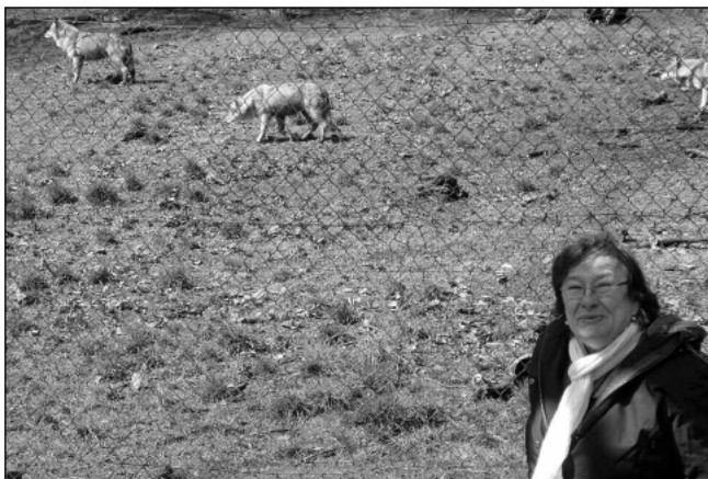
MEZI VLKY. Autorka článku se šelmami.

Dívka vyslechne všechny nápady, ohodnotí jako nehorší začít utíkat. „To vzbudí v každé šelmě lovecký pud,“ vysvětluje. Takže zachovat klid, ustupovat a pomalu se vzdálit. V Německu je aktuálně kolem 1 tisíce vlků, v naší spolkové zemi byl spatřen snad jeden, což mě tedy nijak neznepokojuje. Ale znamená to právě, když chci vlka vidět, musím jít tam, kde ho chovají a to je třeba prá-