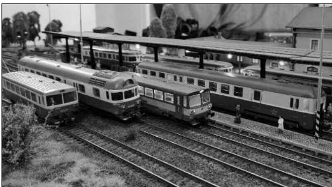
Modely vlaků budou k vidění v řevnickém Dřeváku.

V počátcích kroužku byly vlaky vedeny v analogovém systému řízení, avšak s dalším rozvojem se přešlo na moderní digitální platformu. Pokročilá počítačová gramotnost děti umožňuje vedení kroužku aplikovat nejnovější trendy - pro naše členy je samozřejmostí vést lokomotivy pomocí chytrých telefonů či tabletů prostřednictvím digitální ústředny. Provoz je veden jako ve skutečnosti z místa A do místa B a při dostatku prostoru je samozřejmostí modelově věrná délka staničních i traťových