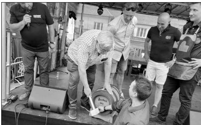
NARÁŽÍME. O naražení soudku pšezenského ležáku se postaral místopředseda Senátu Jiří Oberfalzer.

V sobotu 14. 5. se konal první ročník Karlštejnského pivního festivalu pořádaný spolkem Přátelé Karlštejna. Úvodní ročník festivalu byl původně plánován na květen 2020, ale kvůli několika vlnám Covidu-19 byl nakonec přesunut až na letošní květen. Cílem pořadatele této akce je snaha o rozvoj a podporu turismu v Karlštejně spojená s edukací ohledně piva a pivovarnictví i nabídkou kvalitního kulturního programu. Návštěv-