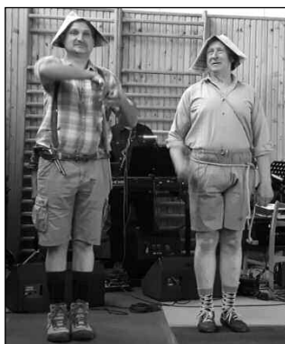
na letošní akci – jedno o cyklistce a psovi, jako druhé sci-fi o Modrém pla-

Nejprve jsme s radostí přijali zprávu o vítězství našich zástupců na hasičském soutěži v Lochovicích, vítězné děti se pochlubily pohárem. Pěknou básničku o pomoci maminkám přednesly děti z MŠ. Průběžně jsme se bavili hudbou skupiny Uvidíme, která program prokládala příjemnými písničkami. Fraška o pejskovi a kočičce, jak pekli dort, byla svižná a vtipná, řada vtipů v podání mužů rozzodávala celý sál. V kovidové době se DOŽ nemohl uskutečnit, ale i tehdy byla připravena báječná zábavná videa, která byla předvedena