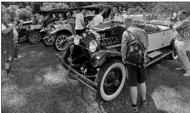
Veteráni byli v obležení obdivovatelů starých strojů.

V sobotu 21. května si v Dobřichovicích dali dostaveníčko milovníci historie. Do prostoru pod místním zámekem pozval místní Veterán Car Club přesně 220 veteránských strojů na již 4. ročník výstavy Veteráni pod zámekem. Převládala auta, dostavila se ale i pěkná řádka starých motocyklů, několik traktorů, pár kusů vojenské techniky a také jeden vyprošťovací a