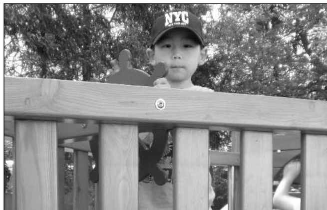
NA KAPITÁNSKÉM MŮSTKU. Děti si vyzkoušely nový herní prvek v podobě lodi. Škola teď pro ni hledá jméno.