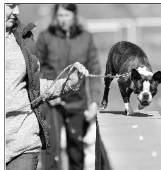
spojených s fungováním klubu, i na přípravě a organizaci akcí. Text a foto Alena VANŽUROVÁ, KK Lety

úspěšných. Další zkoušky z výkonu se konaly 14. května. Přihlášeno bylo osm účastníků, jeden přihlášený psodov nastoupil, úspěšných účastníků bylo šest. Na obě akce vyšlo počasí, byly dobře připravené, kantýna navarila dobré jídlo, až na výjimky se dařilo psodovům podat se svými chlupáči dobré výkony. Poslední zkoušky z výkonu se budou konat 11. června. Postupně budou naplánovány další akce, podrobnosti se mohou zájemci dozvědět na naší webové stránce. Určitě rádi přivítáme diváky. Brigáda členů se na cvičáku uskutečnila 7. 5. Čtrnáct členů uklízelo pozemek u klubovny, klubovnu a odkládací kotce, odpracováno bylo přes 60 brigádnických hodin. Mimo to pracují členové výboru i další členové na pravidelných úkolech