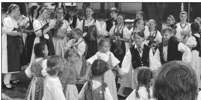
NA JARMARKU. Drobní lokální řemeslníci a tvůrci nabídlí své výrobky na Májovém jarmarku, který se konal 14. května v novém školním areálu v Liáni. O kulturní program se postarala dětská lidová muzika Notičky z Revnic (na snímku). Text a foto Petra FRÝDLOVÁ, Zadní Třebaň

mluvil k davu a hlavně zdůrazňoval slovo »láska«, za což sklídl obrovský potlesk.