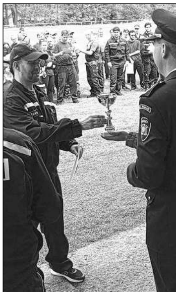
DEN PLNÝ ZÁŽITKŮ. Všeradičtí hasiči na okrskové soutěži a při ochutnávání.

* Turnaj v malé kopané ročníků 2014 se koná 18. 6. ve Všeradicích. K účasti se přihlásila družstva Sparty, Slavie, Příbrami, Dobříše... (miř) * Kontejnery na bioodpad, papír a plast jsou k dispozici ve sběrném dvoře za budovou obecního úřadu Všeradice. Tříděný odpad mohou obyvatelé obce a chatari odkládat v sobotu od 9 do 12.00. (zov)