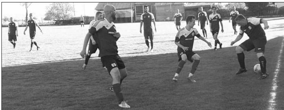
JASNÁ VÝHRA. Všeradice si v derby poradily s Ostrovanem Zadní Třeboň 5:0.