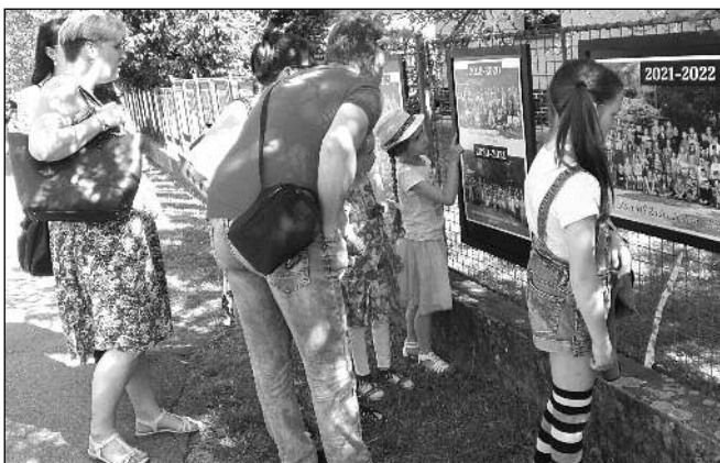
GALERIE NA PLOTU. Návštěvníci oslavy si mohli prohlédnout dobové dokumenty a fotografie instalované na tablech.