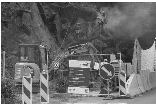
Po zemi přestávce pokračují práce na sanaci skály u silnice z Karlštejna do Hlásné Třebaně.

Po několikaměsíční odmlce byla opět zahájena stavební činnost na krajské silnici 11620 z náměstí v Budňanech kolem restaurace Pod Dračí skalou k hájovně U Dubu. Na tomto úseku silnice se tentokrát sešly dvě stavební firmy.