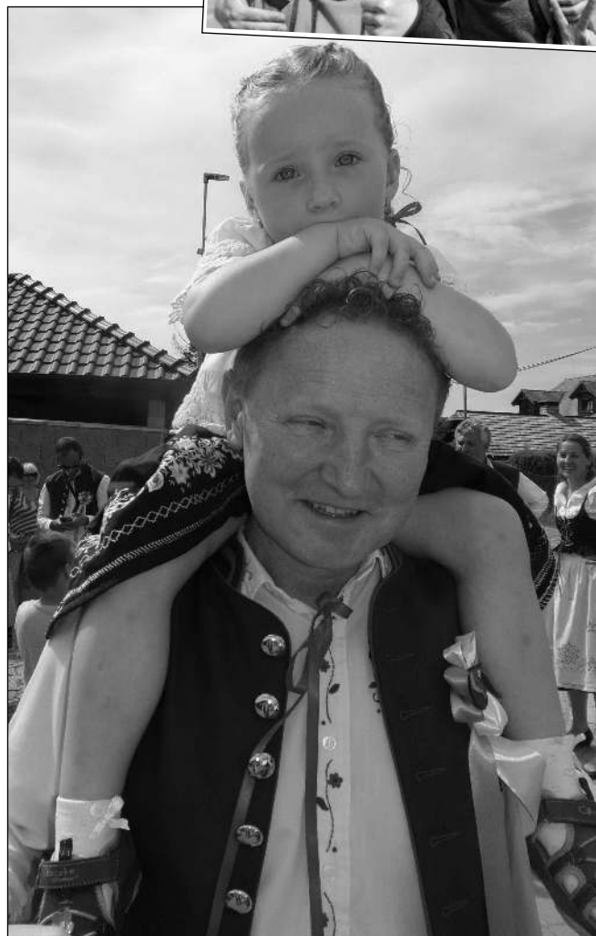
NA MÁJÍCH. Hned na několika místech našeho kraje pokračoval o uplynulých dvou víkendech poberounský folklorní festival Staročeské máje. Jedním z nich byla Hlásná Třebaň. (Viz strana 2)

ské policie Řevnice s tím, že strážníci mu v dechu naměřili 5,75 promile alkoholu. „Hlídka k muži zavolala sanitku a asistovala při jeho převozu do nemocnice,“ řekla Janoutová. „V ordinaci policistům vyhrožovat smrtí, agresivní byl i k lékaři, takže dostal pouta,“ dodala. Následně byl převezzen na záchytku. (miř)