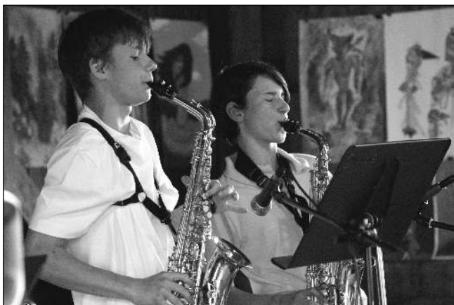
VE DŘEVÁKU. Saxofonisté na festivalku Minimix.

Kulturní maraton koncertů, přehrávek, vystoupení, výstav zakončíme zase ve Dřeváku 10. 6. Absolventskou a závěrečnou výstavou. Spolu s našimi žáky budou vystavovat i studenti malby Univerzity třetího věku Řevnice. Ještě předtím se ovšem se-