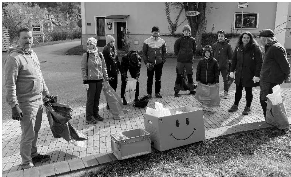
JDEME NA TO! Účastníci jarní akce Uklidme Karlštejn.

Když jsme na podzim loňského roku připravovali první Uklidme Karlštejn, komunitní akci zaměřenou na společný úklid lokalit mimo dosah standardních aktivit technických služeb a úklidových firem, doufali jsme ve vznik jisté tradice. Jak se nám tento záměr vydařil, jsme mohli vyhodnotit během druhé dubnové soboty, na kdy byl vyhlášen druhý společný úklid, tentokrát jarní. S velkým potěšením mohu konstatovat, že akce opět přitáhla pozornost občanů Karlštejna. Vydali se na úklid několika lokalit, mezi nimiž nechyběly břehy Berounky, okolí komunikace směr Srbsko až na hranici karlštejnského katastru, úsek silnice mezi Karlštejnem a Hlásnou Třebaní, Krabina s loukou u Křížku či silnice směrem na Liteň a okolí Krupné. Celkem se vysbíralo patnáct 120 litrových pytlů, které byly během úklidu naplněny nejčastěji plastovými a skleněnými lahvemi, plechovkami či nejrůznějšími obaly od potravin. (Dokončení na straně 8)