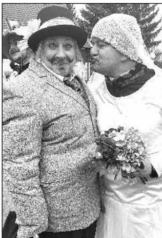
V PRŮVODU. Ženich s nevěstou na masopustu v Hlásné Třebani.

Na začátku února, v sobotu 3. 2., se v Hlásné Třebani již tradičně konala oslava masopustu.