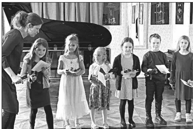
MALÍ KLAVÍRISTÉ. Část účastníků klavírní soutěže, kterou pořádala ZUŠ Řevnice.

ZUŠ Řevnice vyhlašuje 16. ročník dětské regionální výtvarné a literární dramatické soutěže pro školy, školky, umělecké školy, výtvarné ateliéry i jednotlivce v regionu Praha-západ. Letos žáci a učitelé vybra-