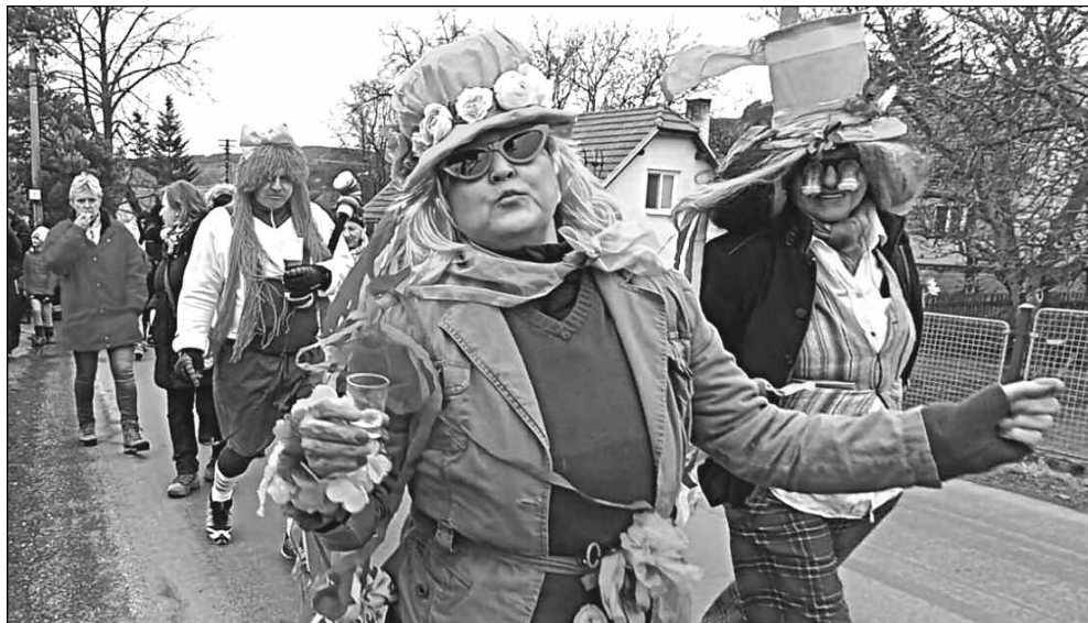
VODNÍCI JAKO ŽIVÍ. Vítězné masky v čele letošního masopustního průvodu.