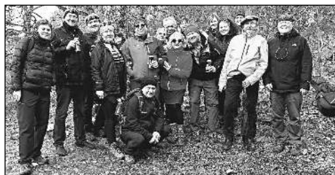
Zadnotřebeňští turisté a jejich hosté při letošním novoročním výšlapu na Jezírko v Brdech.