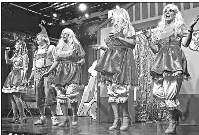
BLÁZNI V KOSTNICI. Účastníci letošního karnevalového bláznění v německé Kostnici.

Proč prodavačka náhle odešla? Nevypadám, že bych měla lepru ani covid. Ovšem mám trochu slovanskou tvář a jak mi už bylo řečeno, také i slovanskou postavu. Rozuměj - poněkud rustikální. A protože tady žije spousta občanů ruského původu, abych to nazvala přesně, tak jsem většinou považována za Rusku. Dřív to nebyl zase takový problém, snad až na to, že na mne třeba cizí pán volal Zdravstvujtě, ale v posledních dvou letech se to nějak zhoršilo, řekla bych. Neznámí lidé, zdá se, jako kdyby ke mně přestali být přátelští.