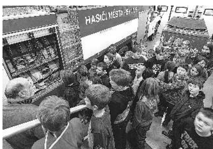
Zadnotřebská školáci na návštěvě u řevnických hasičů.

Přibližně po hodině jsme se přesunuli do nově zrekonstruované hasičské zbrojnice, kde se nám věnovali profesionálové. Vyzkoušeli jsme si na vlastní kůži hasičskou helmu a kabát a seznámili