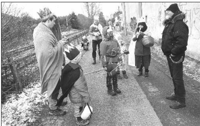
Koledníci na letošní obchůzce Zadní Třebaně.