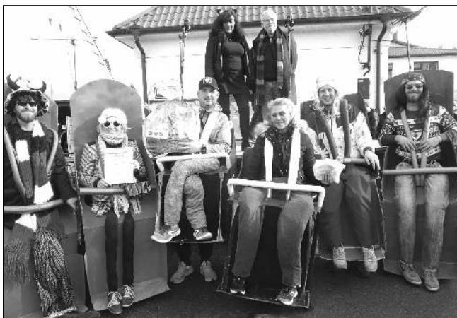
KRÁLOVÉ. Nejlepší maska XXXV. Poberounského masopustu v Zadní Třebani - horská dráha místních fotbalistů.

Bronzovou pozici si vybojovaly Květinové děti let šedesátých v podání manželů Zavadilových a přátel. Stříbrní byli skřítkové několika generací Tučků a pro letošní titul Krále masopustu - Cenu Josefa Jahelky si podle počtu bodů s přehledem dojela horská dráha zadnotřebských fotbalistů. Komise pak ještě ocenila i jed-