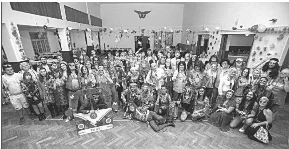
KVĚTINOVÉ DĚTI. Účastníci candrbálu zadnotřebských turistů.