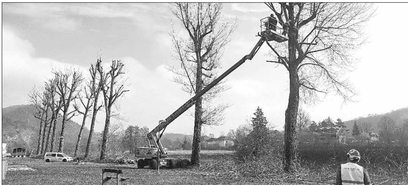
PROŘEZ V KEMPU. Odborné ošetření stromů v karlštejnském kempu.

Zprávy z městyse i hradu, historie obce, kultura, sport... 2/2024 (151)