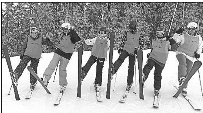
Řevničtí školáci na »lyžáku« v Rakousku.

SkiAmadé, jedno z největších lyžařských středisek v Rakousku, nás vítalo nádhernou kulisou zasněžených hor - i když dole, v údolí, se zdálo, že jaro je za rohem. Počasí nám přálo a sněhu bylo na svazích dostatek, což vytvořilo ideální podmínky pro lyžování i snowboarding. Všichni jsme se věnovali zdokonalování