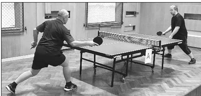
Karlštejnští stolní tenisté při vzájemném zápase.

SVS, spol. s r.o. Karlštejn 345 267 18 Karlštejn – Poučnick www.svs.eu