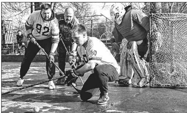
JDE DO TUHÉHO. S blížícím se finále Řevnického bandy cupu se na hřišti pořádně přitvrzuje.

V pátém kole, které se hrálo 3. 2., trápila Citrus Team marodka. „Nemohli se účastnit a čtyři jejich zápasy tudíž musely být zkontumovány ve prospěch soupeřů,“ uvedl Kodet s tím, že ostatní duely byly poměrně vyrovnané. Střelecky se nejvíc dařilo Dominiku Trávníčkovi z týmu Samotářů, který se trefil 7 x, o gól méně vsílil »kojot« Bedřich Horčík.