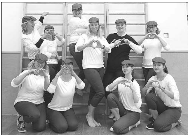
Hlásnotřebaňské sokolky při nácvičce na slet.

V červenci se bude v Praze konat XVII. všesokolský slet, společenská událost, která nemá ve světě obdoby. V Hlásné Třebani je teď kolem Sokola skvělá parta, proto jsme si řekli, že na sletu nesmíme chybět. Přípravy začaly před více než půl druhým rokem. Už na podzim 2022 jsme neotrpělivě očekávali, jaké budou hromadné skladby a přemýšleli o tom, že bychom se sletu v roce 2024 chtěli jako jednota účastnit. Po první prezentaci skladeb bylo jasno. Nadchly nás hned tři skladby - pro předškoláky Mravence, pro dorostenky i ženy V rytmu srdce a do třetice pro ženy Babí léto. Každá skladba má své mimální jednotky, tedy oddíly cvičenců, které představují část celku nebo také obrazce, které vzniknou při hromadných skladbách na stadionu v pražském Edenu. Mravence nacvičujeme jako dva oddíly - 2 dos-