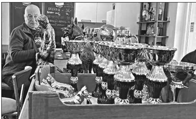
Poháry, které dostali úspěšní letovní kynologové na výroční členské schůzi spolku.

Co nás čeká v letošním roce? Pokračujeme v pořádání kurzů socializace šteňat od věku 10 týdnů do 6 měsíců. Novinkou od loňského podzimu je socializace šteňátek malých plemen.