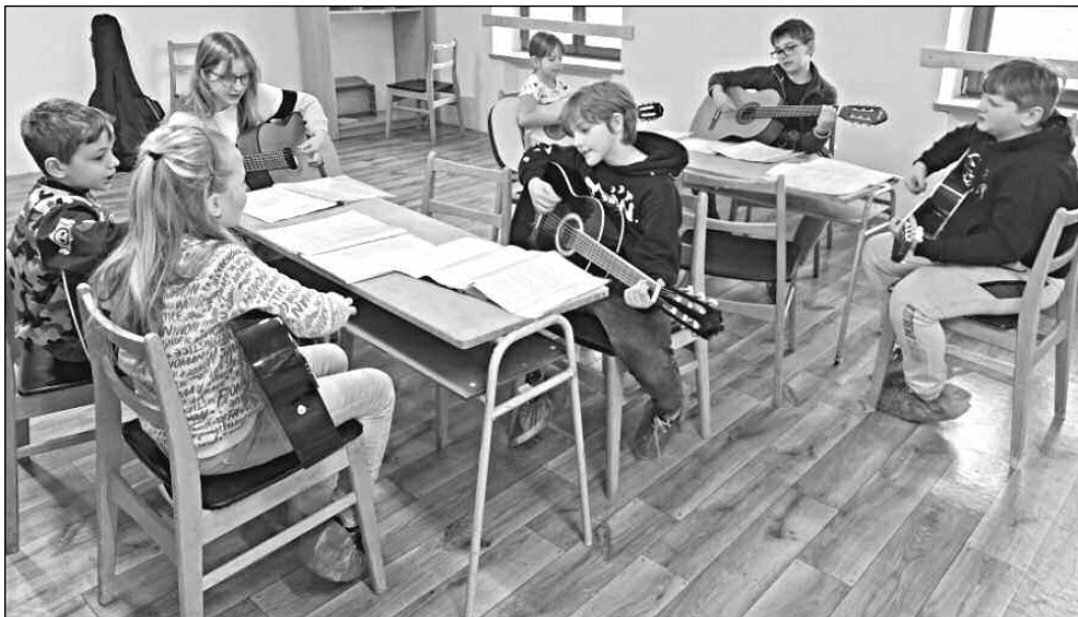
MALÍ KYTARISTÉ. Kroužek hry na kytaru v osovské Staré škole.

* Zájezd do divadla v Příbrami na představení Haliny Pawlowské Manuál zralé ženy pořádá Obecní úřad Osov. POZOR: změna termínu na 17. dubna od 19.00, vstupenky jsou platné. Odjezd autobusem od obce v 18.00, cena vstupenky i s dopravou 600 korun. (map)