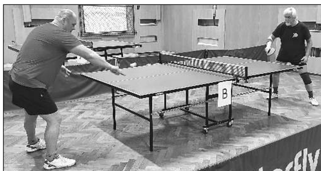
Karlštejnští stolní tenisté v akci.

Dalším týmem, který jsme porazili, byly Broumy. Po úvodních čtyřhrách byl stav 1:1 - Vácha-Kotek vyhráli, Holý-Cajthaml prohráli. Do stavu 5:5 jsme tahali za kratší konec, ale