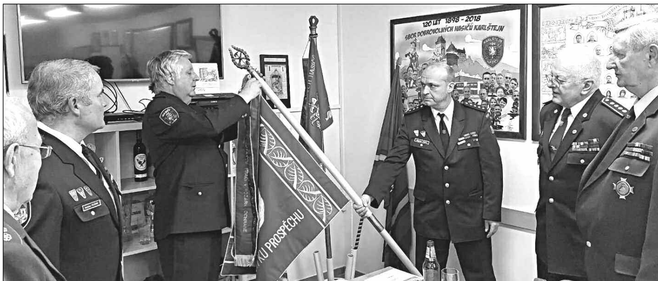
OCEŇENÍ PRO HASIČE. Čestnou stuhu k historickému praporu sboru obdrželi karlštejnští dobrovolní hasiči.

Zprávy z městyse i hradu, historie obce, kultura, sport... 3/2024 (152)