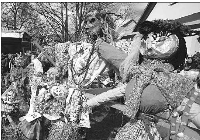
MORANY. Do soutěže o nejkrásnější letošní Moranu je zatím přihlášeno třináct figurin.