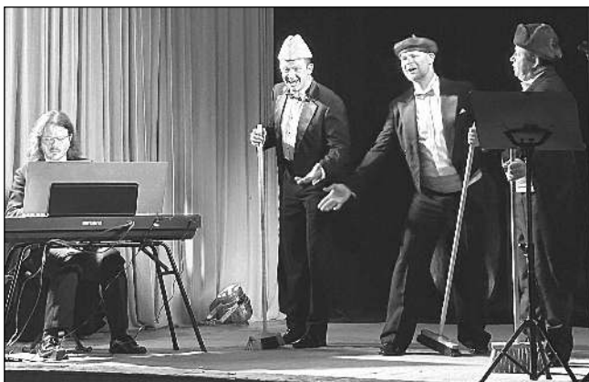
TŘI TENOŘI VE VRANÉM. »Stylově« oblečení tenoristé při finále vystoupení ve Vraném nad Vltavou.