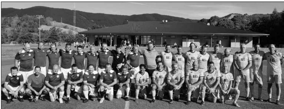
NA ZÉLANDU. Zadnotřebanští »gardisté« se svým novozélandským soupeřem, týmem Nelson Suburbs a při putování kolem Mordoru.