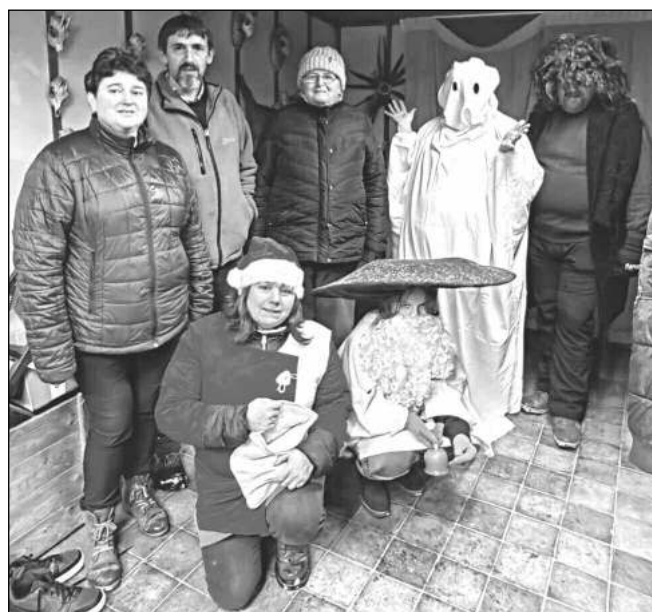
TURISTÉ V MASKÁCH. Předseda spolku a další jeho členové při přípravě Mikulášské cesty kroužku Poznej přírodu.