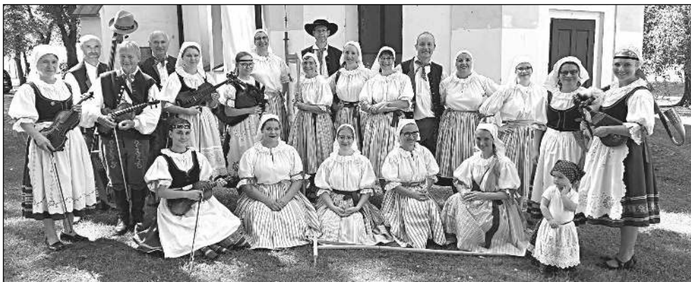
POPŘVÉ. Premiéru si na letošním poberounském folklorním festivalu odbude soubor Bystřina.

KARLŠTEJN, hrad, radnice sobota 4. května SVINĀŘE, sportovní areál sobota 4. května BEROUN, Barrandovo náměstí sobota 11. května HLÁSNÁ TŘEBANĚ, areál Sokola sobota 11. května VIŽINA, fotbalové hřiště sobota 11. května MNÍŠEK POD BRDY, předzámčí sobota 11. května MOKROPSY, Masopustní náměstí neděle 12. května VINARICE, náves sobota 18. května VŠERADICE, u hospody sobota 18. května ZADNÍ TŘEBANĚ, náves sobota 25. května 2024