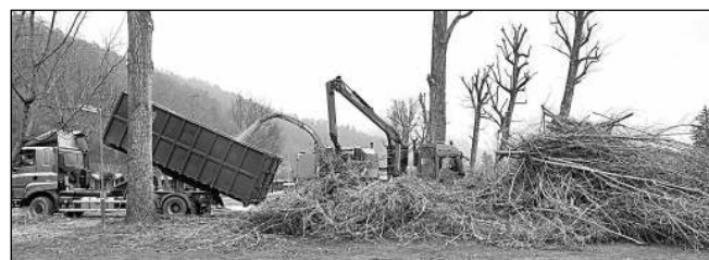
Zpracování prořezaných větví v kempu.

Občané Karlštejna jdoucí a jedoucí kolem autokempu mohli zaznamenat masivní prořezání dřevin. (pep) (Dokončení na straně 8)