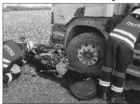
Bouráčka u Kučar.