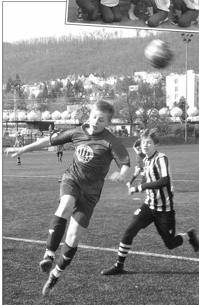
ZAČÍNÁ FOTBALOVÉ JARO. Fotbalisté v našem kraji rozehrají předposlední březnový víkend jarní část mistrovské sezony (viz str. 15). Starší žáci Řevnic v přípravném utkání v sobotu 9. 3. »zničili« své vrstevníky z Radotína na jejich hřišti 9:0.