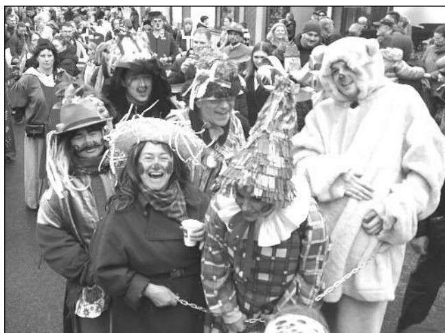
V PRŮVODU. Dobře se bavící účastníci prvního Karlštejnského masopustu na místní pěší zóně.

O hudební produkci při cestě městem se postarala kapela Třehusk a ZUŠ Radotín. V odpoledních hodinách průvod dorazil na náměstí, kde byl připraven krátký program. Divákům se postupně představily ZS Karlštejn, Třehusk, Divadlo Na rohu u nás a bubeníci z Radotína. Po ukončení programu na náměstí na děti čekal karneval pod taktovkou DJ Karla Moravce a celý masopust