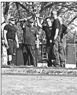
Účastníci brigády u koupaliště v Osovcích.

Po úspěšném Dni osovských žen (výše) bylo na 13. dubna naplánováno čištění koupaliště v Osovcích.