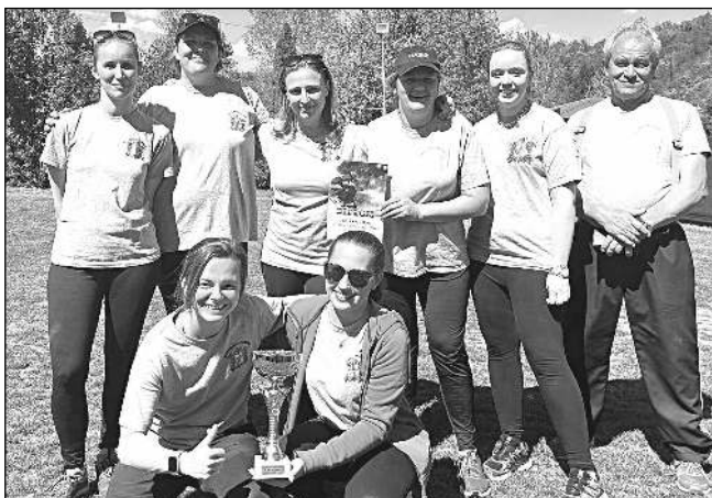
Karlštejské hasičky na okrskové soutěži v Zadní Třebani.

Konec dubna patřil u karlštejských hasičů přípravě na okrskovou soutěž v požárním sportu. Jako v uplynulých letech jsme se jí zúčastnili s družstvy žen a mužů. Ženy ze soutěže přijely s pohárem za první místo, mužům se bohužel během útoku stal úraz, a tak na ně místo na stupních vítězů nezbylo. Pozadu nezůstali ani naši mladí hasiči. Soutěžili ve dvou věkových kategoriích a získali poháry za druhé i třetí místo. Je třeba ocenit nejen mladé hasiče, ale i jejich vedoucí, kteří je na soutěž připravili. Ještě jsme nestačili usušit všechny hadice ze soutěže a byla tu další akce - tradiční pálení čarodějnic v areálu hasičské zbrojnice. Hranice s umělecky vyvedenou čarodějnici byla vinou suchého počasí a nařízení krajského úřadu Středočeského kraje o zákazu pálení ohrožena. Nakonec vše dopadlo dobře, hejtmanka zákaz trochu zmínila: pálit se smělo s asistencí požární jednotky u vatry. Přes