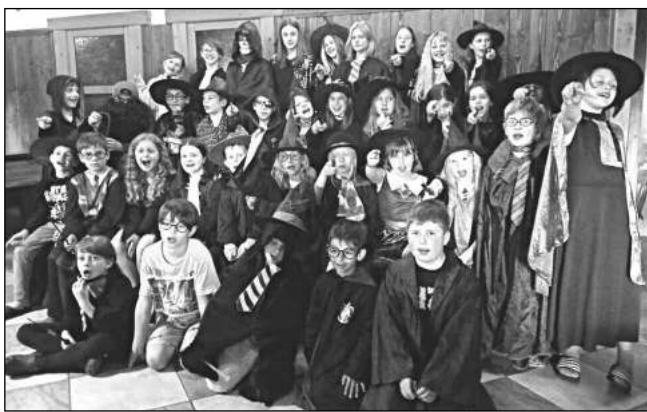
VE ZNAMENÍ KOUZEL. Karlštejnští školáci se na škole v přírodě ocitli ve světě Harryho Pottera.

rodě. Jako tradičně jsme zavítali na vrcholky Krkonoš, do horského hotelu Štumpovka. Již dlouhá léta říkáme, že »jedeme na Dvoračky« - to