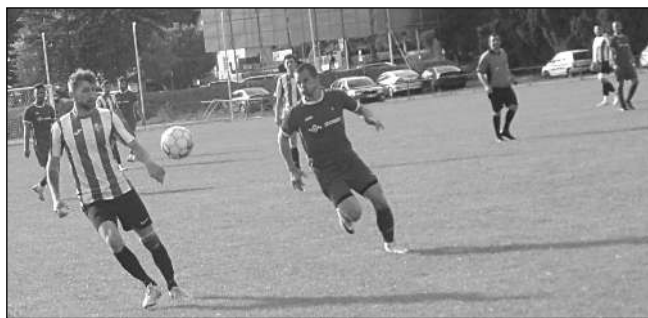
JASNÁ VÝHRA. Karlštejnští fotbalisté si v dohrávaném mistrovském utkání poradili na svém hřišti s Lochovicemi 4:0.

hlavně efektivnější v proměňování šancí. Ostrovan si jich také několik vytvořil, ale bez gólového zakončení. Zmar hostů podtrhl Zýka, když neproměnil penaltu. (Mák)