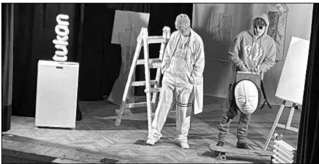
VE VRANÉM. Dva z protagonistů hlásnotřebského představení při repríze ve Vraném nad Vltavou.

statkem kabeláže a jiných technických pomůcek se stala nezbytnou. Přichází režiséri už jen doladili, co bylo třeba a vnesli mezi nás opět