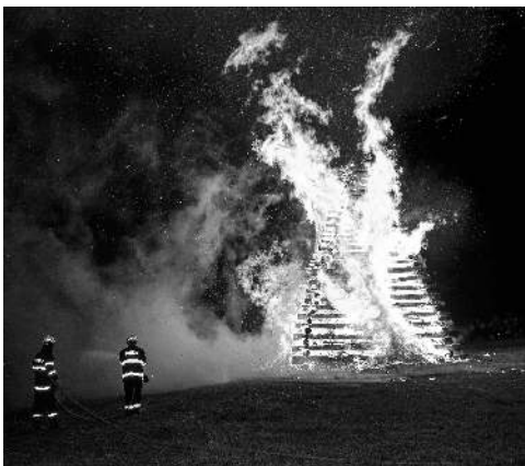
Hořící hranice na kopci Vrážka a turistická vizitka vydaná k letošním řevnickým čarodějnicím.