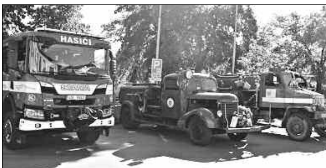
NA NÁMĚSTÍ. Moderní i historická hasičská auta vystavená na řevnickém majálesu.

Poprvé u nás předvedli svou činnost psovodi K9 rescue team cz., kteří zachraňují životy u nás i v zahraničí. Uskutečnilo se několik ukázek z výcviku psů, kteří jsou nejvíce využíváni na vyhledávání osob pod lavinou, pod vodou a vyhledávání osob v prostoru. Pro návštěvníky bylo připraveno i užitečné a praktické poví-