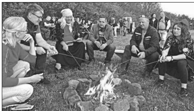
U OHÝNKU. Mohutná čarodějnická vatra se letos v Osově nekonala, místo ní se pekly buřty.

V úterý 30. dubna v 18.30 jsme se jako tradičně sešli u místního obchodu a za víření bubnu se cestou mezi poli vydali nad Osovec. Průvod byl sice trochu prořídilý, ale na místě konání se nakonec shromáždilo na šedesát účastníků. Až na pár výjimek dorazily i všechny místní děti. Nejprve došlo na focení masek, kterých bylo třináct, jedna povedenější než druhá. Krásná a přísná vrchní čarodějnice si je posléze jednotlivě zvala k pohovoru, kde mimo jiné musely dokázat, že jsou bytosti kouzelné. Bylo to zábavné, stejně jako lety na koštěti a jiné dovednosti vlastní pouze nadpozemským tvorům. Dokonce se zpívalo,