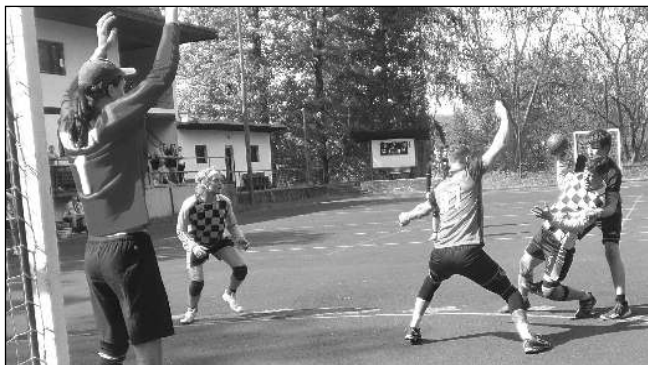
Řevničtí házenkáři prohráli doma s Modřany 13:16.

V sobotu 18. 5. k nám v oblastní soutěži dorazí Čakovice. Starší žáci A hrají od 9.30, dorostenci od 10.35 a starší žáci B od 11.50. Druholigové áčko přivítá 19. 5. od 14.30 mužstvo Chomutova. František ZAVADIL, NH Řevnice