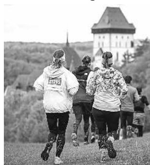
Účastníci závodu Běhej lesy Karlštejn.

Charitativního běhu se v Karlštejně zúčastnilo 262 dobrých duší, které účasti přispěly na organizaci Život 90 podporující seniory. Díky počet-