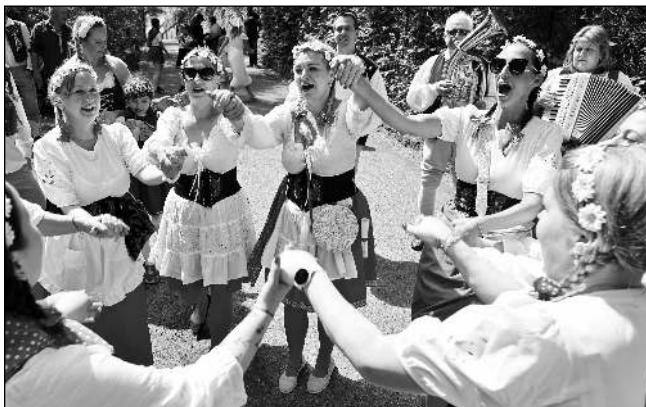
CESTOU NA HRAD. Májovnice na letošních karlštejnsko-srbských Staročeských májích.

Prvotní myšlenkou bylo uspořádat menší akci - májový průvod zakončený programem na nádvoří hradu. Pak nás ale napadlo spojit se se srbskými sousedy a uspořádat máje společně. Nápad karlštejnsko-srbských májů byl přijat pozitivně oběma stranami. Začali jsme s přípravami, sháněním krojů, nacvičováním vystoupení, organizací a dalšími po-