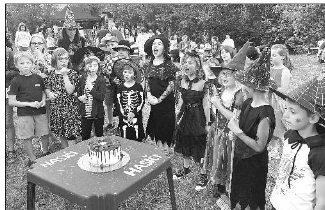
KOLEM DORTU. Malí účastníci čarodějnického jeje u dolního jezu v Hlásné Třebani

Naše noviny - XXXV. ročník nezávislého poberounského občasníku.