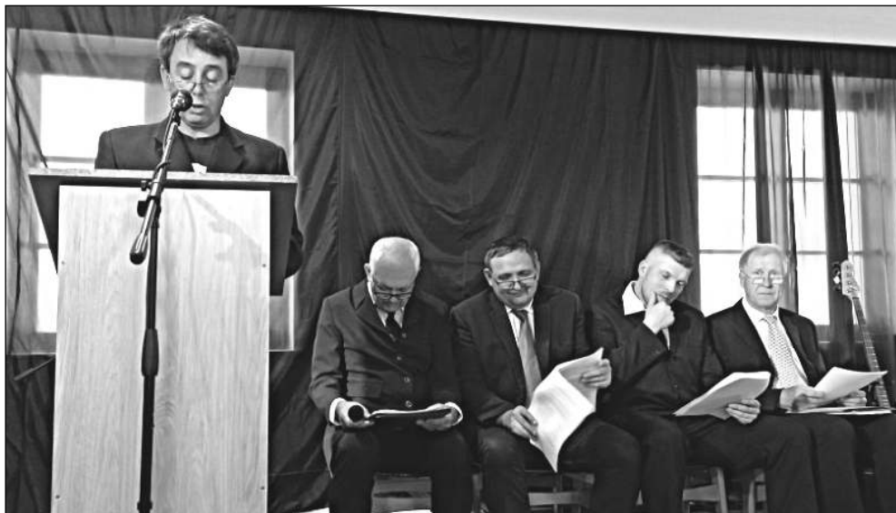
NA SEMINÁŘI. Scénka inspirovaná Divadlem Jára Cimrmana na Dnu osovských žen.