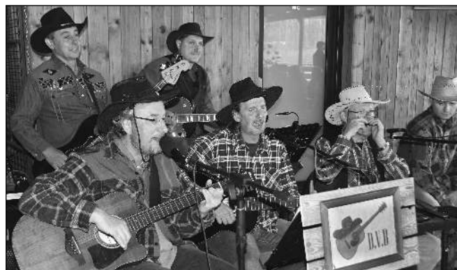
Kapela DVB si zahrála i ve Svinářích.