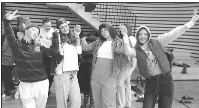
Řevničtí školáci si výměnnou akcí užili.