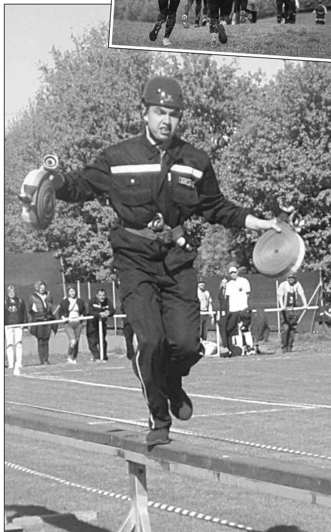
NA KLADINĚ. Okrsková soutěž v požárním sportu se konala poslední dubnovou sobotu na Ostrově v Zadní Třebani. (Viz str. 5)