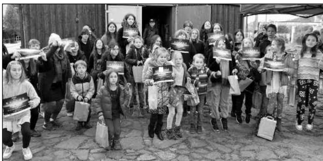
NA VERNISÁŽI. Oceněné děti s diplomy na vernisáži výstavy v řevnickém Dřeváku.