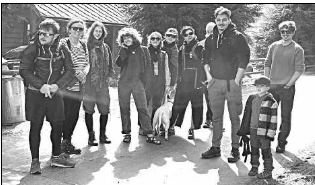
Výprava ZUŠ Řevnice v šumavských Borových Ladech.