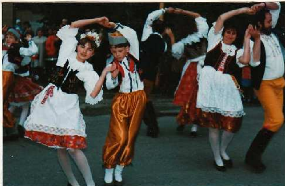
Schýlně, kdo se moravskou besedu naučil lépe? Děti nebo dospělí?

Předposlední květnový den se sešlo kompletní obecní zastupitelstvo ke svému pravidelnému jednání. Nejdůležitějším bodem programu byla zpráva finanční komise týkající se příjmů a výdajů za první čtvrtletí letošního roku. Obecní úřad v Zadní Třebani dostal nabídku k vybudování čistírny odpadních vod. Zatím se jedná o předběžnou zeležítost. O podrobnostech vás bude me informovat. /Mék/