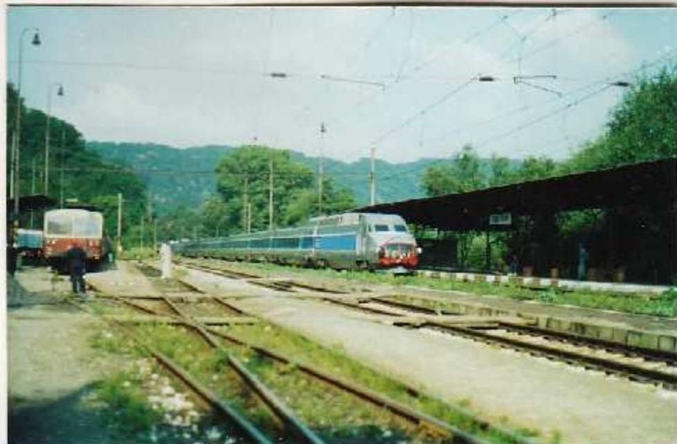
Před časem jsme vás informovali, že naši obaí pojedou francouzským se- lezníkem nadřazené soupravy TGV Atlantique. Nás přinesl její snímek.