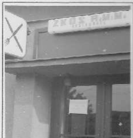
Tak a je to tedy! Restaurace Na nádraží, vlastně ZKOS RaMiMa opět v provozu.