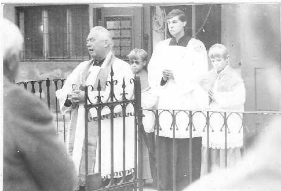
Dušíčkové bohoslužby se tuto sobotu konala u kapličky. Pan vikář také posvětil křížek pod lípou.