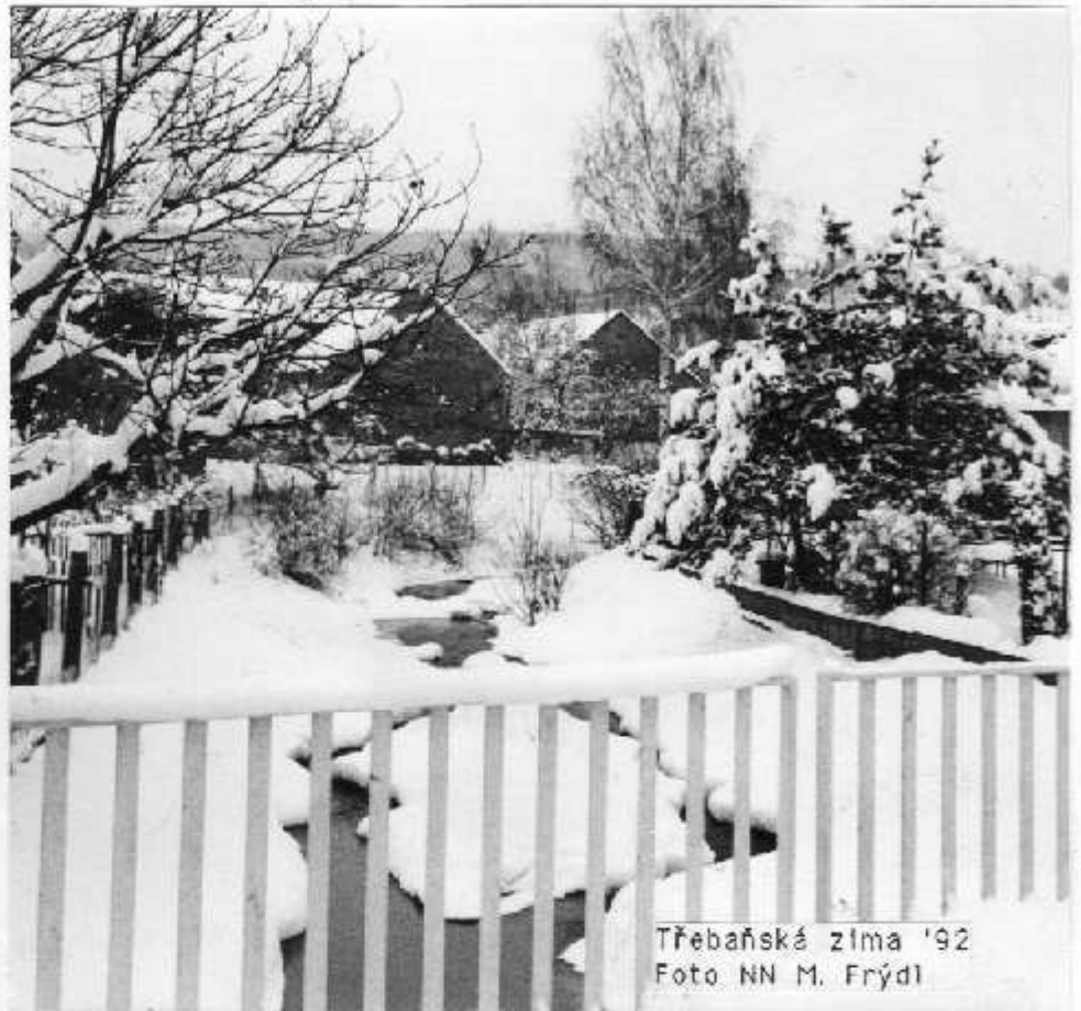
Třeboňská zima '92

Do rodinného domku ve Zdicích se vloupal dvacetiletý K.P. z Chodouně. Po vniknutí do objektu byl v okamžiku, kdy si začal dávat na hromadu věci, zadržen policejní hlídkou. Na zadrženého byla uvalena vazba. (kv)