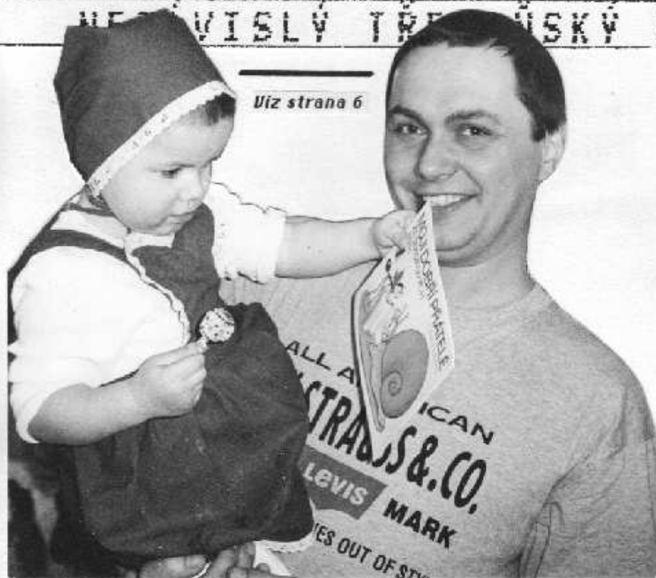
Uiz strana 6