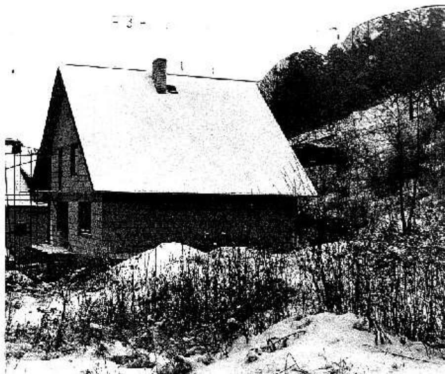
Zima dorazila i do kopců nad Zadní Třebaní.