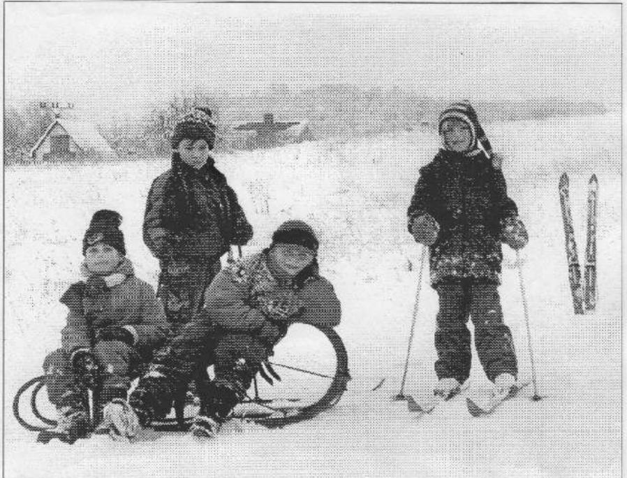
Na zasněžené svahy nad Zadní Třebaně se v minulých dnech vypravili místní školáci. Na saních i lyžích to svištělo jedna radost!

V první řadě bychom pořizovali sportovní vybavení, protože potřebujeme, aby děti měly více pohybu, aby kompenzovaly sezení ve škole. Potom také hudební pomůcky, myslím si, že hudební výchova na školách zaznamenává trvalý mímý úpadek. V neposlední řadě bychom dokoupili dost hraček do školní družiny. Zaznamenal Petr Musil