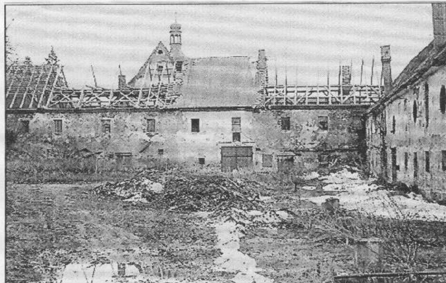
Po vyhnaných Němcích zůstaly na Sumavě (i jinde v pohraničí) kvetoucí vesnice a města. Po komunismu a komunistech už najdete už jen ruiny. Obraz znaru a beznaděje.