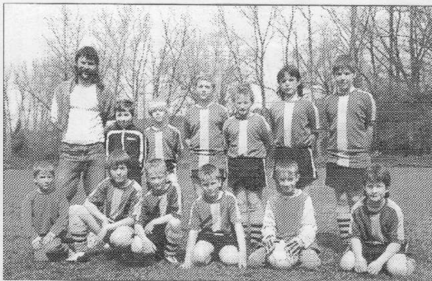
Nejmladší trebeňští fotbaloví záci po skončení turnaje, na kterém obsadili výborné druhé místo.

B-mužstvo: 17. 5. 17.00 TJ VYSOKÝ UJEZD - OZT, 25. 5. 17.00 OZT - SKP BEROUN B