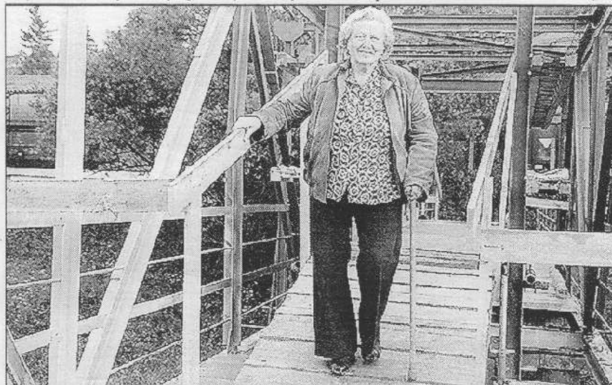
Hl. Třebeň - Přes jakýsi podivný můstek musejí nyní přecházet lidé na třebeňské lávce. Oprava do konce prázdnin hotova nebude.

a železnic. Na to navazuje výstavba domků. Nejinak tomu je i na levém břehu na katastrálním území Letů v části »Škabrlce«. Zástavba podél řeky končí v Řevnicích čistíčkou. Velkou překážkou je letovský most v hlavním proudu řeky. Na levém břehu se za hrází nachází část Letů nazývaná V Chaloupkách, kde se rozrostla už tak hustá zástavba. Naštěstí je pravý břeh bez zástavby. V katastru Dobřichovic se na levém břehu hromadně stavějí domy, které jako výsměch nám všem jsou vytaženy přízemím nad hladinu padesátileté vody, bez ohledu na to, že domy proti proudu v letovské části Na Víru na stížení odtoku velkých vod doplňují. To je podpořeno výstavbou bytovek u benzinky. Na pravém břehu přímo u řeky vyrostl autokemp. Ječíná stavba, jež zlepšuje odtokové podmínky, je nový dobřichovický most, při jehož výstavbě byl