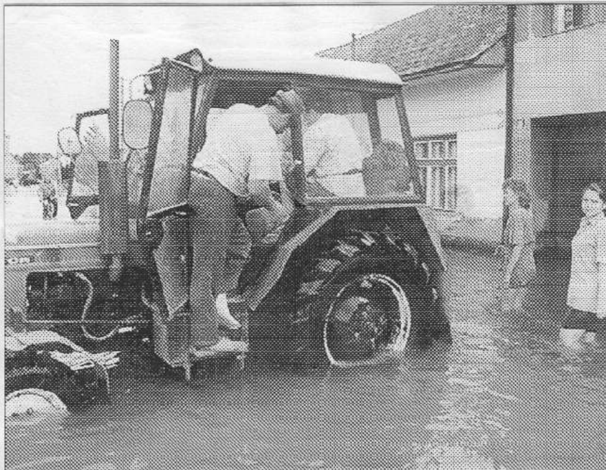
Mezi povodni nejvíce postižené obce patří také Cítov na Přerovsku. Takhle to tady vypadalo v okamžiku, kdy sem dorazila zasluka od zadnotřebaňských Našich novin.