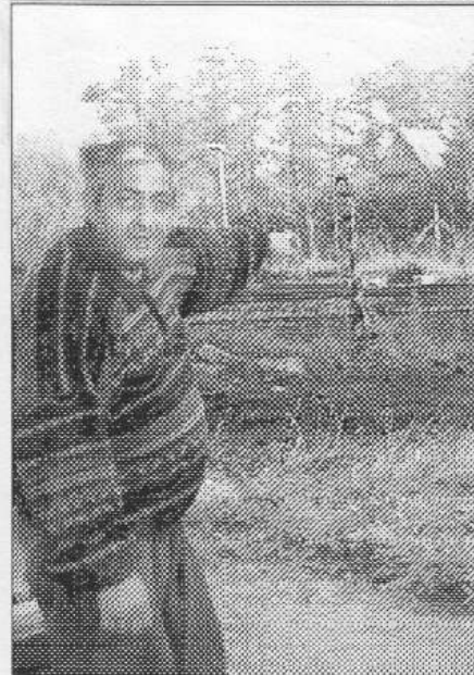
Dělník Rozvodných závodů ukazuje, kudy povedou dráty k nové trafostanici u třebaňského nádraží, jež má být hotova ještě letos.